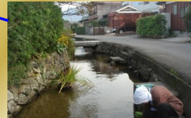
藍場川と市民生活