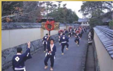
天神祭 手廻り備え行列