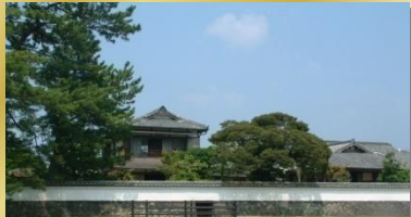
夏みかん栽培発祥の地でもある旧田中別邸