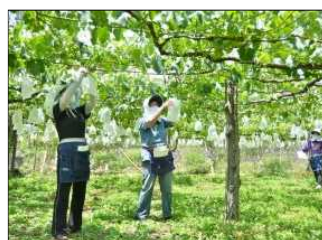
勝沼地域のブドウ栽培

長く培われてきた果樹栽培に関するものとして、松里地区の伝統産業である コロガキ生産にみる歴史的風致 、勝沼地域の圧倒的な景観をつくる ブドウ栽培にみる歴史的風致 、広大な土地にくまなく水を送るための 笛吹川水系のセギにみる歴史的風致 があります。