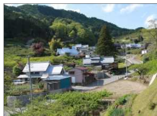
上条伝統的建造物群保存地区

市街地と山間地をつなぐ青梅街道沿いには、山間の地区で同じ日に行われる2神社の祭礼についての 神部神社と金井加里神社の祭礼にみる歴史的風致 、塩山地域の中心市街地に息づく 塩ノ山南麓の市街地の営みにみる歴史的風致 があります。