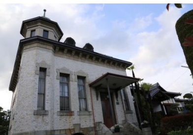
■国登録有形文化財「奥山家住宅」