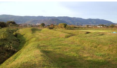
■国史跡「阿津賀志山防塁」(下二重堀地区)