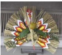
年中飾られる注連縄

宗像地域の近海は古来より漁業資源に恵まれており、鐘崎や神湊、大島、地島では現在も多くの人が漁業を生業としている。これらの地域では日々の暮らしの中に豊漁と航海安全を祈り、感謝を捧げる様々な神々がいて、その信仰や風習が今も息づいている。