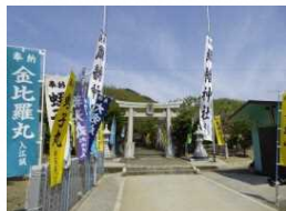
織幡神社春季大祭