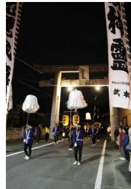
参道を進む御神幸行列

吉武地区の八所宮の御神幸祭は、神社と地域の人々が一体となって里の恵みに感謝し五穀豊穡を祈る祭りであり、その周辺に広がる田園風景と農村集落のまちなみが一体となったこの地域独自の歴史的風致を形成している。