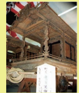
鬼無里神社の屋台