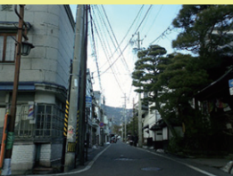
電線類地中化路線 (善光寺周辺釈迦堂通り)