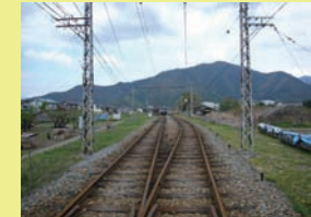
文化財等周遊道路整備