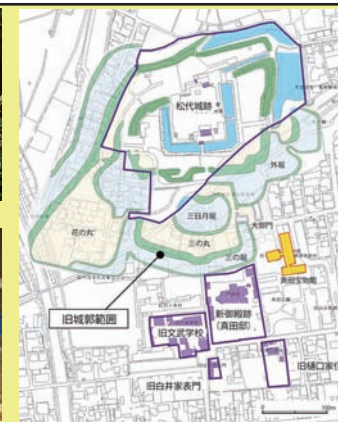
史跡松代城跡と旧城郭域