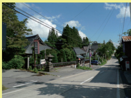
電柱電線類移設等の路線 (戸隠中社地区)