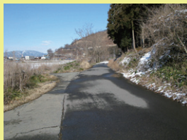
史跡大室古墳群に通じる現道