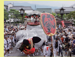
弥栄神社の御祭礼