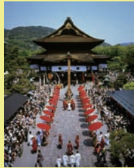
中日庭儀大法要 (天台宗)

善光寺では、数え年で7年に一度の丑と未の年に前立本尊の御開帳が催されています。期間中は、「中日庭儀大法要」をはじめ、様々な法要等が行われます。