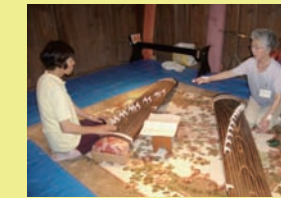
文化財ボランティア