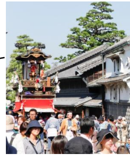
有松の町並みと山車祭り

有松では、東海道の歴史的な町並みを背景に山車祭りが行われ、美しい歴史的風致を形成しています。