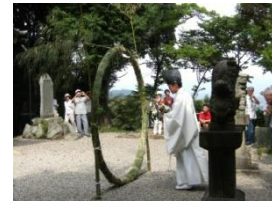
尾張戸神社の茅の輪ぐり

上志段味地区には、市内最古の大型前方後円墳である白鳥塚古墳をはじめ、多くの古墳が残されており、古代に活躍した尾張氏のルーツの地と考えられています。古墳の上に建立された尾張戸神社や勝手社では、茅の輪ぐりなどの伝統行事が行われ、地域の歴史を感じることができます。