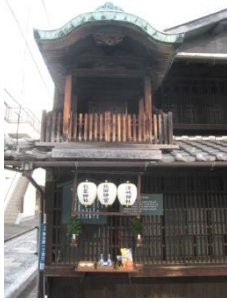
四間道界隈の屋根神

名古屋城と城下町の建設にあわせて開削された堀川の舟運は、名古屋の発展に大きく貢献しました。堀川沿いに形成された町である四間道界隈では、今でも蔵の立ち並ぶ景観や昔ながらの路地を背景に屋根神信仰、地藏盆、浅間神社の祭りなどが行われ、下町情緒を醸し出しています。