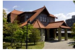
文化のみち二葉館

名古屋城から徳川園に至る一帯を「文化のみち」として育み、「文化のみち二葉館」「文化のみち榎木館」の管理運営や、旧豊田佐助邸・旧春田鉄次郎邸などを活用した各種展示や催しを行い、貴重な建築遺産の保存活用を進める。