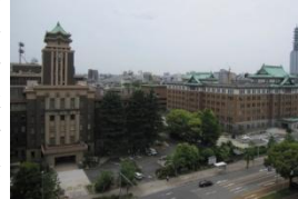
市役所本庁舎(左)と県庁本庁舎

帝冠様式の近代建築として登録有形文化財となっている市役所本庁舎・県庁本庁舎について、両者の並立する景観と歴史的価値の維持向上を図るとともに庁舎の公開等を行う。