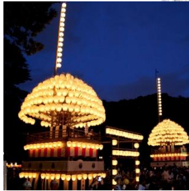
熱田祭（献灯まきわら）

熱田神宮等では、様々な伝統行事が続けられています。熱田祭（例祭）に出される献灯まきわらは、かつて熱田の人々によって出された山車に由来するものです。また、市内には、熱田神宮ゆかりの古墳や神社が多く、断夫山古墳では御陵墓祭が、氷上姉子神社に隣接する大高斎田では熱田神宮へ奉納する稲を植える御田植祭が行われています。