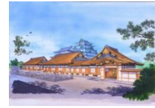
本丸御殿復元イメージ

戦災で昭和20年に焼失した名古屋城本丸御殿を、史実に基づき忠実に復元する。平成25年5月29日に第1期公開（玄関・表書院）を開始。平成30年度全体公開予定。