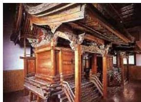
重要文化財(大館八幡神社)

大館八幡神社や桜櫓館、大館神明社などの歴史的な建造物を保存補修し、後世に継承する。