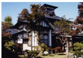
登録有形文化財(桜櫓館)