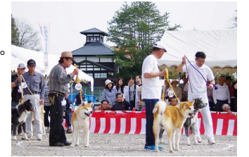
秋田犬本部展示会

秋田犬は大館の先人たちが結成した秋田犬保存会の尽力により、日本犬で初めて天然記念物に指定された。保存会は展示会を開催するなど現在まで、その血脈を守り続けている。 大館駅前には、大館生まれの秋田犬である忠犬ハチ公の像があり、毎年慰霊祭や生誕祭が行われている。 市内各地に秋田犬の像やデザインがあり、秋田犬を愛する市民の深い愛情が受け継がれている。