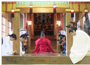
扇田神明社例祭の神事

扇田神明社には、住民が誇りとする佐竹宗家ゆかりの御神輿があり、毎年7月の例祭では扇田地区を古式に則って渡御される。 また、火伏祭りのジャジャシコは、各家々を祓い清めて回る、春一番の風物詩である。 扇田の人々は古くからの例祭や行事を、伝統としきたりを守って現代に受け継いでいる。