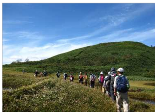
半夏生の参拝登山

田代岳は、山そのものが御神体で、毎年7月2日頃の半夏生に、9合目湿原の池塘で行う作占いの神事が続けられている。 山頂の田代山神社の例祭を訪れる参拝者は、豊作と家内安全を願い、笹やツゲを持ち帰り、田の水口に立てて虫除けとする習わしが今も続いている。