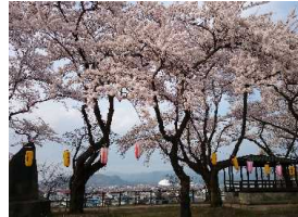
桜が満開の桂城公園

大館城本丸跡の桂城公園を、新庁舎建設事業と連携して、城址公園にふさわしい景観の形成と、にぎわいの創出をめざす。