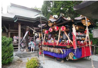
大館神明社に参拝する山車

江戸時代の初めに大館佐竹氏により作られた城下町大館には、町割り当時の地名が今に残る。大館神明社の秋の例祭ではその町内を御神輿が巡り、山車が賑やかな音を奏でながら練り歩く。 また城下に開かれた「市」が起源と伝えられる大館アメッコ市が冬の風物詩として現代に受け継がれている。