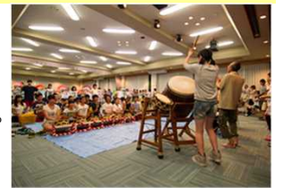
大館囃子の合同練習会

民俗文化財や郷土芸能の調査や記録保存を行い、活動を継続するための支援につなげる。