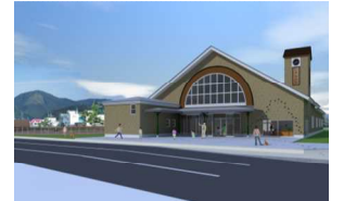
ハチ公の駅(仮称)整備イメージ図

天然記念物秋田犬の歴史や文化の情報を発信し、地域の歴史的資源を巡るまち歩きを推進を図る。