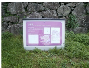
色あせた説明看板（城山公園）