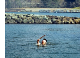
ナゲと大洲神伝流泳法

本市を縦断する肱川には、「ナゲ」(水制)をはじめ、洪水との戦いの歴史を語る様々な建造物が残されている。このような環境の中で、四季を通じ、弁財天祭・住吉祭の花火大会、大洲神伝流泳法、瀬張り漁などの伝統的な行事や生業が行われている。