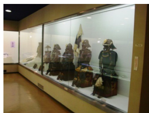
大洲城の関連資料の一部

市の歴史や文化財、大洲城に関連する資料などを紹介するための展示・解説に加え、来訪者自らが体験し学習できるような施設として歴史資料館を整備する。