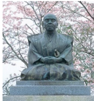
城山公園の藤樹銅像

「日本陽明学の祖」として知られる中江藤樹の学問や思想は、深く大洲の地に根ざし、その顕彰活動が活発に行われている。藤樹銅像が各地に設置されるほか、藤樹の遺徳を伝えるため、毎年「藤樹まつり」が行われている。