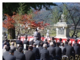
「藤樹まつり」の式典