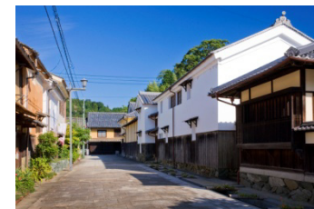
おはなはん通りの町並み

重点区域内の歴史的な町並みを構成する建造物について、保存対策を講じるための調査を実施する。