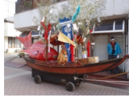
紺屋恵比須の船車