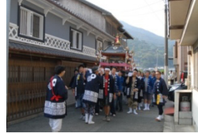
旧末永家住宅の前を通る神輿

藩政期に湊町として整備された長浜地区には、海運業で栄えた末永家の旧住宅(明治期)などが残るとともに、航行の安全や大漁を祈願する「住吉神社の祭礼」「紺屋恵比須」が受け継がれており、湊町としての風情を感じることができる。