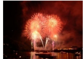
弁財天祭の花火大会