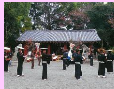
上神谷のこおどり

地域性や自然環境に即して形成された多様な集落では、桜井神社をはじめとする由緒ある神社を中心に豊穡や豊漁を祈念する個性豊かな祭礼が地域住民によって行われ、伝統を受け継ぎ、守り続ける地域の誇りとなっています。