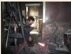
堺打刃物の製造風景

環濠都市内の町家で今も製造販売が行われている刃物や線香などの伝統産業は、歴史的に先進性・個性・創造性を持った世界に誇る匠の技術に支えられており、訪れる人々の多くがその技と特別な空間に魅了されます。