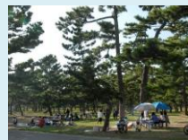
大松林の下での行楽

古くからの景勝を今に受け継ぎ、歴史香る憩いの場として親しまれている浜寺公園や大浜公園は、各時代に行楽地として最先端を歩み、昔も今も変わることなく、多くの人々に親しまれ、その賑わいは絶えることがありません。