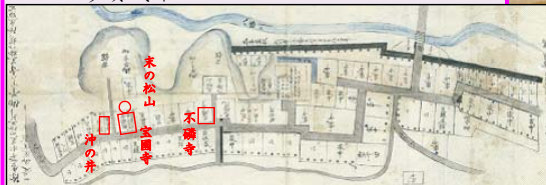
宮城郡八幡巴天童氏屋敷並びに家中・足軽屋敷絵図(1681年)