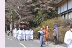
塩竈街道を通る神興