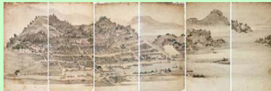
市重要文化財 紙本著色竹原絵屏風