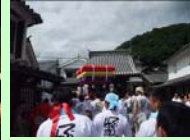
磯宮八幡神社例大祭の蒲団太鼓