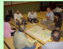
ワークショップ(イメージ)

ワークショップや関係団体との意見交換等を通じて、既存施設の有効活用を含めた歴史・文化交流施設の整備の方向性を検討します。