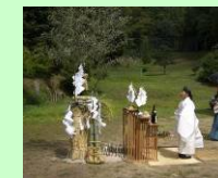
田万里八幡神社当屋祭