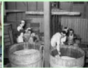
昭和35年頃の酒造り(中尾醸造)