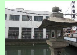
旧広島銀行竹原支店

建造物の除去により景観を向上させ、観光客と地域住民の憩いの場・交流の場として小公園を整備します。