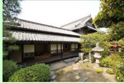
市重要文化財 森川家住宅

竹原市重要文化財 森川家住宅について、 破損・劣化の詳細調 査を行い、改修方針 を決定し、修理を行 います。