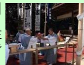
田万里八幡神社当屋祭

中世から伝わる当屋祭は、田万里八幡神社の歴史的な建造物と一体となり、荘厳な時の流れを感じることができます。