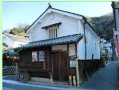
まちなみ竹工房(旧城原家土蔵)

竹原市のシンボル である竹を使った工 芸品の創作等を行う まちなみ竹工房(旧城 原家土蔵)について、 外観・内装を修理し、 活用します。