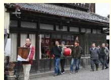
恵比寿講での町廻りの様子

早春に行われる恵比寿講は、歴史的建造物が数多く残される城下町で行われます。華やかさはないが昔ながらの町家と溶け込んだ城下町住民の繁栄を支えてきた町家の人々の住民活動の礎となる行事です。