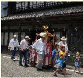
八朔祭の御神幸の様子

西宮神社の鎮座する本町地区の氏子により行われる八朔祭は、塩屋土蔵や旧竹屋書店などの歴史的建造物が残される通りの店先に日用品で造られた見立て細工が飾られる、城下町の風物詩となっています。