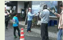
岡城跡で案内を行う子供ガイド

城下町や岡城跡で案内ガイドを行う団体に對し、統一した内容で案内を実施できるようにガイド研修や案内テキスト等を作成するなど、必要な支援を行います。