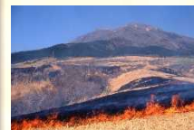
久住高原の野焼き

久住山の麓に広がる久住高原では、野焼きが行われ、牛馬の飼育に必要な草場が維持されています。広大な草場は、高原に住む人々と大自然の共生により造られたものです。