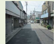
空き家・空き店舗状況

空き家や空き店舗の有効活用をとおして、城下町を形成する建造物を再生し、地域の活性化及び良好な景観形成の促進を図ることを目的に、再生に必要な改修等に対し補助金を交付します。