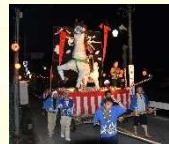
久住夏越祭の曳山車行事

8月に久住神社とその周辺地域で行われる久住夏越祭では、神輿の神幸や曳山車の「ヤママヤレ、元氣出せ」の掛け声と山車囃子の音色が、高原の町久住に夏の訪れをつける風物詩となっています。