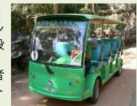
周遊バスのイメージ

城下町と岡城跡を回遊する周遊自動車等やレンタル自転車等の交通手段を構築することにより、高齢者や身障者の来訪者に対し優しい回遊ルートを構築します。