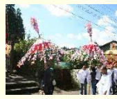
神保会行事の神幸行列

10月に宮処野神社とその周辺地域で開催される宮処野神社神保会行事では、獅子舞や白熊が先導する華やかな御神幸行列が整然とした姿で田園風景が広がる都野地区を進んで行きます。