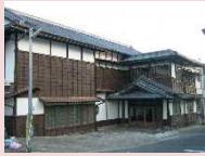
竹田市公民館竹田分館 (旧一味楼) ※整備例

竹田城下町地区における民家や店舗の所有者が、歴史的建造物等の特性を活かした協定を締結した上で屋根・外構等の建物修景を「竹田地区街並み形成景観・修景ガイドライン」に沿って行う場合に、経費の一部について補助を行います。