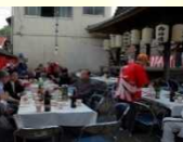
神明社の大祭の様子

5月に行われる古町地区の神明社の大祭は、神事や神楽の奉納が行われます。参拝者に寿司が振舞われることから「すし祭」とも呼ばれ、城下町の入り口として繁栄してきた古町地区の固有の歴史的風致を見ることができます。