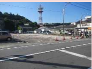
城下町回遊館建設予定地

城下町の中心部に位置した場所に、城下町を訪れる来訪者のための案内施設及び地域住民の文化拠点施設とし、誰もが気軽に訪れ交流を深めることができ、中心市街地の賑わいを創出できるような施設整備を行います。