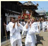
夏越祭の御神幸の様子

城原八幡社の神輿が城下町へ御神幸し城下町の3社を廻る夏越祭は、氏子である城下町の町家の人々により、江戸時代から継承されています。城下町と農村部の人々の繋がりが感じられる竹田の夏の情景です。