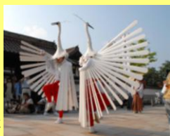
津和野弥栄神社の鷲舞

重要無形民俗文化財の津和野弥栄神社の鷲舞は、毎年7月20日と27日に弥栄神社や歴史的建造物が数多く残る旧城下町で行われます。