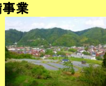
国道9号から見る棚田と街の風景