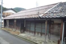
旧城下町内にある空き家