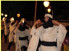
津和野踊(盆おどり)

殿町通りをはじめとした旧城下町では、仏教行事として4月の花まつり、盆の津和野踊(県指定無形民俗文化財)が、宗派を超えて行われます。