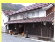
華泉酒造場(登録有形文化財)

旧城下町一帯では、青野山の伏流水が各所に湧き出ており、現在も4軒の酒造場が、登録有形文化財を含む歴史的建造物を利用して酒造りを行っています。