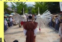
津和野弥栄神社の鷺舞