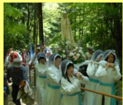
乙女峠の坂を上る信者たち

乙女峠まつりは、毎年5月3日に開催され、津和野カトリック教会(登録有形文化財)をスタートし乙女峠まで行進し、ミサが行われます。