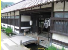
津和野藩校養老館