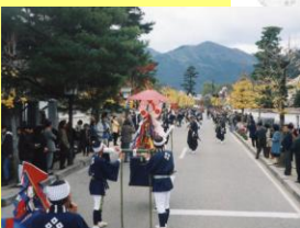
殿町通りと奴行列

奴行列は、毎年11月23日に近い日曜日に、殿町や本町通りなど旧城下町で行われます。参勤交代を模したものです。