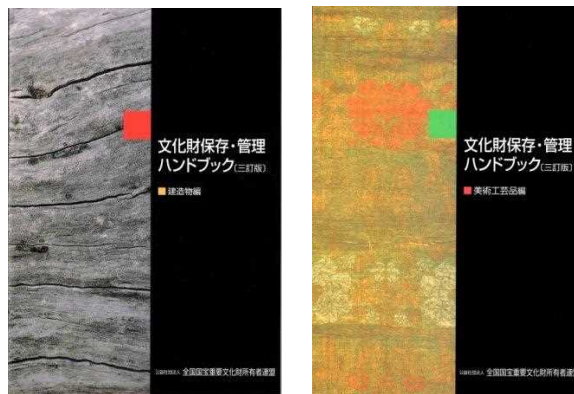
文化財保存・管理ハンドブック — 建造物編 — — 美術工芸品編 —