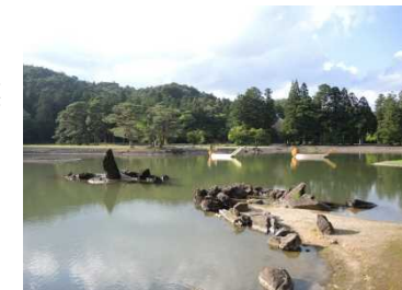
(平泉-仏国土(浄土)を表す建築・庭園及び考古学的遺跡群-)

映像の動画配信を含めたHP制作、 義経の物語にちなむ伝統芸能等の フェスティバルを開催や歴史体験事業を併せて開催