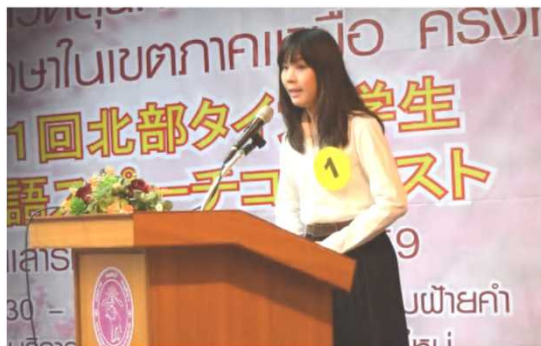
事業例①: 日本語スピーチコンテスト

在外公館では、日本の伝統文化から漫画・アニメ等ポップカルチャーに至る幅広い日本文化の紹介事業を実施。平成28年度には、日本語教育関係事業として、日本語学習者の学習意欲の維持・向上を目的にした「日本語スピーチコンテスト」等245件を実施。