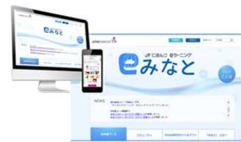
日本語をいつでも、どこでも学べます