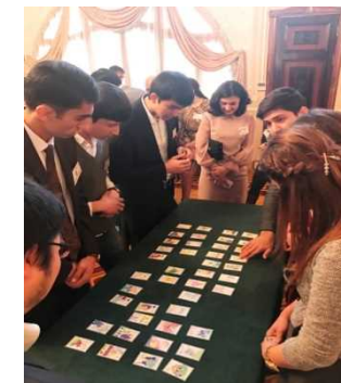
事業例③: かるた大会