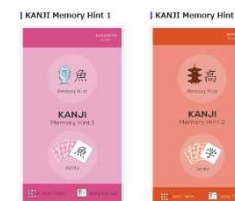
2016年度に日本語学習管理システム「みなと」をWEBサイトで一般公開。また、学習アプリ「KANJI Memory Hint 1・2」を提供開始。