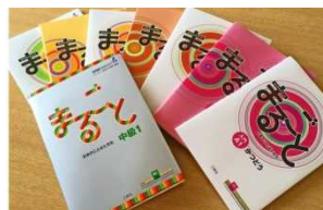
2016年度に日本語教材『まるごと』の一般販売の累計部数が10万部を突破。