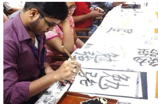
事業例②: 書道ワークショップ