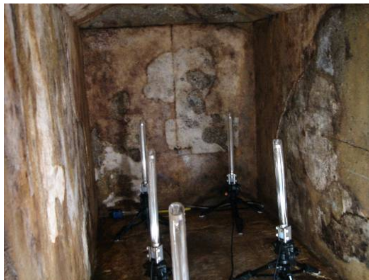
殺菌灯を設置した石室内の状況

石室内に殺菌灯を設置し、1日に1時間程度、紫外線を壁面に照射し、生物制御を図っている。