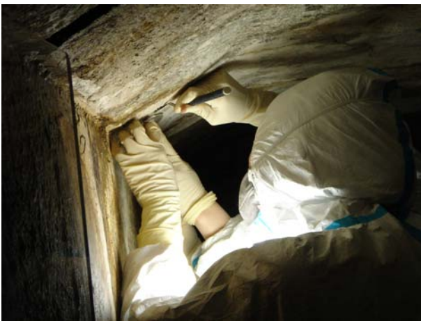
ヘラによる取り外し