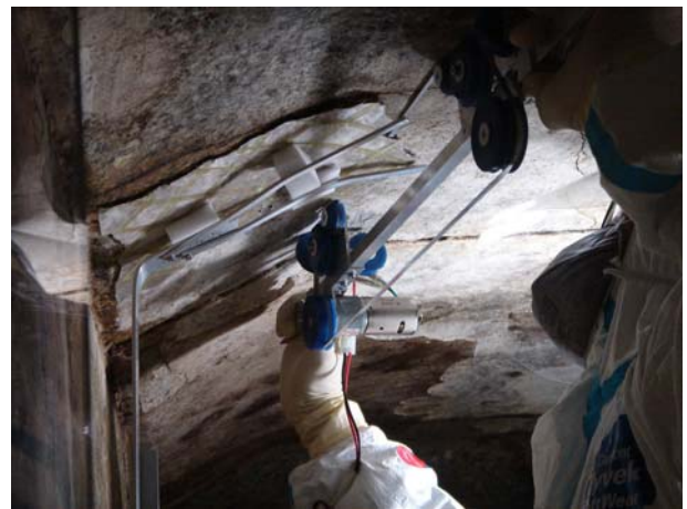
ダイヤモンド・バンドソーの使用