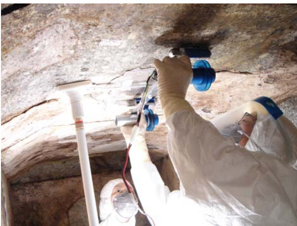
ダイヤモンド・ワイヤソーによる取り外し