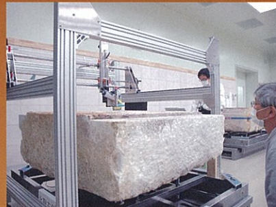
科学分析(顔料等調査)の様子