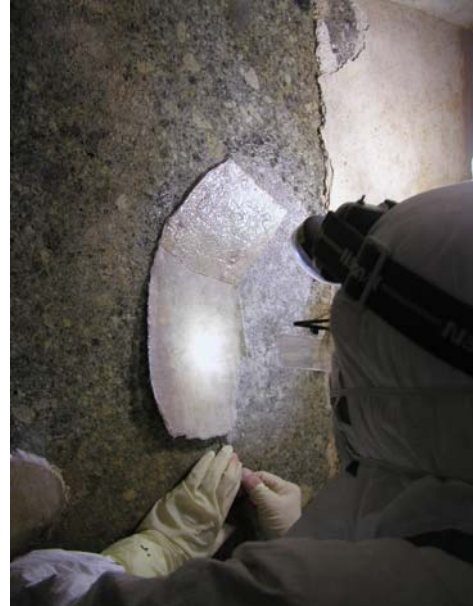
②へらを入れて剥ぎ取り作業