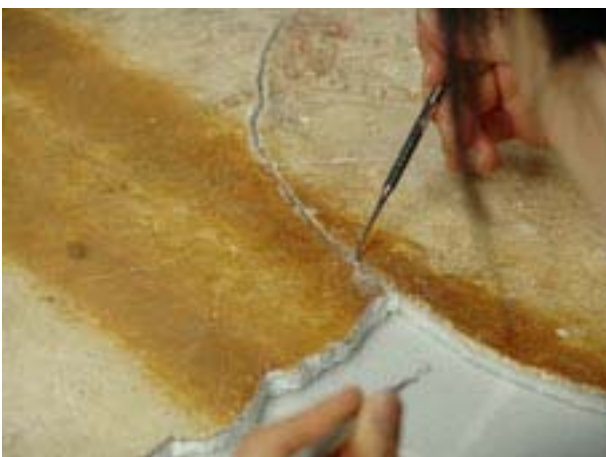
⑤仕上げ（胴・前脚の隙間調整）