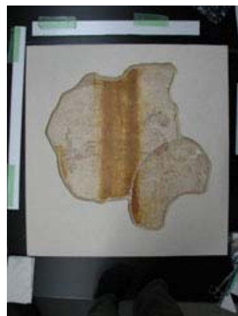
⑥パネルへのセット