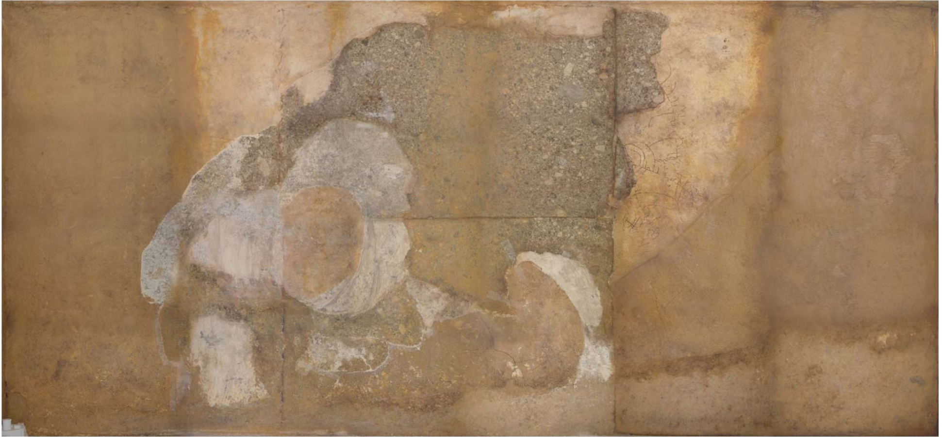
東壁漆喰片取り外し後壁面 (070130 現在)