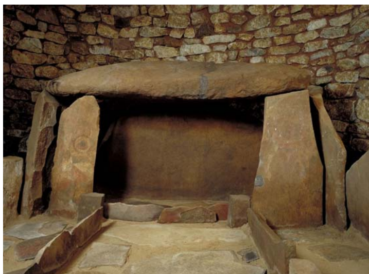
熊本県植木町横山古墳