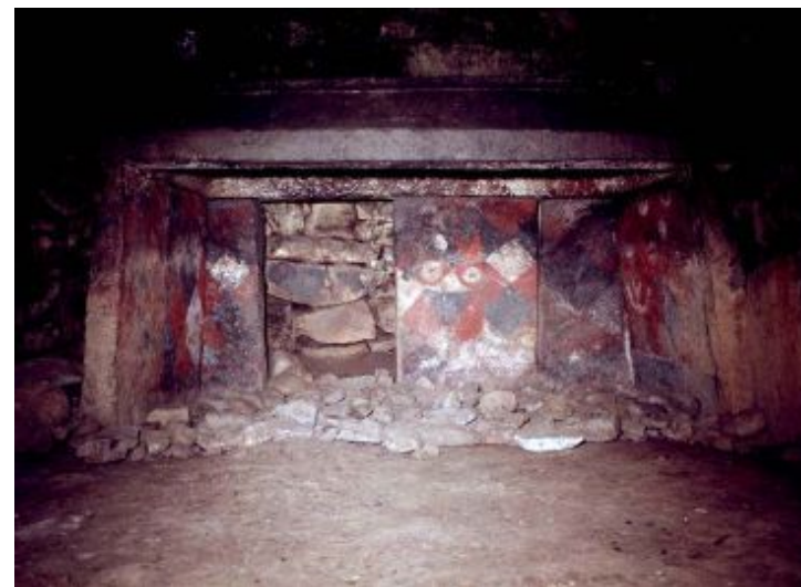
熊本県山鹿市チブサン古墳