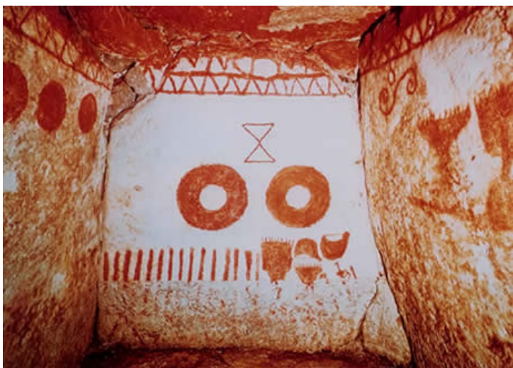
茨城県ひたちなか市虎塚古墳