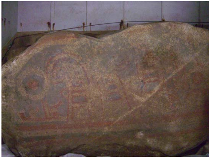
福岡県うきは市珍敷塚古墳