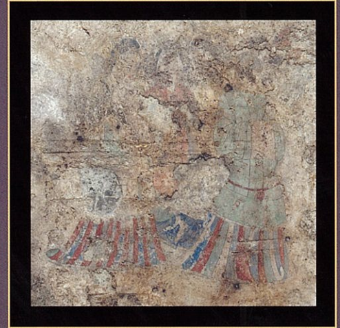
東壁女子群像(拡大)