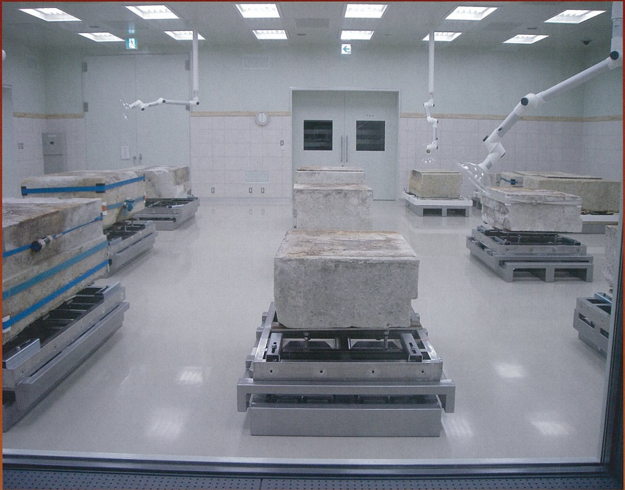
見学用通路の窓ガラスから見た修理作業室内