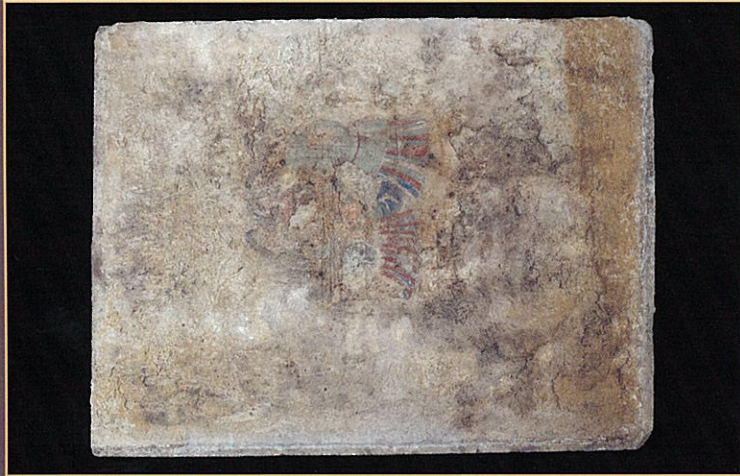
東壁女子群像(石材)の写真