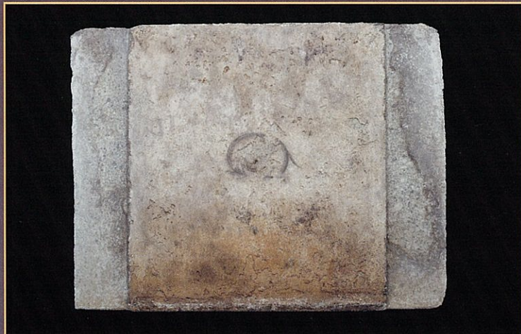
北壁玄武(石材)の写真