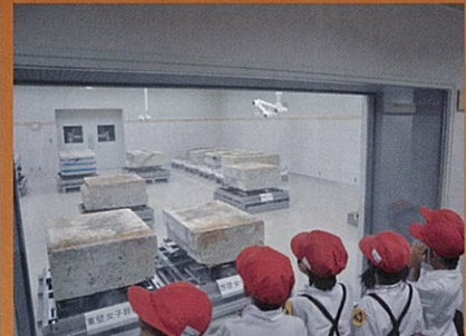
平成21年 春の公開時の様子