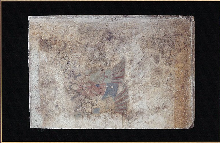
西壁女子群像(石材)の写真