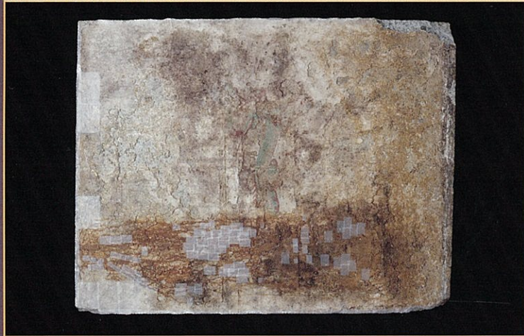
東壁青龍(石材)の写真