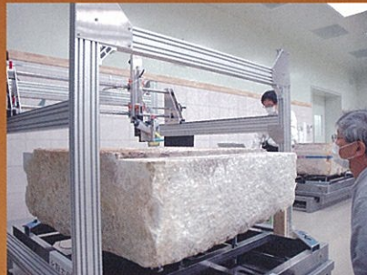
科学分析(顔料等調査)の様子