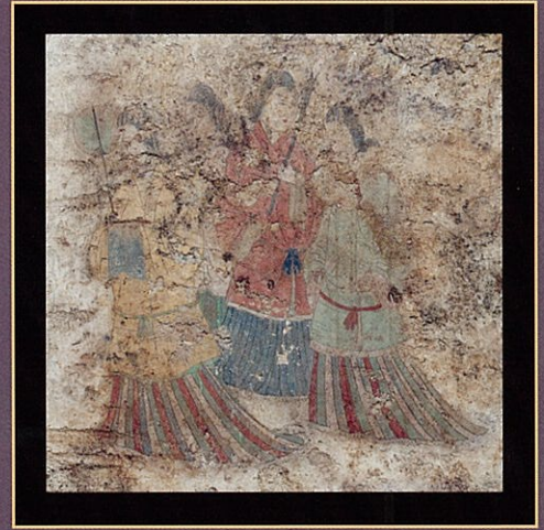
西壁女子群像(拡大)