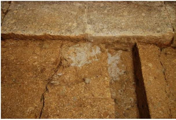
49：壁石際の遺構検出