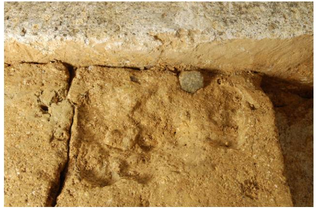
50：壁石際に残る窪み（テコの痕跡か）