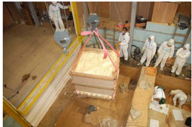
22：白色版築層の切り取り風景