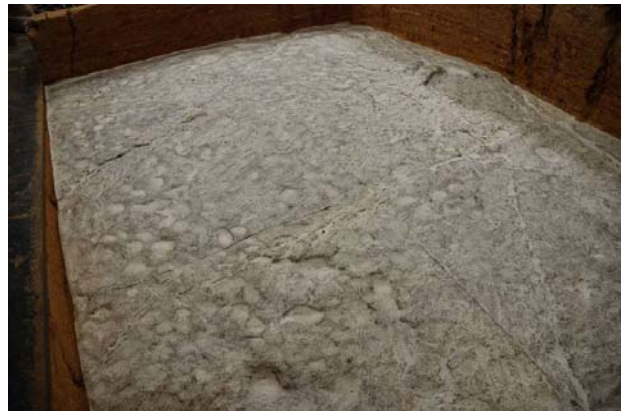
6 : 搗棒痕跡の拓本採取