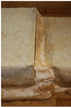
25：天井石の目地留め漆喰