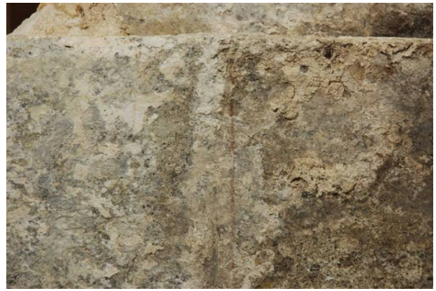
58 : 壁石に残る朱線