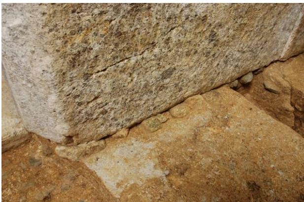
47：壁石下端に詰められた小石