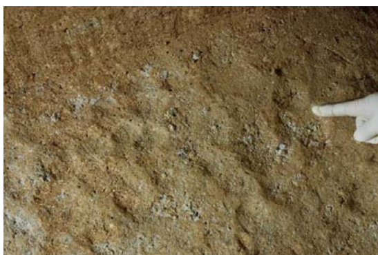
69 : 作業面に残る搗棒痕跡