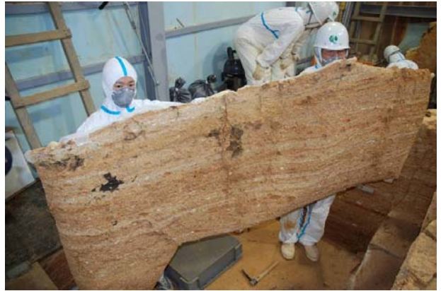
20：剥ぎ取った白色版築層断面