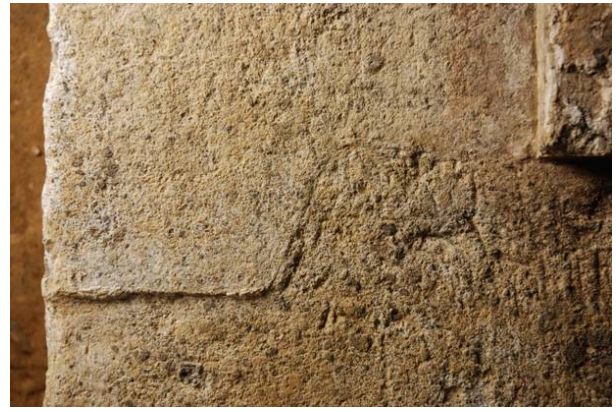
76 : 床石上面の加工痕跡 (西壁石1と閉塞石接着部)