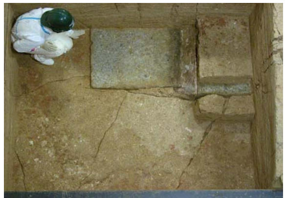
14 : 天井石の検出