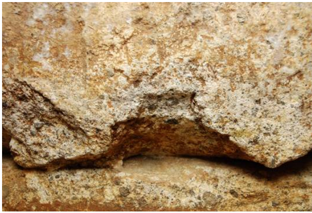
41：閉塞石下端のテコ穴