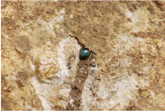
73 : ガラス栗玉の出土状況