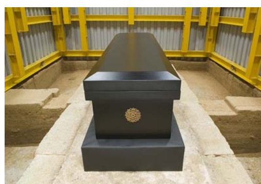
72 : 漆塗棺レプリカの設置