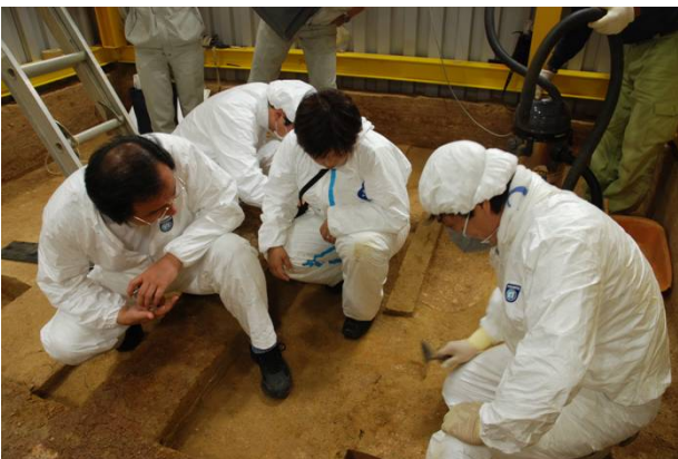
23：地質・地耐力の調査