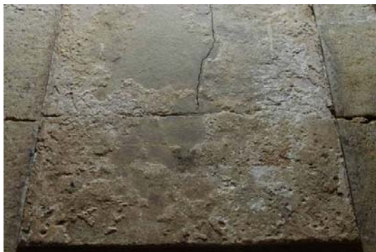
71 : 床面漆喰の残存状況