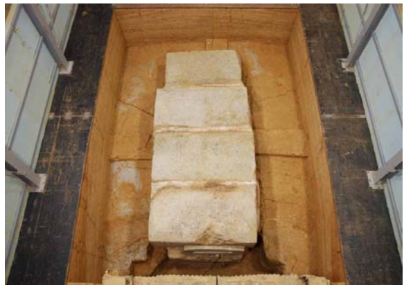
16 : 天井石架構時の作業面の検出