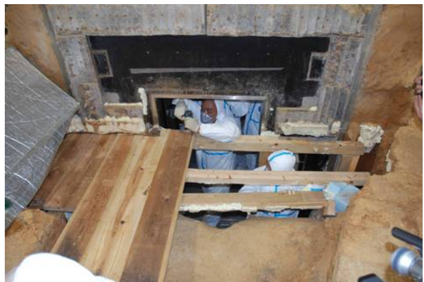
8 : 取合部仮養生施設の撤去