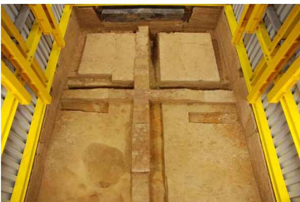
87：発掘調査終了写真