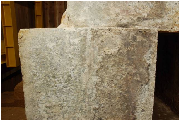
57 : 壁石に残る朱線