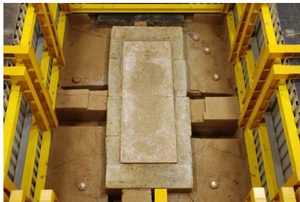
66 : 床第 5 作業面の検出