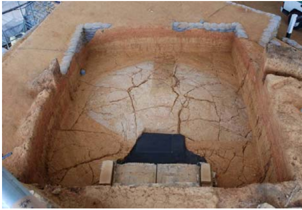
1 : 上段調査区の下から顔を出した白色版築