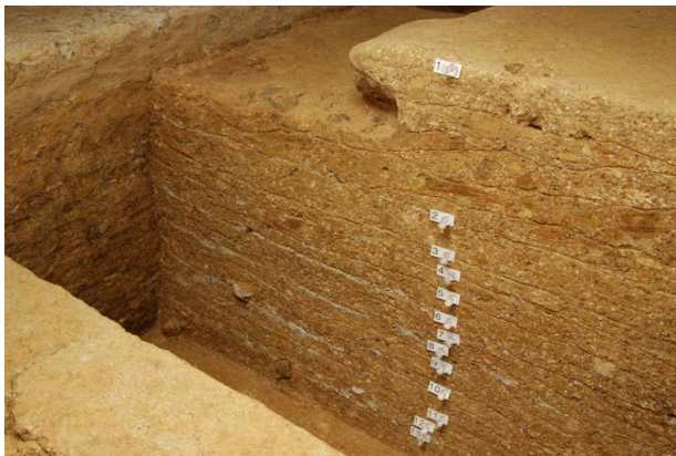
61 : 床石周囲の版築層断面