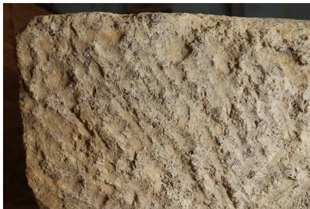
31：石材加工痕跡の細部写真