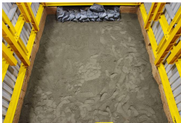
88：遺構面保護の砂入れ