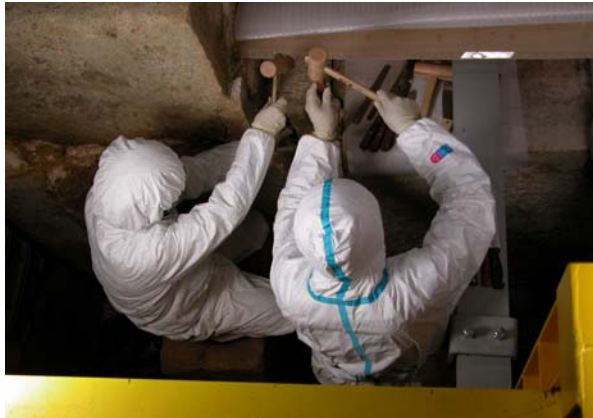
35 : 漆喰の取り外し作業