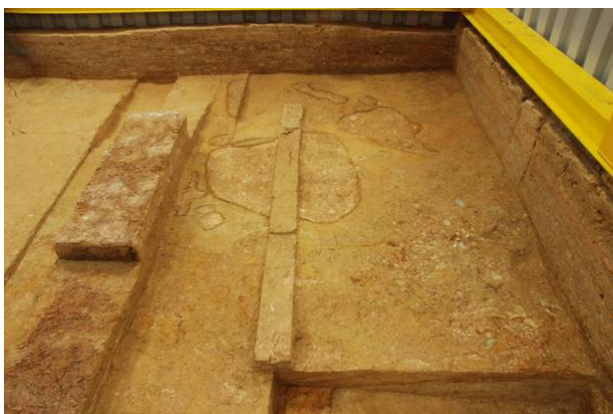
83：地山面の遺構検出