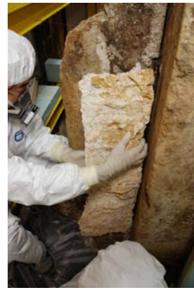
34 : 漆喰の取り外し作業