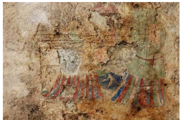
56：壁画面に残る棺の擦痕