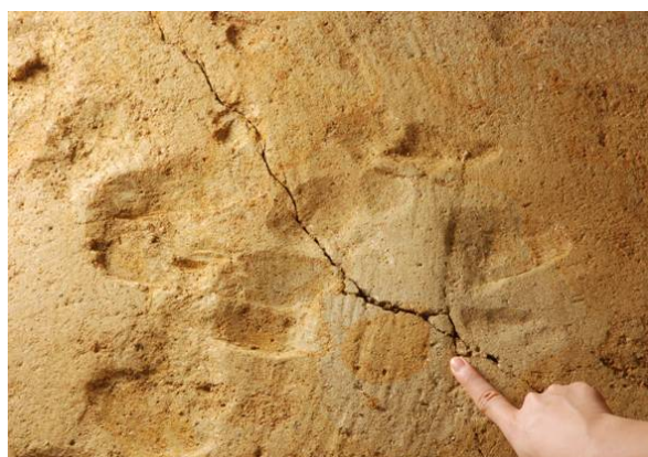
86：地山掘削の工具痕跡