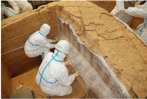
19：白色版築層の土層転写(剥ぎ取り)