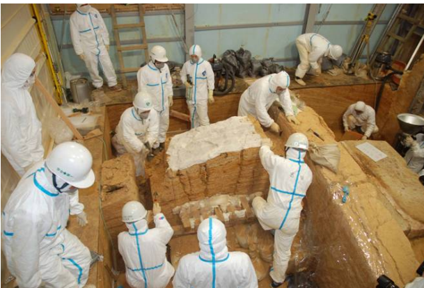
21：白色版築層の切り取り保存