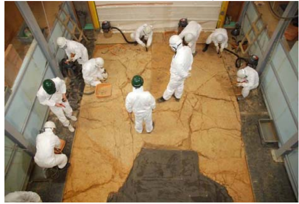
2 : 下段調査区の調査開始