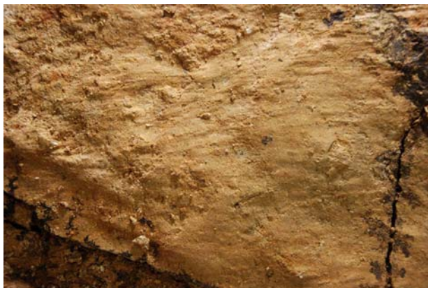
7 : 白色版築層上面のムシロ痕跡