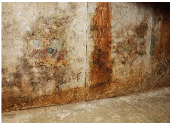
55：壁画面に残る棺・棺台の擦痕