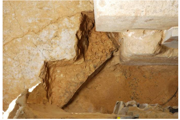
10 : 墓道部の掘り下げ