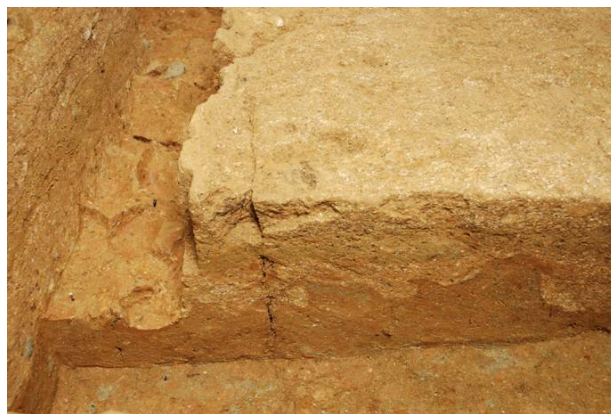
82：搗棒痕跡と土層断面