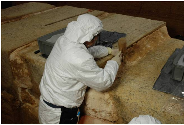
33 : 漆喰の取り外し作業