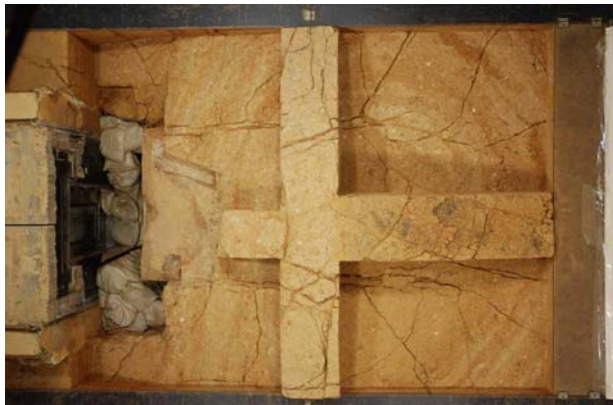
13 : 天井石直上の地震痕跡