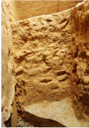
11 : 墓道西壁の掘削工具痕