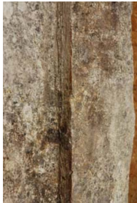
59 : 壁石に残る朱線