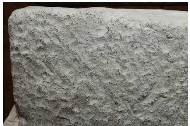
32：石材加工痕跡の拓本