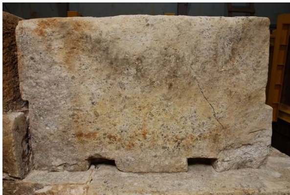
37 : 天井石のテコ穴と合欠