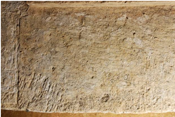
75 : 床石上面の加工痕跡