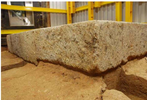
77 : 床石の東側面