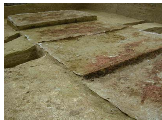
80 : 床石下に残る段差