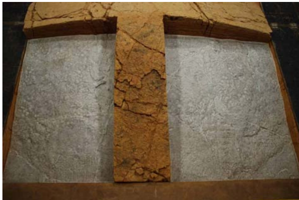
5 : 搗棒痕跡の拓本採取