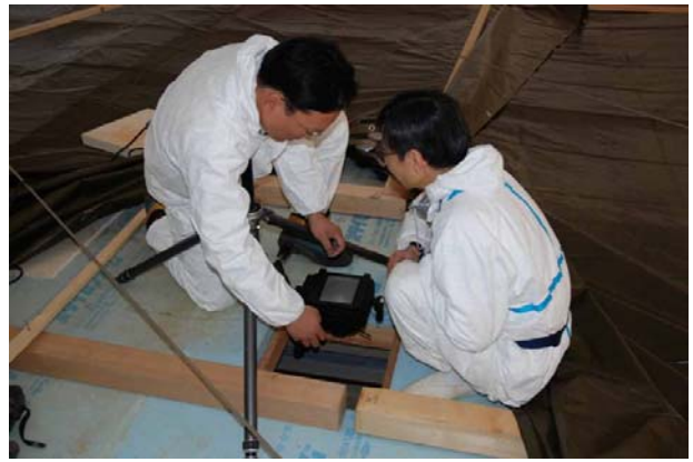
18：断熱覆屋屋上からの写真撮影