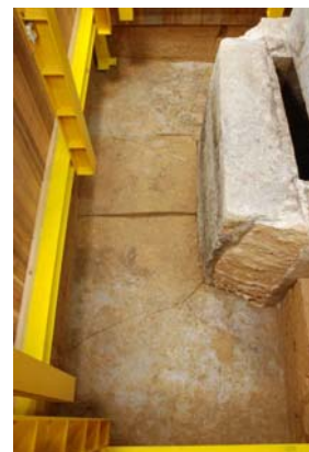
64 : 床第1作業面の検出