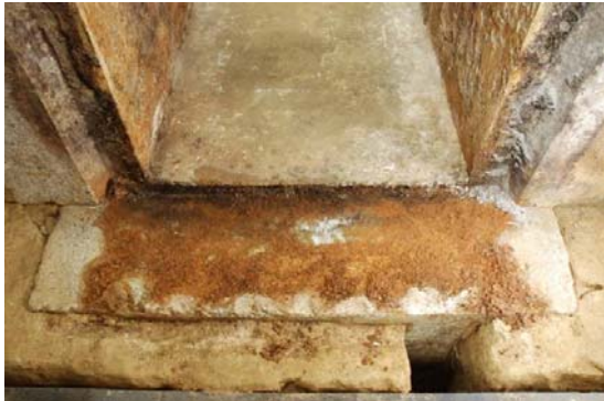
43：閉塞石取り上げ直後の状況