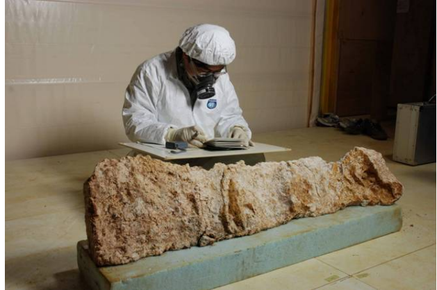
36 : 取り外し漆喰の調査