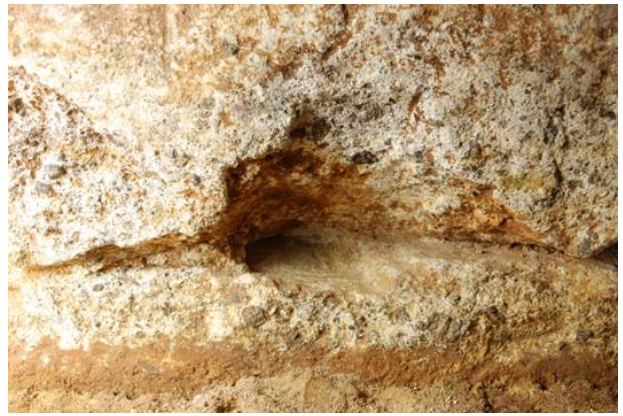
42：閉塞石下端のテコ穴