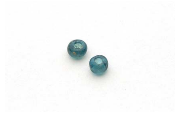
74 : 出土したガラス栗玉