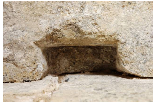
38 : 天井石のテコ穴