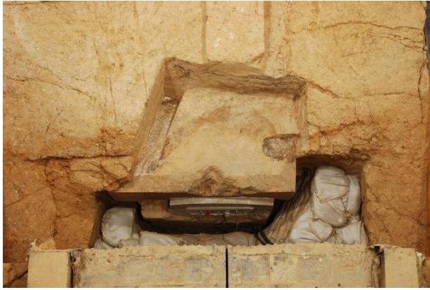
9 : 墓道西肩の検出