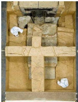
15 : 姿を現した天井石