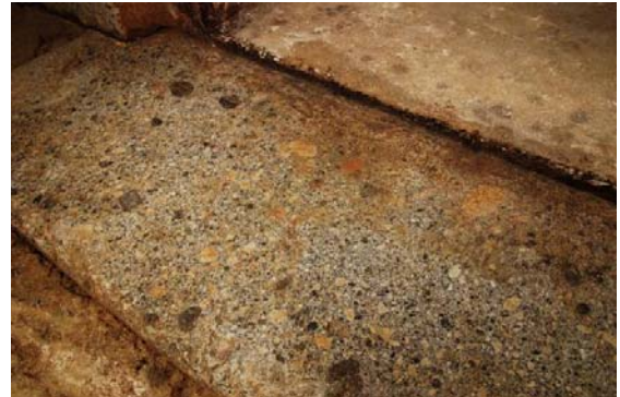
44：閉塞石直下の赤色顔料