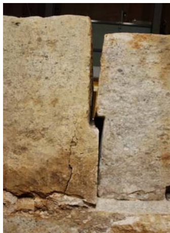
39 : 天井石の合欠