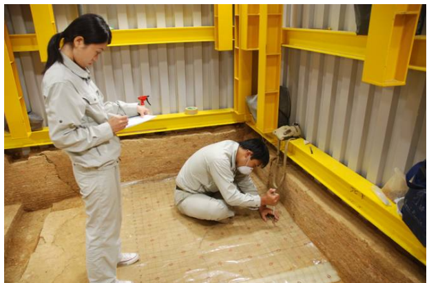
24：地耐力調査（針貫入試験）