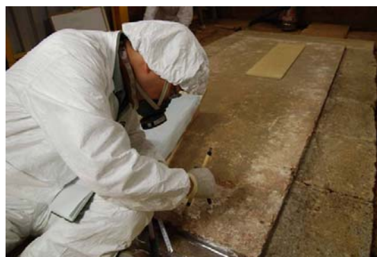
70 : 床面の精査 (棺台痕跡の検出作業)