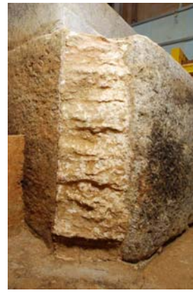
26：石室北東隅の目地留め漆喰