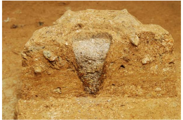
52：水準杭の柱痕跡断面