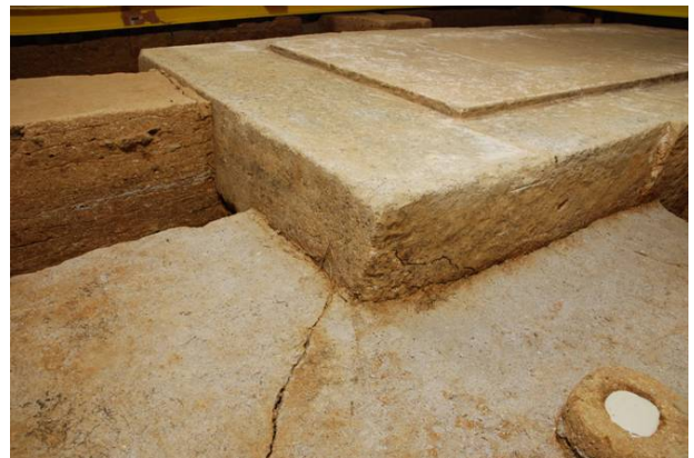
62 : 凝灰岩粉末が散布する作業面