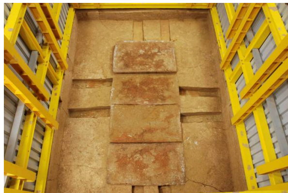
79 : 床石取り上げ後の状況