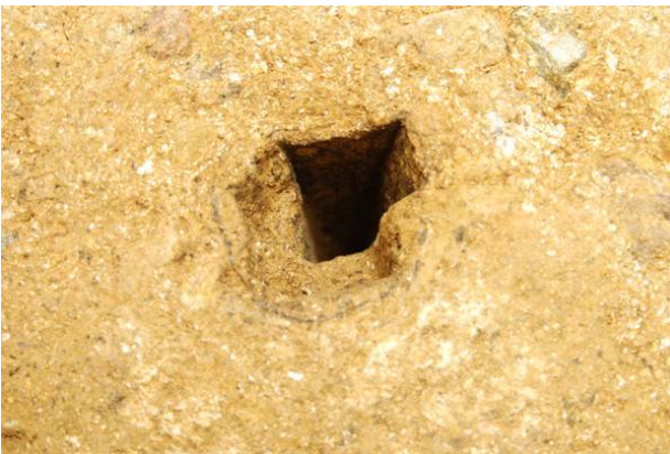
53：空洞化した水準杭の腐朽痕