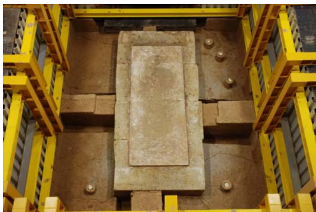
67 : 床第 10 作業面の検出