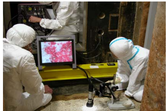
46：赤色顔料の分析調査