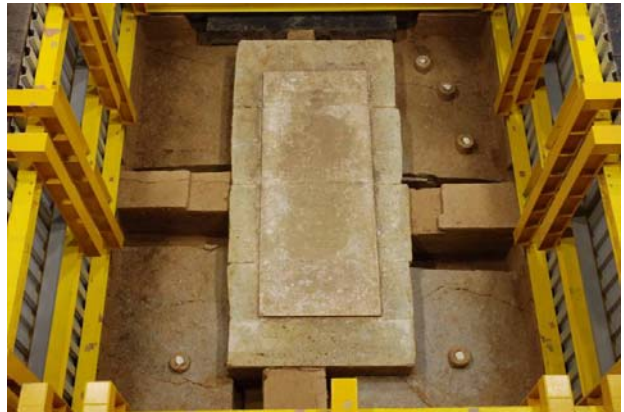
60 : 床石周囲の版築層の掘り下げ