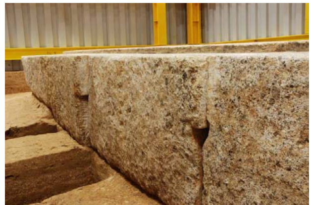
78 : 床石の西側面