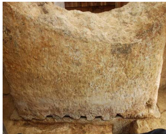
40 : 閉塞石下端のテコ穴