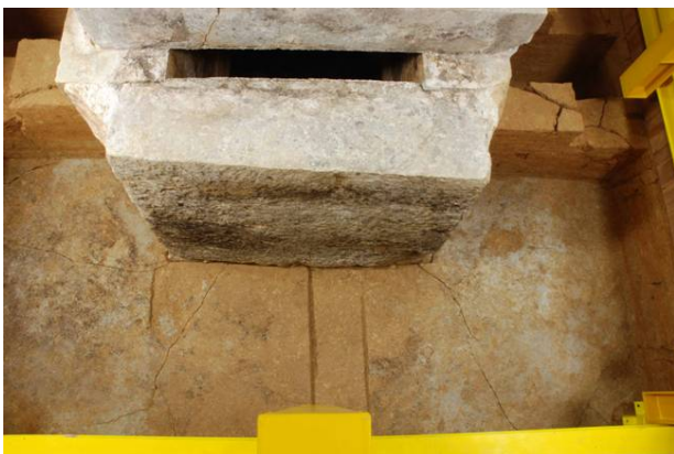
63 : 床第1作業面の検出