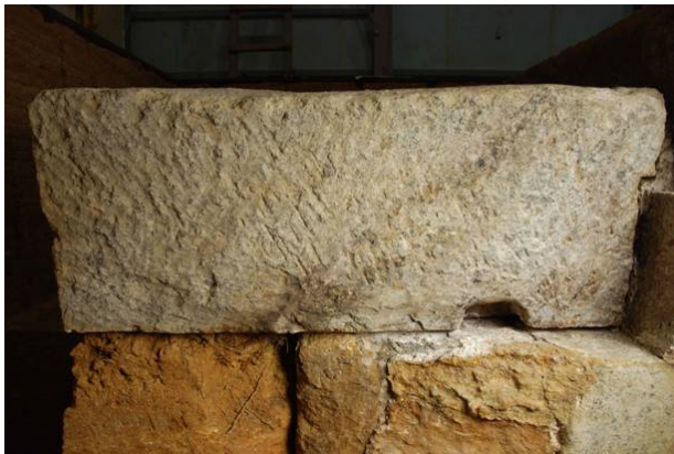
29：石材加工痕跡の調査