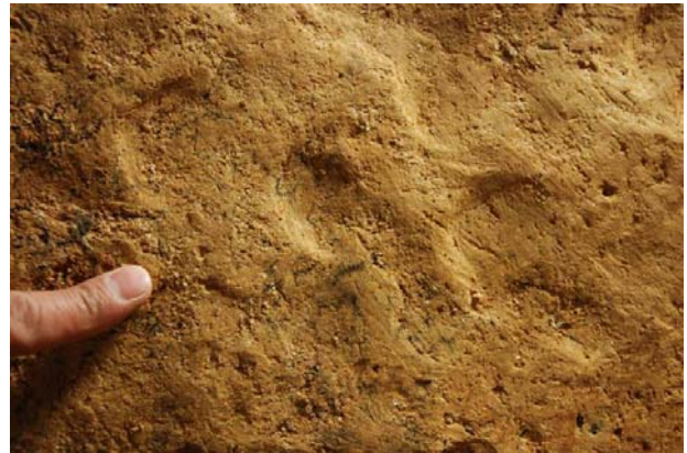
4 : 白色版築層の搗棒痕跡