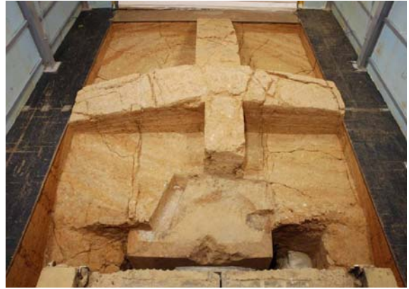
12 : 天井石直上の地震痕跡