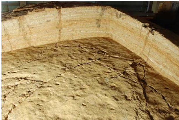
3 : 白色版築層の搗棒痕跡検出状況