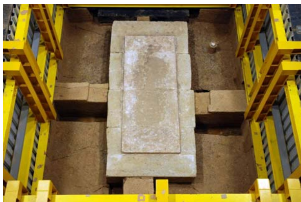
68 : 床第 15 作業面の検出