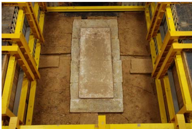
65 : ガラス面の検出