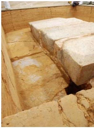
17：天井石架構時の作業面