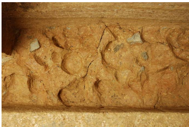
81：床石下版築層の搗棒痕跡