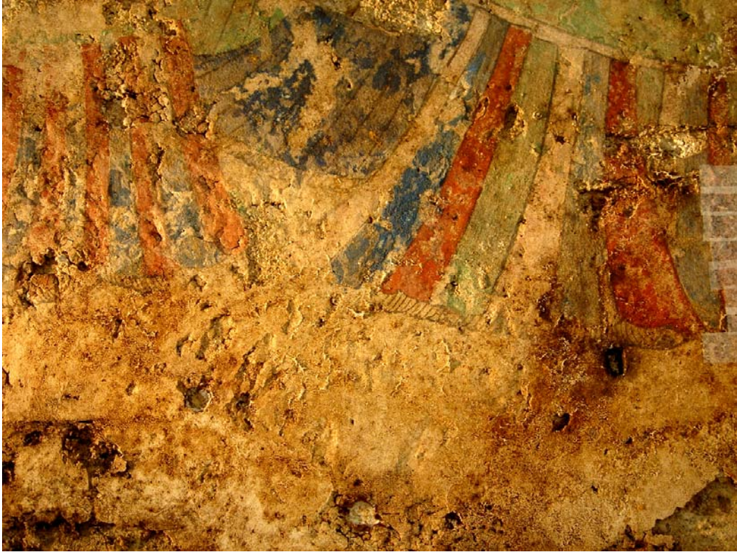
東女子：ゲルの乾燥による表層の剥離