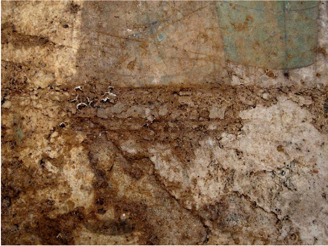
西男子：ゲルの乾燥による剥離