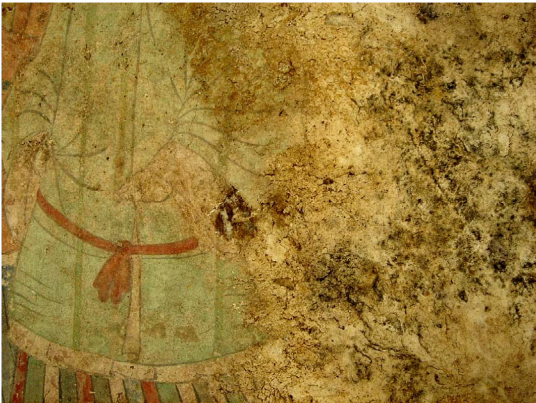
西女子：ゲルの乾燥に伴う漆喰の収縮