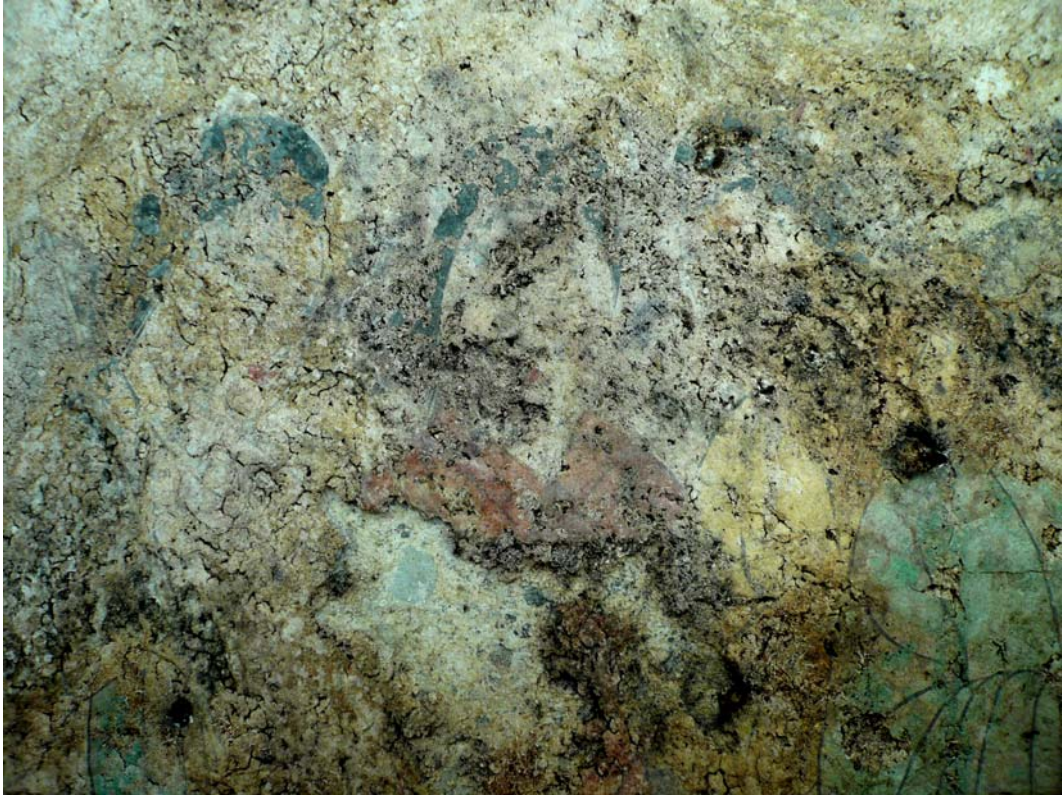
東女子：黒かびとゲルの混在