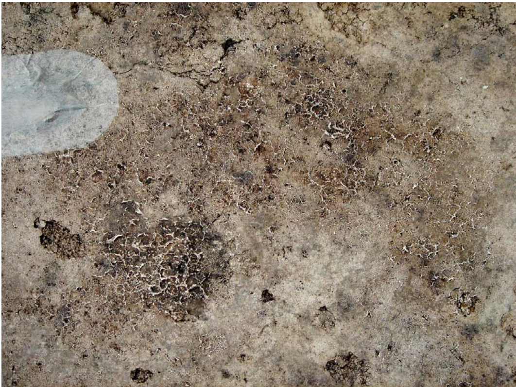
天井：ゲルの乾燥による表層の剥離