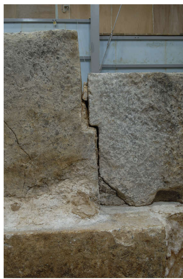
4 同上東側面漆喰除去後の状況