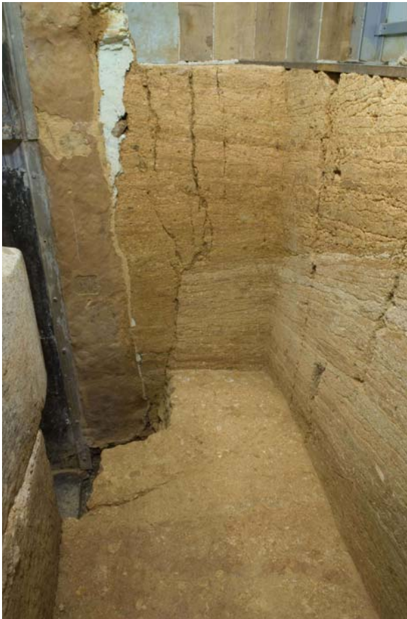
9 取合部西脇版築層の亀裂