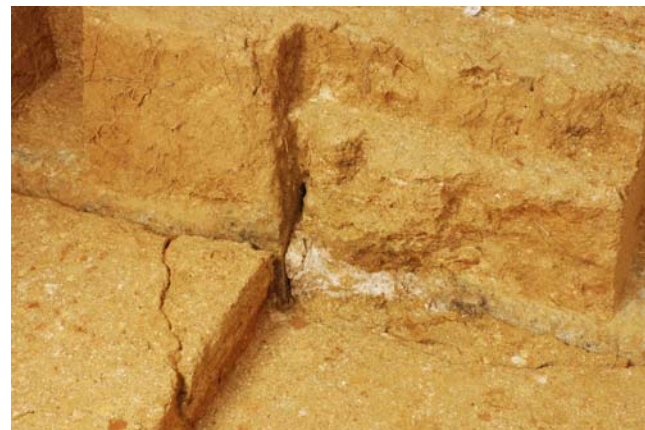
8 天井石に沿う亀裂と根 (天井石3・4)