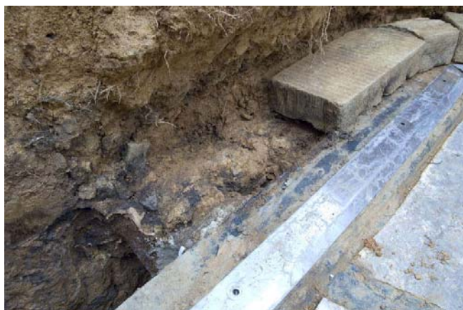
1 PC版周囲をふさぐ凝灰岩設置面の状況