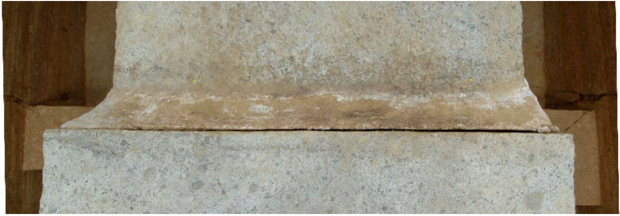
9 天井石3・4間接合部上面に生じた漆喰の隙間