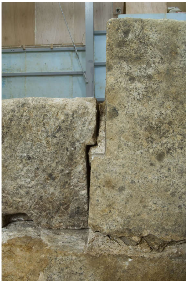
3 同上西側面漆喰除去後の状況