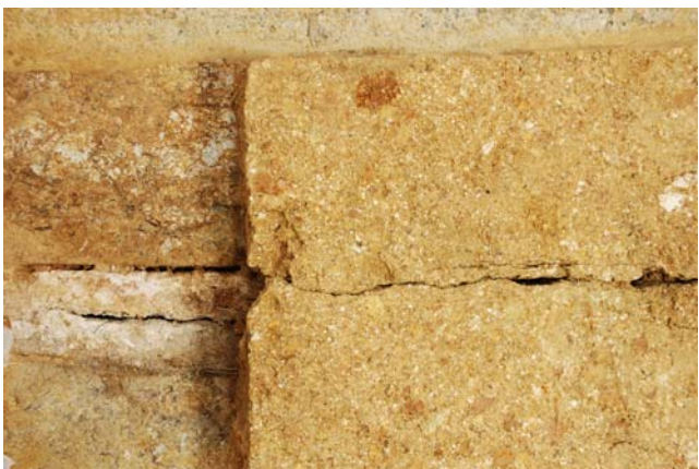
7 天井石2・3接合部からのびる亀裂