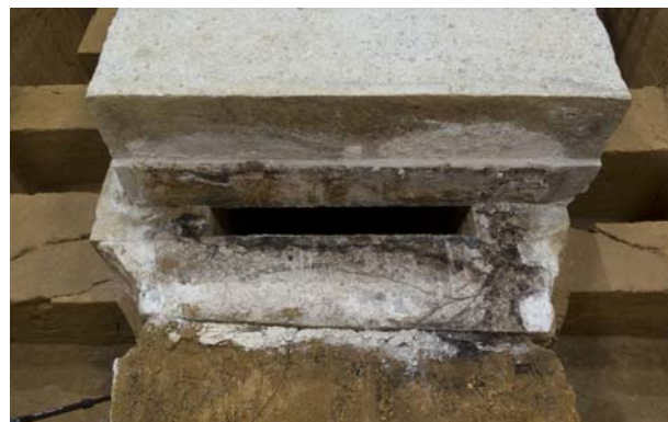
2 北壁石上面のカビ