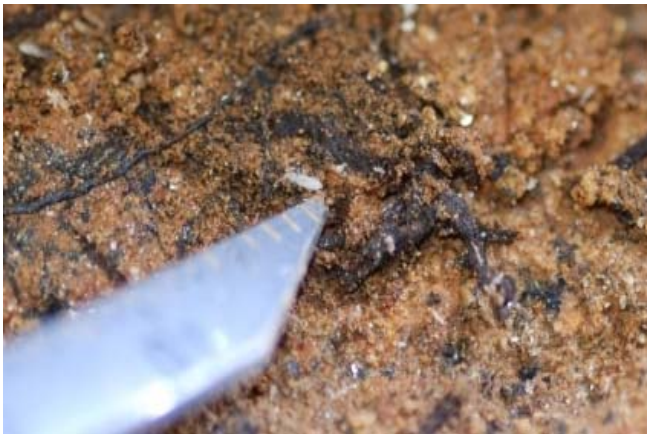
3 北壁石北側面のトビムシ