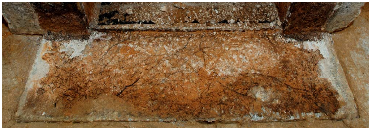
5 床石4上面（北壁石下）のカビと根