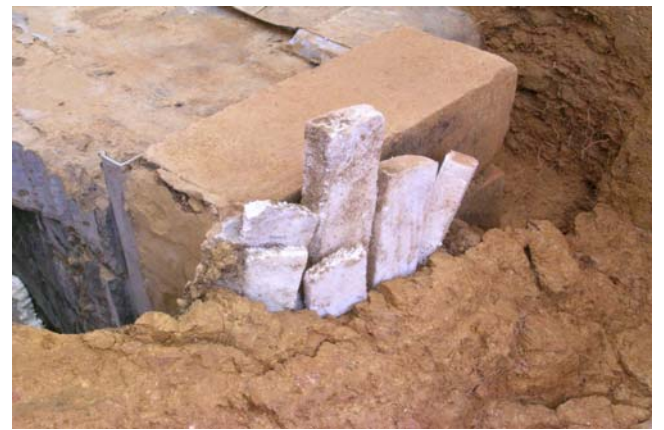
12 保存施設西脇に詰められた発泡スチロール