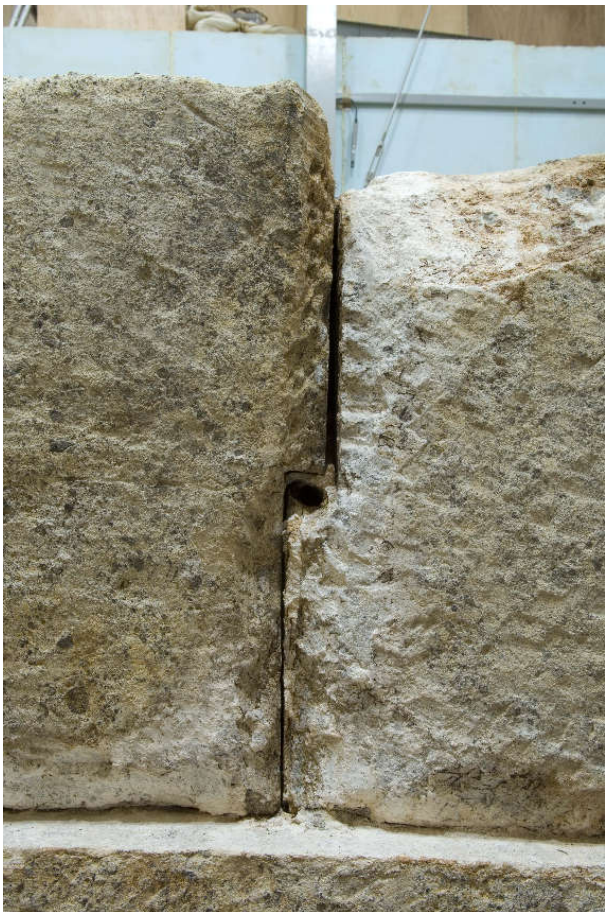
7 同上西側面漆喰除去後の状況