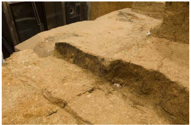
4 亀裂内のカビと根（石室東側縁上部）