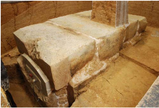
3 石室天井石東側面のカビ (南東より)