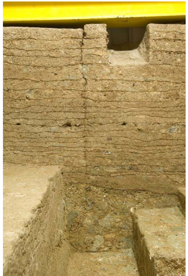
12 地山面に達する亀裂