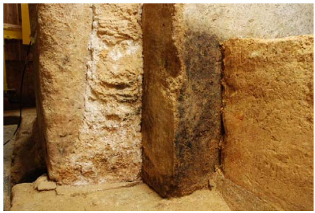
5 東壁石1 南端部のカビ