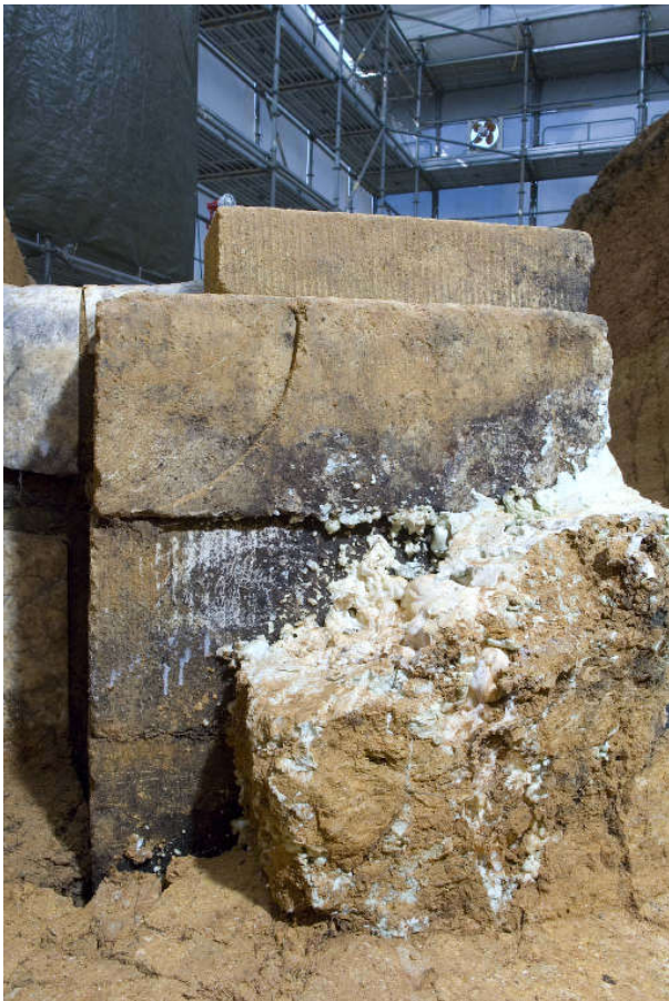
13 保存施設東脇の凝灰岩切石擁壁表面に生えたカビ