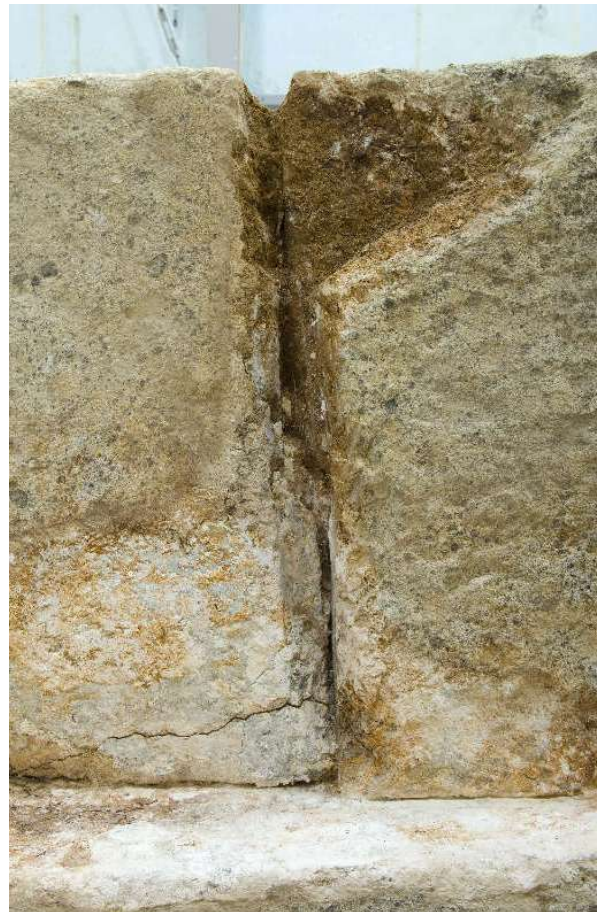
8 同上東側面漆喰除去後の状況