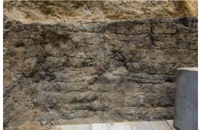
10 旧発掘区北壁のカビ