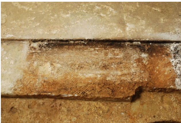
10 床石3上面西（西壁石2下）のカビ