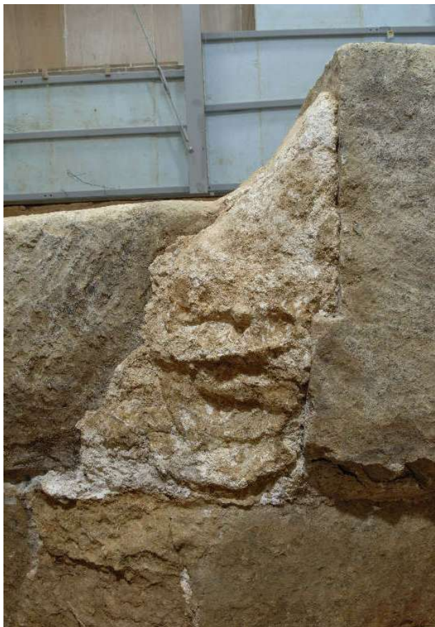
1 天井石3・4接合部西側面の漆喰