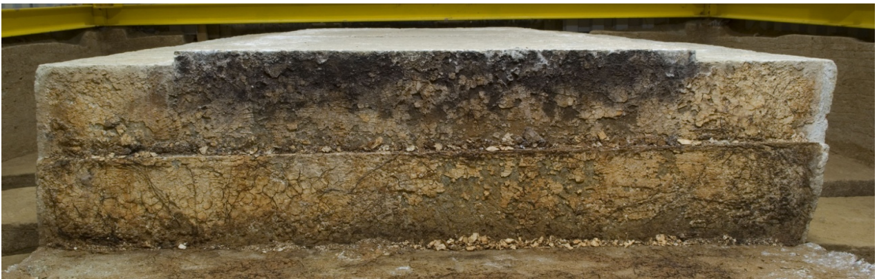
9 床石3北接合面のカビ