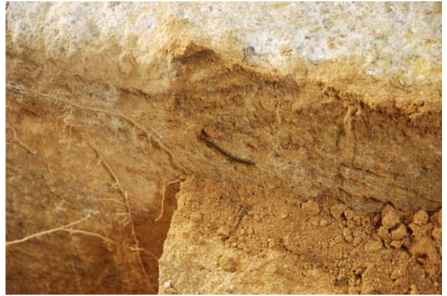
2 天井石3西側面のムカデ