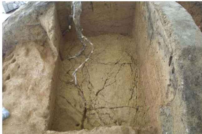
2 亀裂内部に伸張するモチノキの根