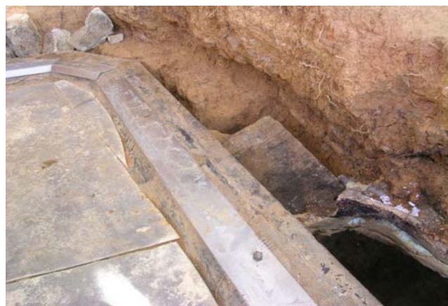
2 陥没したふさぎ用凝灰岩