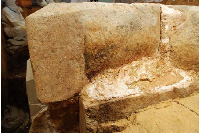
1 天井石1 東側面のカビ