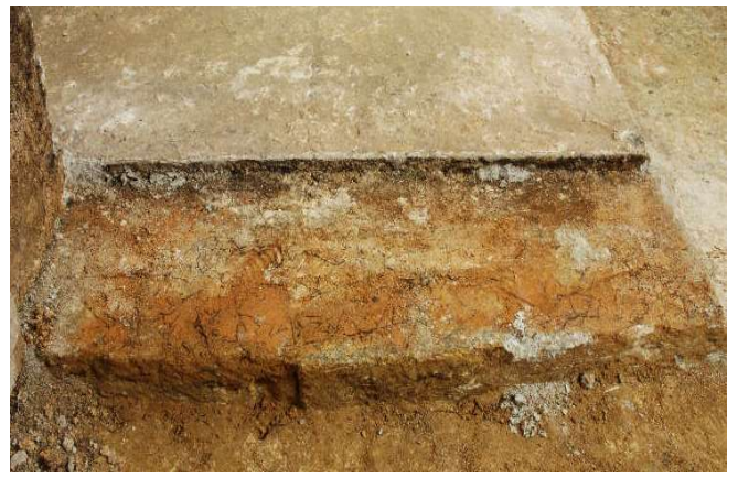
7 床石4上面東側（東壁石3下）のカビ