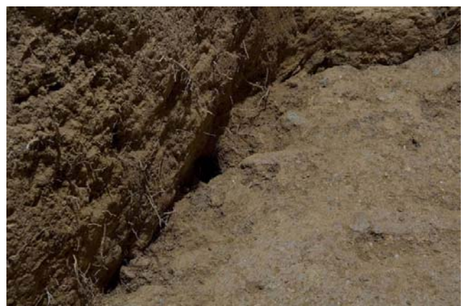
3 旧発掘区の壁面に沿ってのびた根