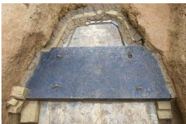
5 ふさぎ用PC版の検出状況