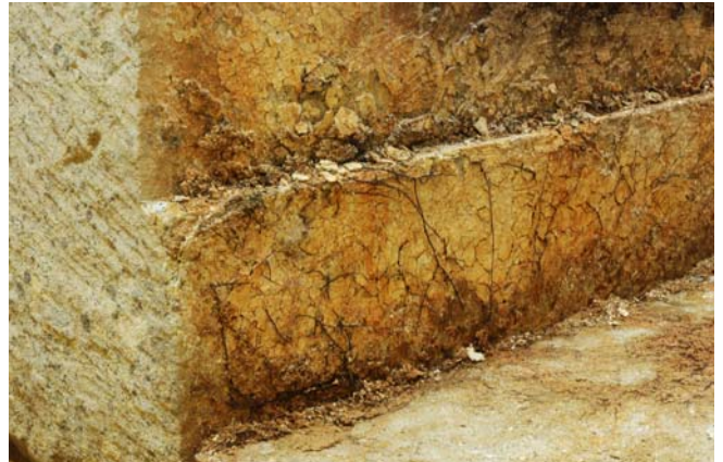
16 床石3・4接合面にのびた根