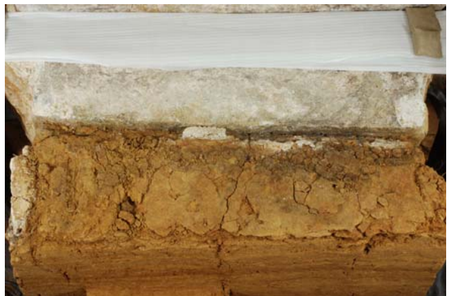
8 天井石4直下の亀裂