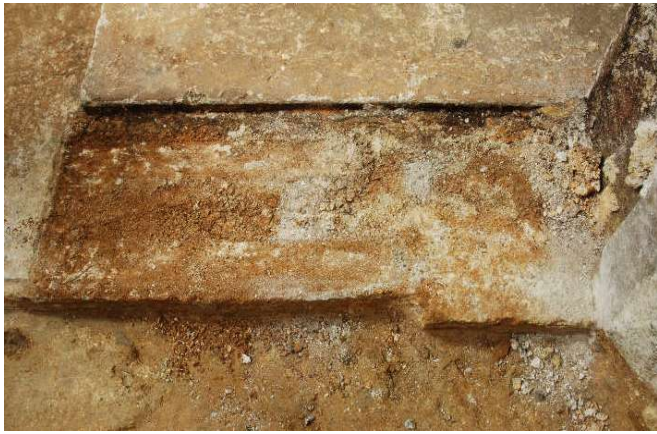
6 床石4上面西（西壁石3下）のカビ