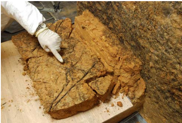
11 北壁石の北側面に沿ってのびた根