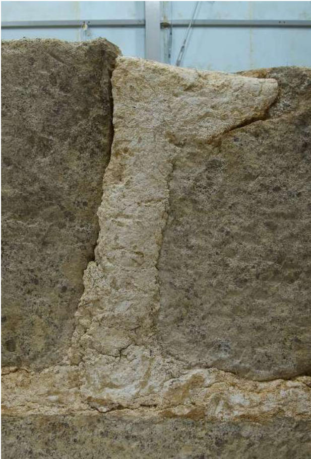
5 天井石1・2接合部西側面の漆喰