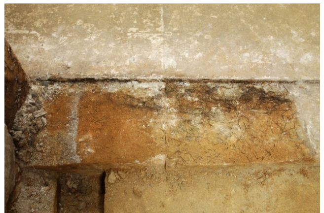
11 床石3上面東（東壁石2下）のカビ