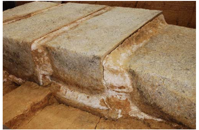
4 同左 (北東より)