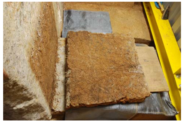
13 西壁石の西側面に沿ってのびた根