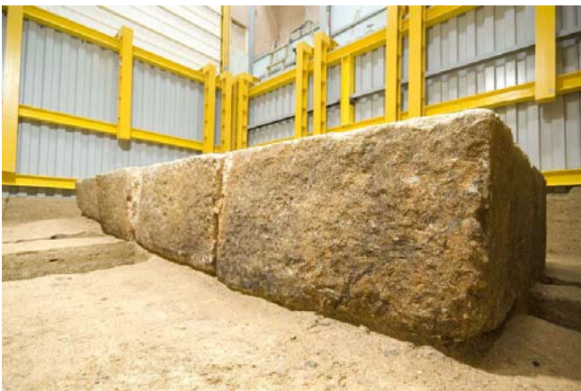
7 床石1～4 西側面のカビ