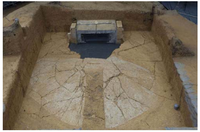
2 白色版築層の亀裂