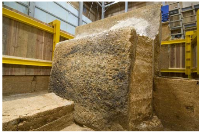
6 北壁石北側面のカビ