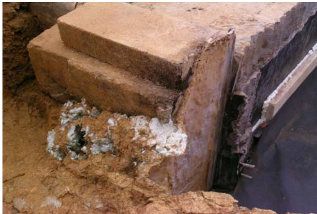
11 保存施設東脇に充填された発泡ウレタン