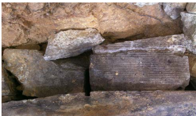
3 下部のふさぎ用凝灰岩