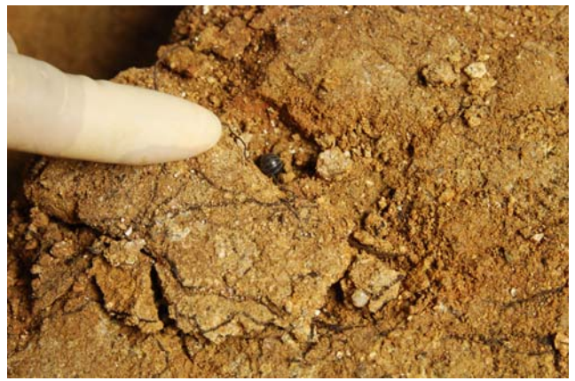
6 床石4下のダンゴムシ