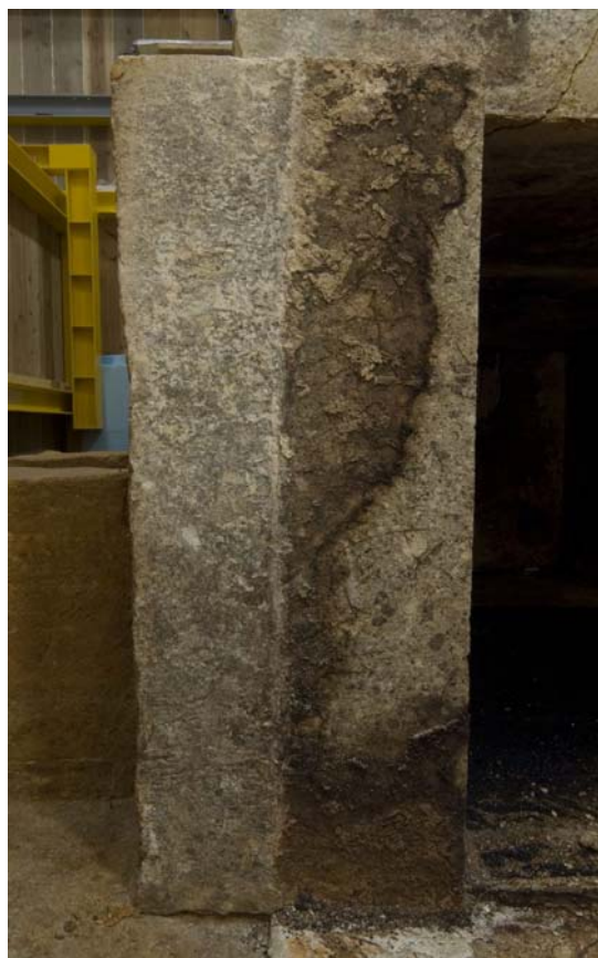
3 東壁石3北小口のカビ