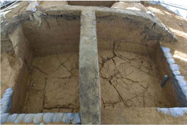
1 下部版築層の亀裂