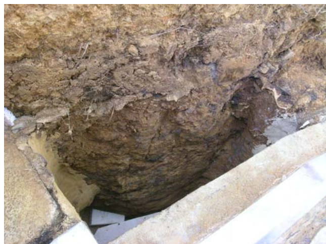
7 取合部西側の天井部分