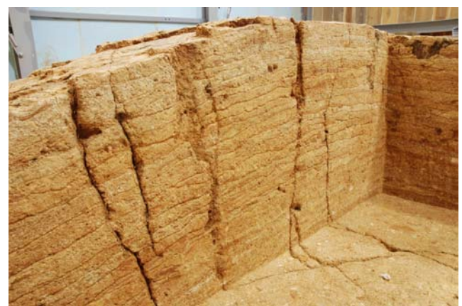
5 亀裂内にのびる根 (北畔東面)