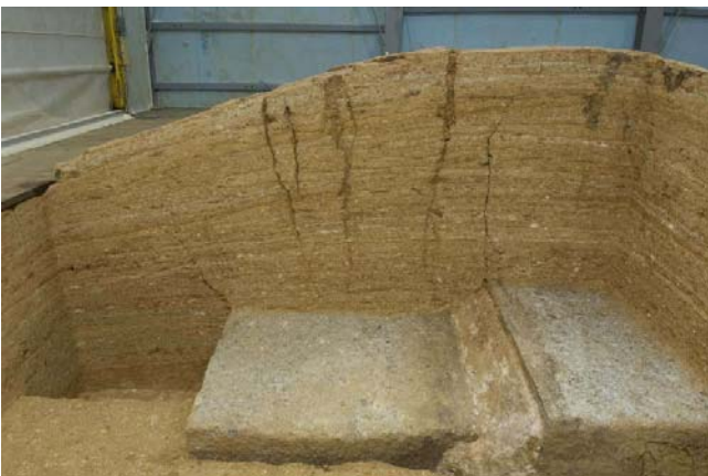
5 白色版築層南北断面の亀裂（天井石3・4）