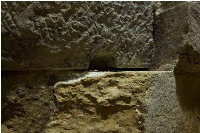
12 石室内部から漏れる灯り（天井石4西面下端）