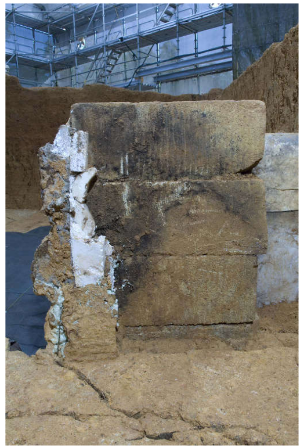
14 保存施設西脇の凝灰岩切石擁壁表面に生えたカビ