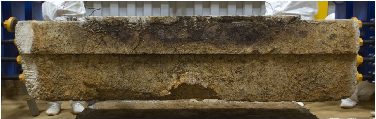
8 床石4南接合面のカビ