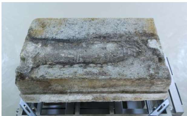
1 取り上げた天井石4下面のカビ