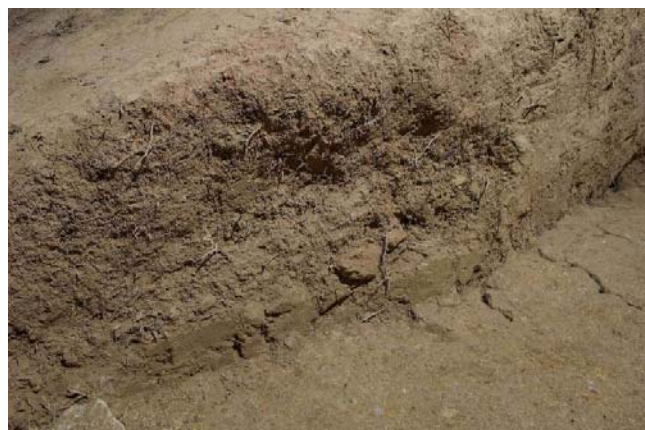
4 旧発掘区西壁に沿ってのびた根