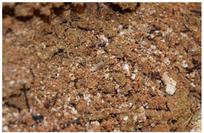
4 床石3北接合部のワラジム