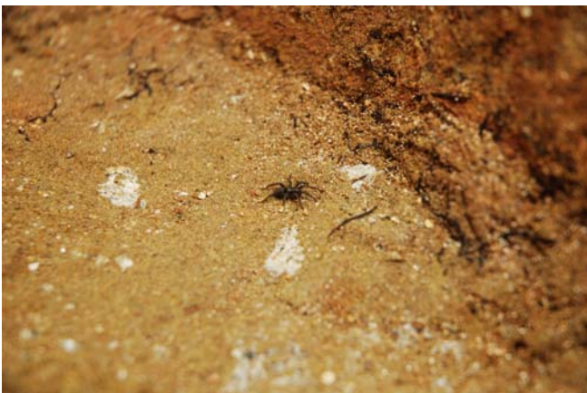
7 床石2南接合面のクモ