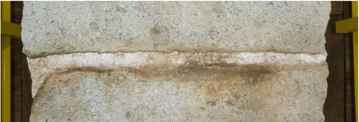
11 天井石1・2間接合部上面に生じた隙間とカビ・根