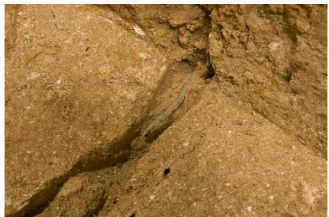
7 亀裂内に伸びる太い根 (南西区西畦際)