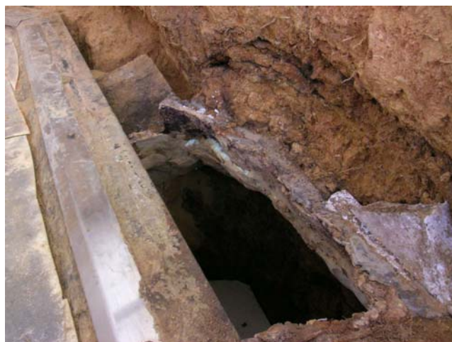
8 取合部東側の天井部分