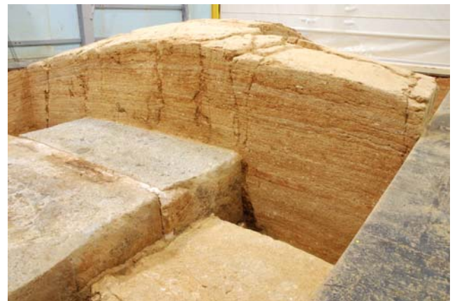
6 白色版築層東西断面の亀裂（天井石2上部）