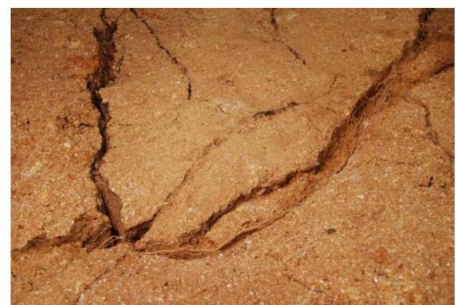
6 亀裂内の根 (北東区)