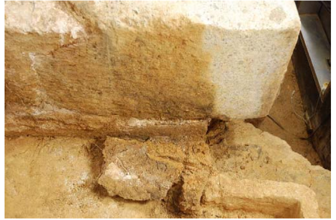
2 天井石1 西側面のカビ