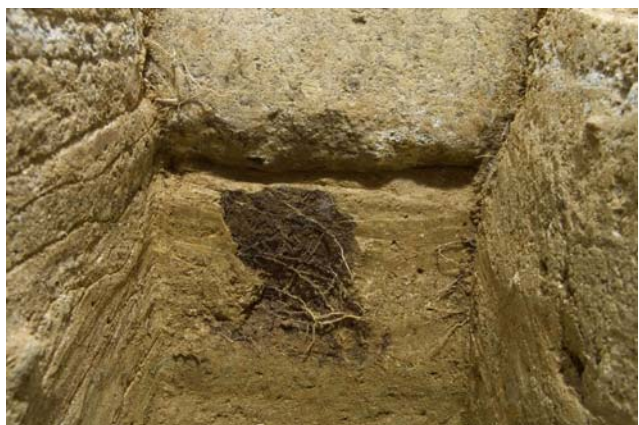
15 床石4設置面の下方にのびた根（北より）