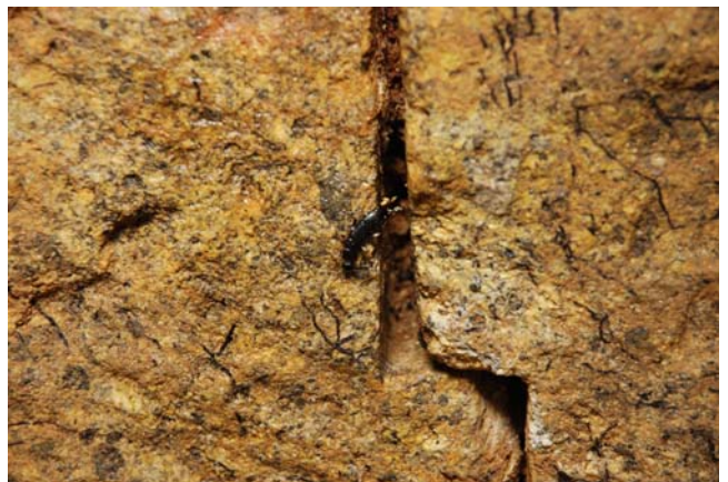
床石3・4東合欠内のハサミムシ