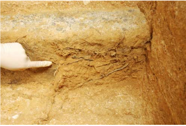
9 天井石3西側面にのびた根