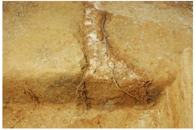
10 天井石1・2接合部にのびた根（西より）