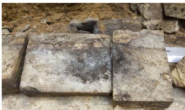
4 ふさぎ用凝灰岩の裏面の状況