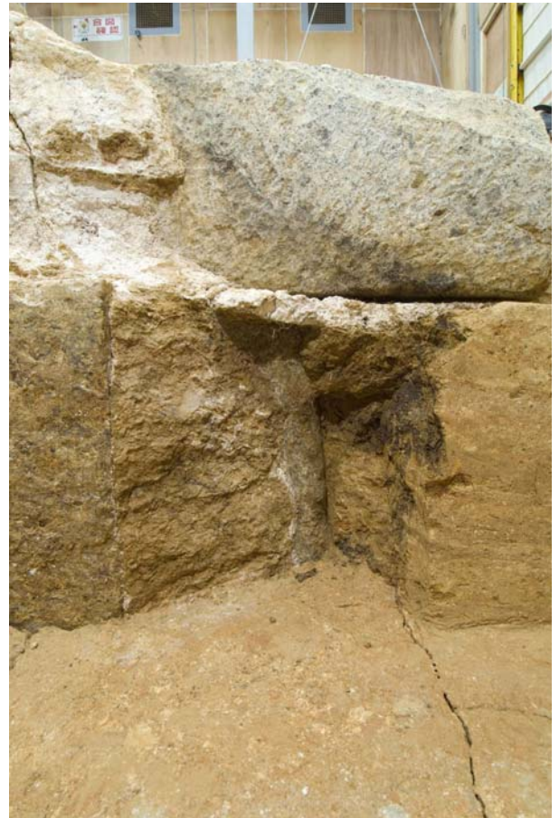
10 石室北東隅から外方へのびる亀裂