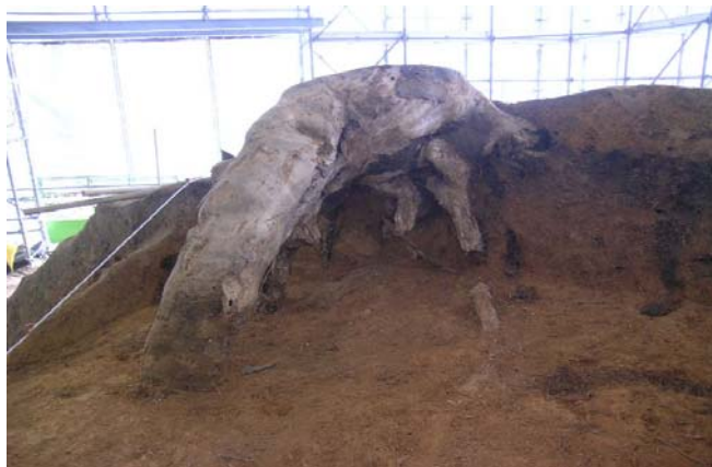
1 墳丘北東部のモチノキの切り株