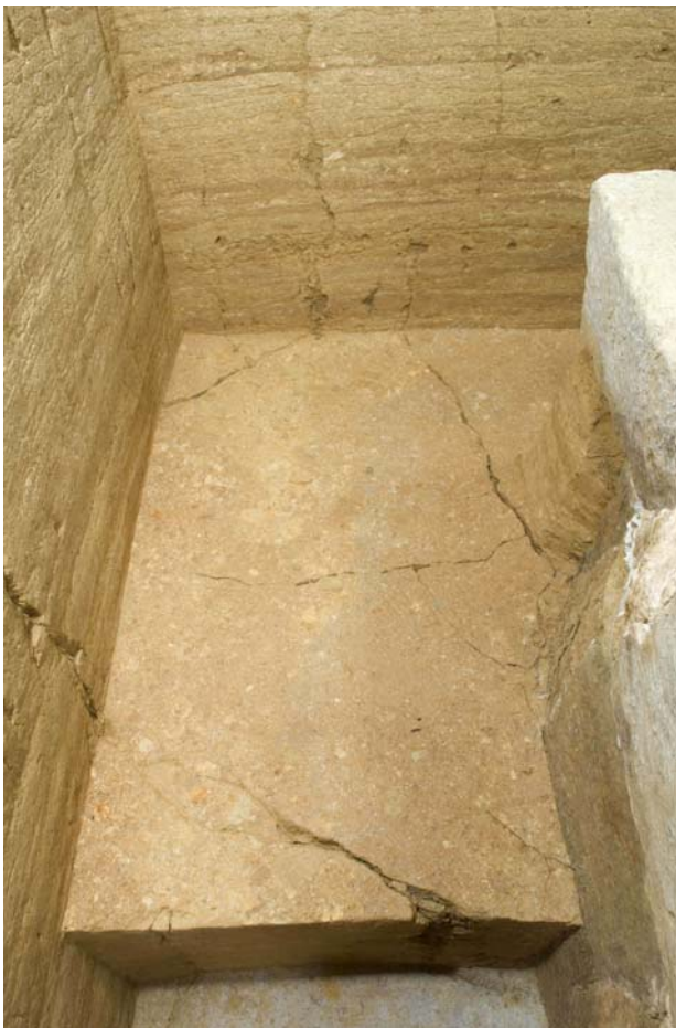
11 石室北西隅付近の亀裂