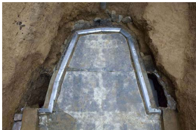
6 ふさぎ用PC版除去後の状況