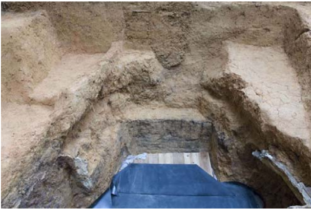
9 PC版、ふさぎ用凝灰岩除去後の状況