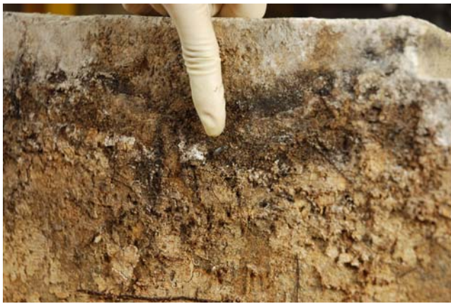
5 床石2南接合面のゴミムシ