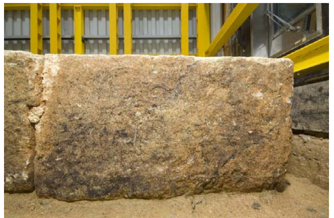
8 床石1 西側面のカビ