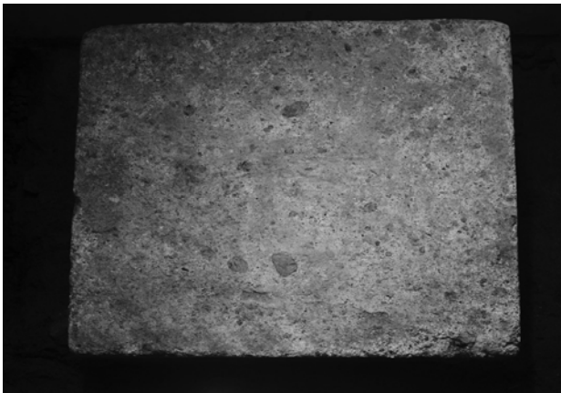
13 上面の赤外線写真