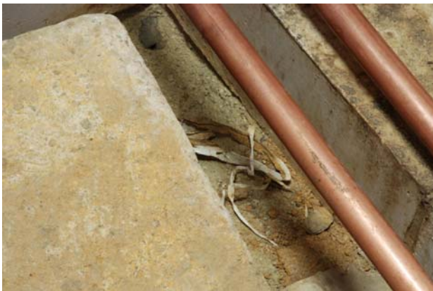
7 山砂上面で検出した紐（北東隅）