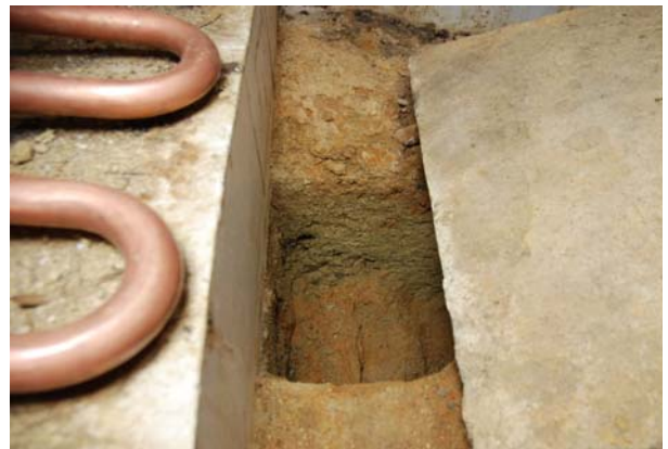
8 南側の埋め戻し状況（東から）