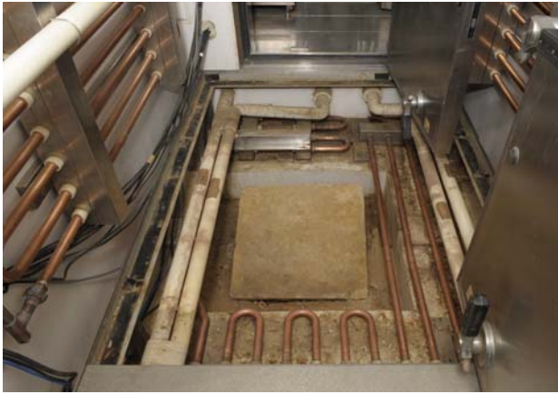
1 保存施設と切石（南から）