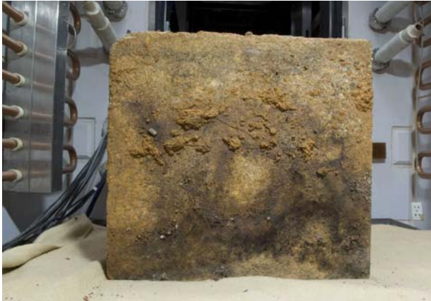
11 取り上げ直後の底面（天が南辺）