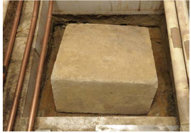
10 旧発掘面検出状況（北から）