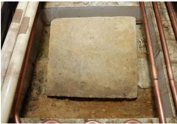
5 褐色擬土検出状況（南から）