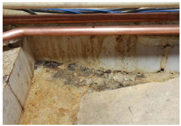
6 褐色擬土上面の黒色カビ（南西隅）