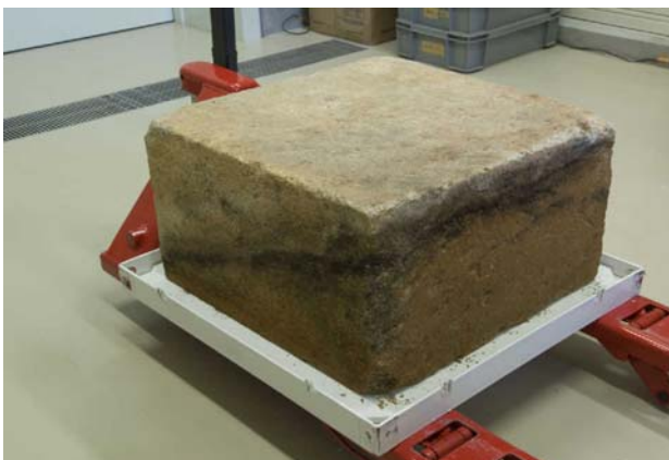
15 切石側面の黒色カビ（東・南側面）