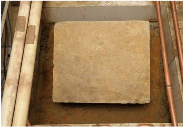
9 旧発掘面検出状況（南から）