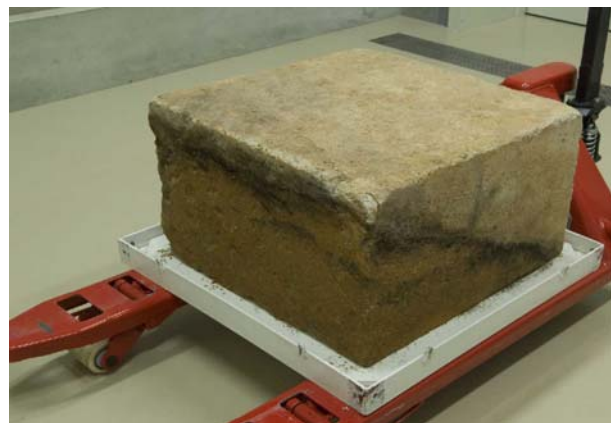
16 切石側面の黒色カビ（西・南側面）