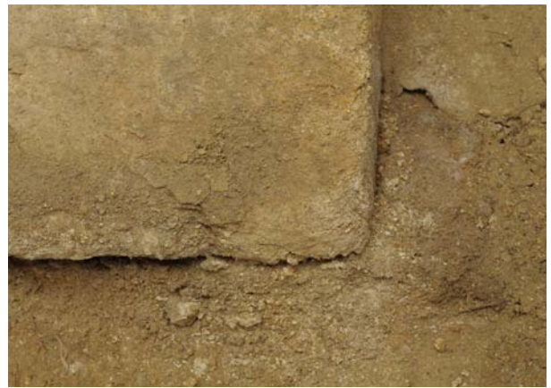
4 南東隅の劣化状況