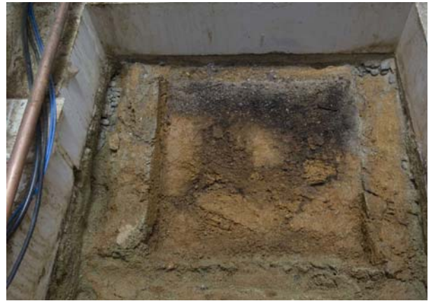
12 切石設置面の状況（南から）