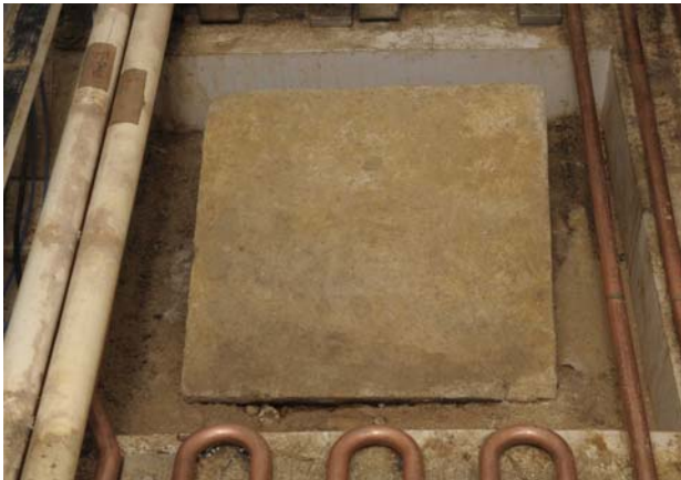
3 切石の現況（南から）