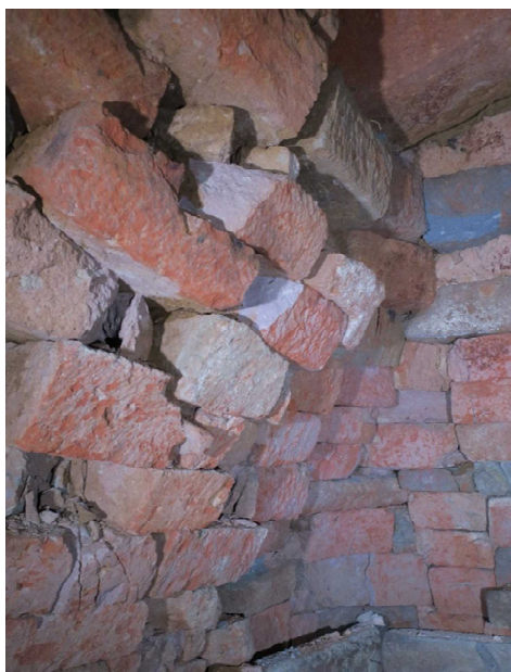
玄室側壁（北壁）状況