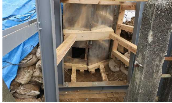
扉部支保工設置状況