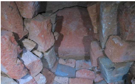
玄室奥壁～天井部状況