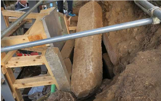
前庭部天井石崩落状況