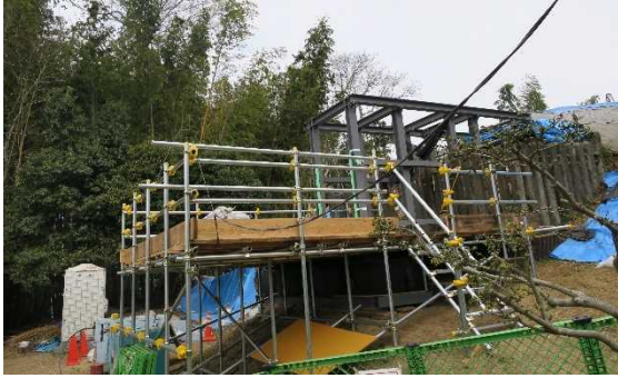
覆屋枠組・足場設置状況