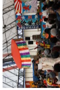
上：釜石虎舞 下：市長の奏上