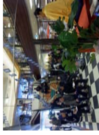
小名浜観光施設での実演