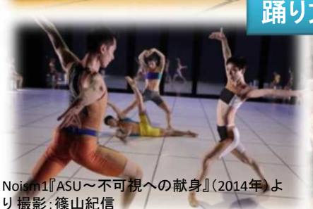
Noism1『ASU～不可視への献身』(2014年)より

広域合併・多様な文化の共存 2005 平成の大合併(15市町村)・2007 政令市移行