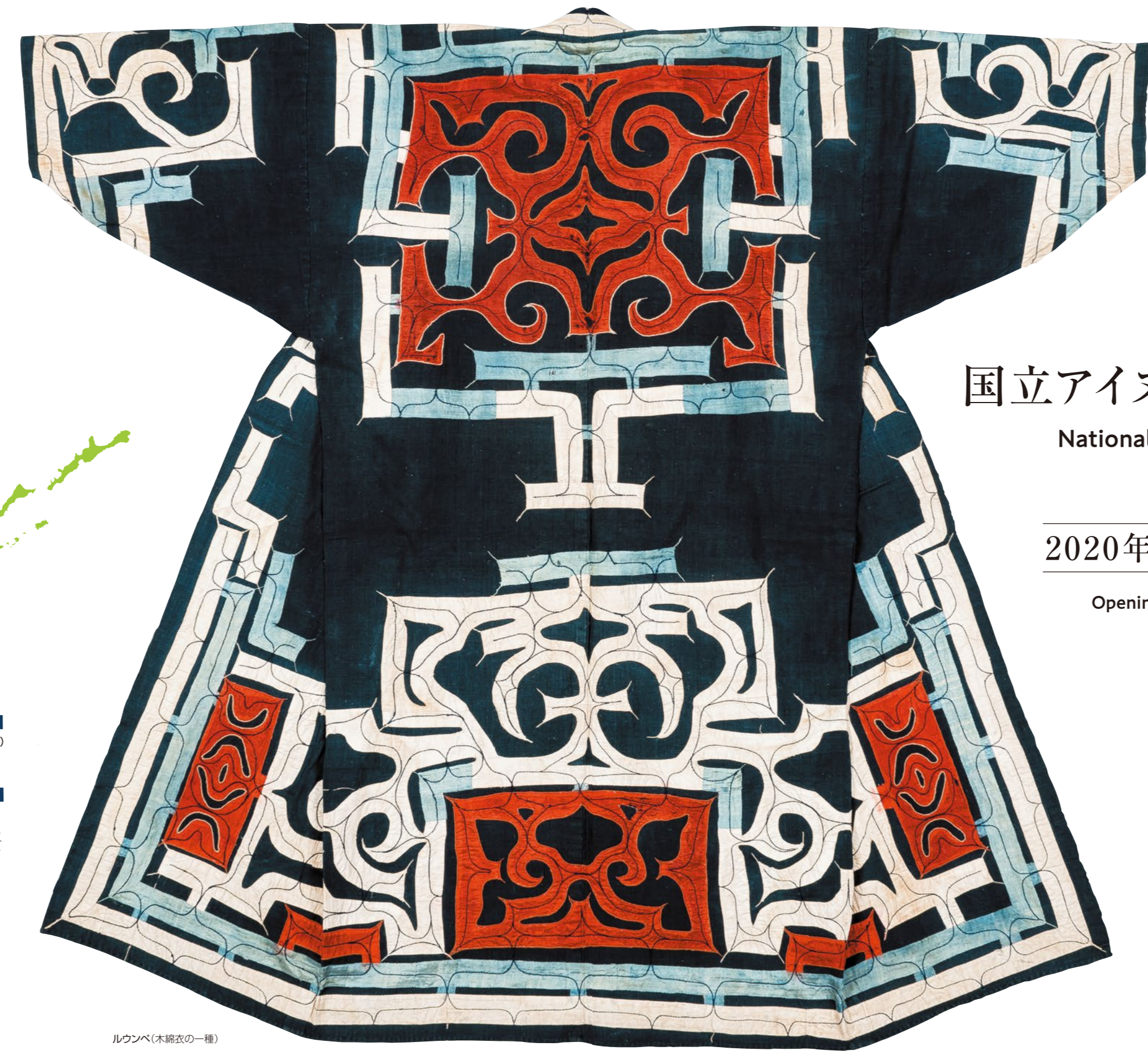
ルウンペ(木綿衣の一種)

※国立アイヌ民族博物館は2020年4月に開館します。 ※本イメージ図は、設計段階における案であり、変更の可能性がります。