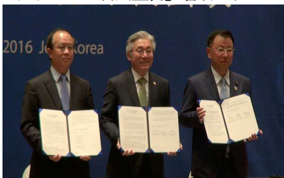
<三大臣による署名文書披露>