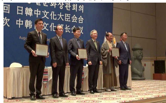
<三大臣と選定牌を授与された三市長>