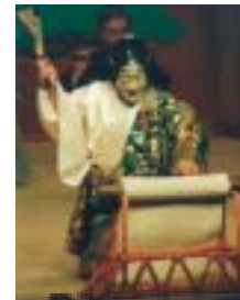
重要無形文化財「能楽」