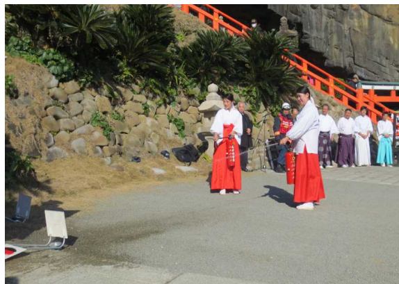
消火器を使用した消火訓練