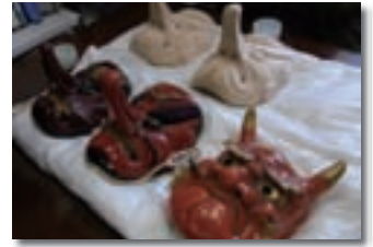
上神谷のこおどり 面の復元製作

は、船待神社の祭神である菅原道真公を偲んで、毎年9月の例大祭に奉納されている、女兒の獅子踊りと男子の傘踊りからなる伝統芸能です。