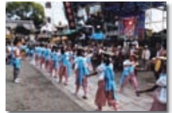
船待神社子供獅子踊り

本事業では、神楽子供獅子踊りの伝承と地域の活性化を目的にして、近年復活したお囃子の生演奏の講習及び、演奏者、踊り手の衣装などの整備を行いました。