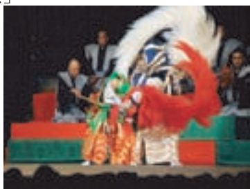
金峯山寺特設舞台上で「連獅子」を舞う、片岡仁左衛門と孫・片岡千之助