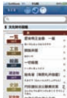
スマートフォン、文化財図鑑

スマートフォン向けアプリでは、多言語（日・英・中・韓）アプリケーションによって、①利用者の位置情報に応じて文化遺産について、テーマ、所要時間、エリアなどを考慮したコースを策定して、ナビゲーションを行う、ガイドシステム、②歴史や対象物を分野別に解説し、非公開場所、四季、行事など、訪問時にはない情報を出すことで、新たに「学ぶ」ことができるようにする辞典システムを、構築しました。