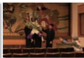
【阿万風流大踊小踊】小踊・第1番「神楽踊」 淡路人形協会（男人形振付指導）

伝統文化子ども教室では、百人一首、柔道、華道教室などのほか、地域に伝わる郷土芸能を継承するための教室も開催し、日本の文化に対する関心や理解を深めました。