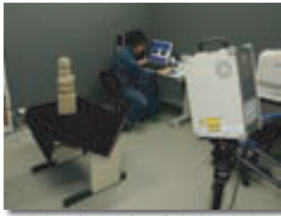
和歌山県立和歌山工業高校の生徒による3D立体コピーによるレプリカ制作風景