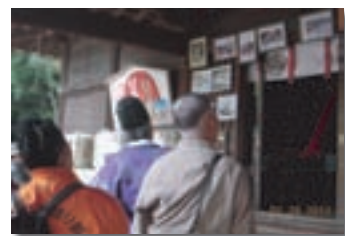
モニターツアー（東照宮）