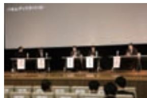
シンポジウム（於京都工芸繊維大学）