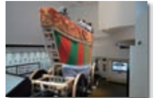
祇園祭大船鉾の復原展示