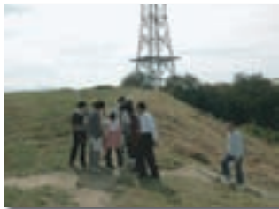
大日山35墳におけるボランティアのガイド風景

加えて、ボランティアの研修として奈良文化財研究所が主催している平城ボランティアの視察を行いました。