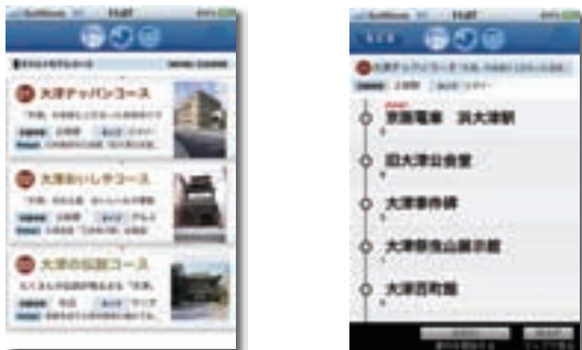
スマートフォン、モデルコース スマートフォン、モデルコース案内

「①浜大津地域の文化遺産情報発信事業」では、「おおつプラスアイ」と名付けたポータルサイトによる情報の発信を行いました。この試みは、地元新聞に掲載された以外は、ポスター、告知カードと限られた媒体の告知活動でした。しかしながら、実施エリア内の私鉄各駅、大津港、大津市関連施設、一般店舗、観光施設などで掲示の無償協力を得られたこと、利用者間の口伝えもあって、平成23年11月1日の運用開始から平成24年3月31日までの5カ月間で、延22,904人、一日平均約150人程の方に閲覧していただき、閲覧者は日ごとに増加傾向にあります。