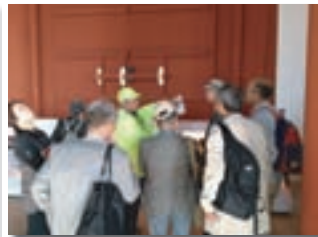
奈良県平城ボランティア視察の様子