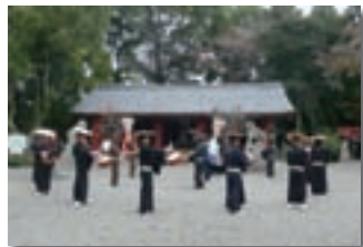
上神谷のこおどり

市内で最も古い民俗芸能として、国選択、大阪府指定無形民俗文化財に指定されている「上神谷のこおどり」は、「堺こおどり保存会」と、踊り手の団体である「鉢栄会」が後継者育成と芸能の伝承を目的に、事業を進めています。具体的には、地元の小学校4年生から高校生までの男子を対象に夏休みに2週間以上、秋祭りの奉納前に10日以上練習を行い、10月の第一日曜日の秋祭りに奉納を行っています。