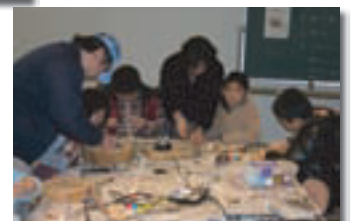
工作教室「龍」置物づくり