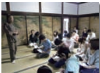
ボランティアガイド研修

拝観者へのアンケートでは、「丁寧・親切・感じが良い」と、高い評価をいただきました。ボランティアガイドへのアンケートでも、「人に教えることで、自分の知識として身につけてくるよう