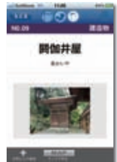
スマートフォン、文化財紹介app04

「② 浜大津地域の文化遺産普及啓発事業」では、大津城に関する普及活動と、琵琶湖疏水流域に関する普及活動を実施しました。浜大津地区には、大津城、琵琶湖疏水、三井寺をはじめとする多くの史跡が所在しています。