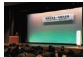
百舌鳥古墳群講演会

百舌鳥古墳群講演会では470人、史跡土塔講演会では、同時に行った土塔の現地公開と合わせて450人の参加がありました。アンケートからは、堺市内のみならず多くの方々に関心を持って頂いている事や、堺市の文化財についての意義や価値について理解する良い機会であったとのご意見を頂くことができました。