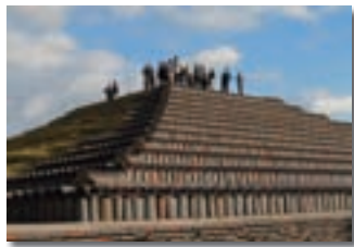
史跡土塔講演会同時開催現地公開

堺市内に所在する百舌鳥古墳群や史跡土塔の価値と意義を広く発信するために、堺市の専門職員に加えて、各分野に精通した学術経験者を招いた講演会・シンポジウムを実施することにより、文化財への理解を深める共に市民の誇りと郷土愛の醸成を目的としています。