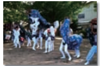
月洲神社神楽獅子舞

神楽獅子舞は、月洲神社の夏祭りの際に、子どもたちを中心とした踊り手によって奉納され、一頭の子獅子に前足後足と二人入って舞う「二人立ち」という形態をとるなどダイナミックな獅子舞として知られています。本事業は、神楽獅子舞の伝承と地域活性化を目的に、衣装の補充等を中心とした道具の整備を行いました。