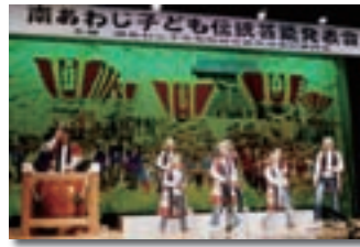
子ども伝統芸能発表会（福童）

子ども伝統芸能発表会では、郷土芸能を継承する子ども達による発表会を開催しました。合わせて、発表会出演にあたり、保存会の方々から指導を受ける中で世代間の交流も図りました。