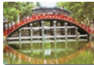
住吉大社 太鼓橋を渡る鯨祭りの行列

普及事業として実施した「鯨祭りをはじめとする湊・出島観光地域活性化事業」では、57年ぶりに堺市出島地区の伝統行事「鯨祭り」を復活させ、新聞、テレビなどにも数多く取り上げられるなど、忘れ去られていた地域の伝統行事を、市民に再認識してもらうきっかけになりました。大鯨の製作は、人通りの多い駅前で行い、地域の多くの人々が色々な形で参加したので、伝統行事に対する地元意識も高まりました。