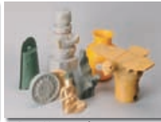
作成した触れるレプリカ

くにの祈りーさわって学ぶ祈りのかたちー』を作製しました。図録の作製にあたっては、和歌山盲学校の教員から多くの助言を得ました。