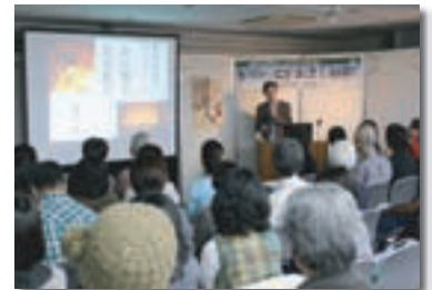
(東京セミナー ～冬の奈良へ行こう)

さらに、無償入館となる「関西文化の日」は、例年多くの入館者が来られることから、3館でリレーコンサートを実施し、新たな文化発信施設としてアピールしていきたいと考えています。