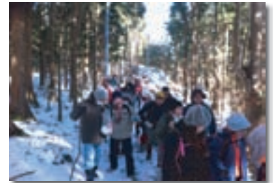
冬の熊野古道「小辺路」モニターツアー実施の様子

また地域の文化遺産の魅力を発掘するために実施するモニターツアーについては各年齢層ごとなど、ターゲットを絞った形で実施し、旅行商品開発につなげていく予定です。