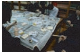
移動博物館(奈良県立十津川高校)

今後、県内の子どもたちに対して、考古学や文化財に興味を持ってもらえるような魅力的な体験学習の実施を図っていきます。