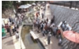
古代の祭祀体験（条辰橋周辺）