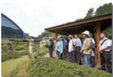
IPM支援者研修会（基礎編）

併せて、IPM支援者が担う新たな博物館業務開拓・雇用創出等による地域活性化への貢献も目指しています。