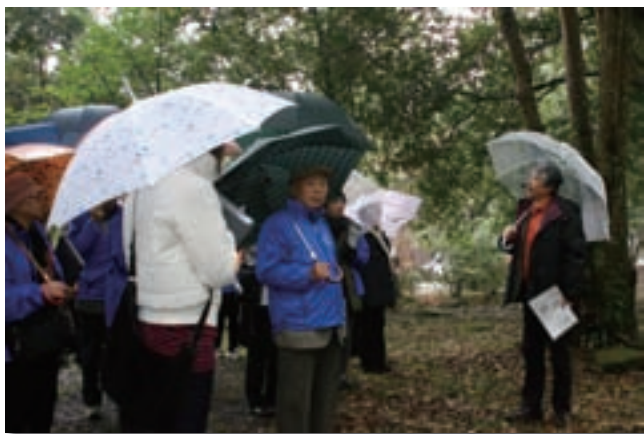
れきはくUSAふるさとガイド： USAふるさとガイド養成事業での実地研修

学校との連携事業は、小学生が実際に地域に出かけて文化財や歴史を学ぶ機会を提供することを目的として、宇佐市内の小学校5校（8クラス138名）について実施しました。内容は、学校での事前学習及び宇佐神宮修復現場公開と歴史博物館の見学です。講師はUSAふるさとガイドが行い、ガイドは前述の研修成果を発揮することができました。