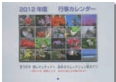
市民に大好評の旧暦表記のカレンダー

○自然と文化（食）を記録・継承し伝える調査事業 現在でも地域住民に用いられている旧暦を基軸として、「季節」（自然の変化）と「食材」、「行事」と「料理」という基本的視点が、事業に取り組むスタッフ・協力者等で確認、共有できた部分は大きな収穫です。この視点から、地元のコミュニティFM放送局でも番組制作がはじまり、地域の「旧暦」と「季節」に基づいた新しい地域の文化情報発信番組が誕生しそうです。毎日10,000人以上のリスナーが聴いている地元FM放送で、こうした情報発信に取り組めるほど理解が向上させられたと思われる。また調査成果を活かして「季節」「食材」「行事」「料理」が一目で解る「旧暦カレンダー」を作成して、市民から大好評をいただいています。