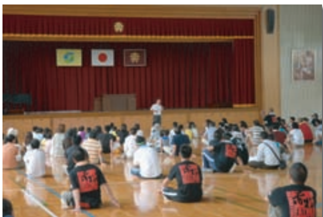
水辺環境講座（赤松小学校） さが城下塾開催事業講座（地域）