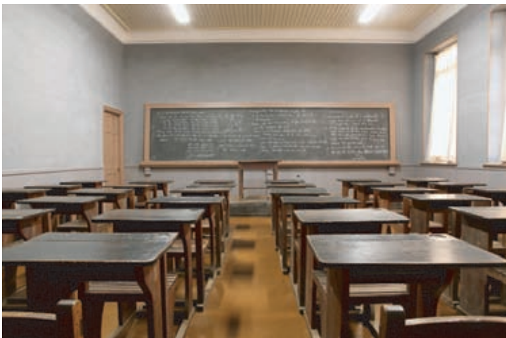
フィルムロケーションデータベースの為にプロのカメラマンに依頼して撮影した写真の 枚 五高記念館内の復原教室

平成24年度は、実際のタッチパネル式モニターを導入し、案内システムの運用試験を行います。また、情報発信システムの構築のためSNSの導入等を検討します。動画についても、引き続き制作を進めます。