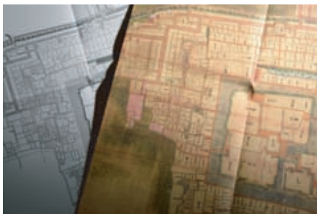
元文佐賀城廻之絵図 御城下絵図活用事業（ミュージアム）