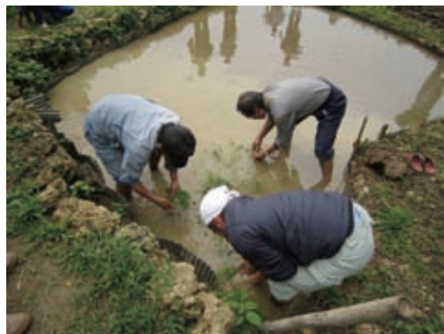
知念区 歴史体験学習の様子（田植え準備）

平成25年度は、伝統芸能関連の古い写真のデジタル化による保存と市民ギャラリーでの展示及び配信、貴重な文化遺産関連刊行物の電子書籍化と公開による学校教育・生涯学習現場での活用のための記録作成事業、情報発信事業を行う予定です。