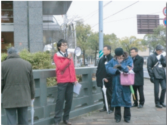
モニタリングツアー（佐賀城周辺散策） 観光可能性調査（地域）

結果から、佐賀城周辺の名所や旧跡のスポットを厳選し、コースに取り組み内容を絞り込む予定であり、その結果をもとに平成24年度に観光ルートを設定し、また運営体制の確立を目指します。