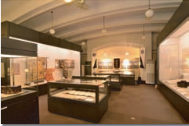
佐賀城築城400年記念「歴代藩主と佐賀城」 展覧会等開催事業（ミュージアム）