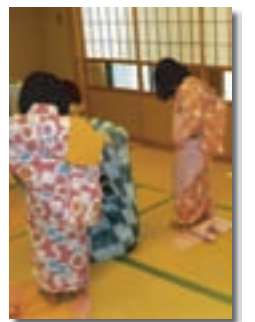
【ゆかたの装着の体験】