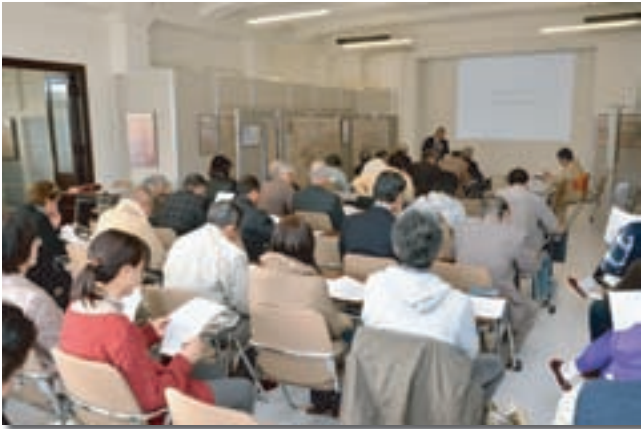
講演会 佐賀城築城400年記念「甦る佐賀城」 展覧会等開催事業（ミュージアム）