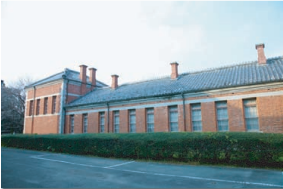
「重要文化財旧第五高等中学校本館等公開活用事業」の対象となった建物の一つ「旧第五高等中学校化学実験場」

平成23年度は、過去の修理・修繕等や調査等の記録を整理し、明らかにした。平成24年度は、保存計画・修理計画・防災計画・活用計画を策定する予定です。