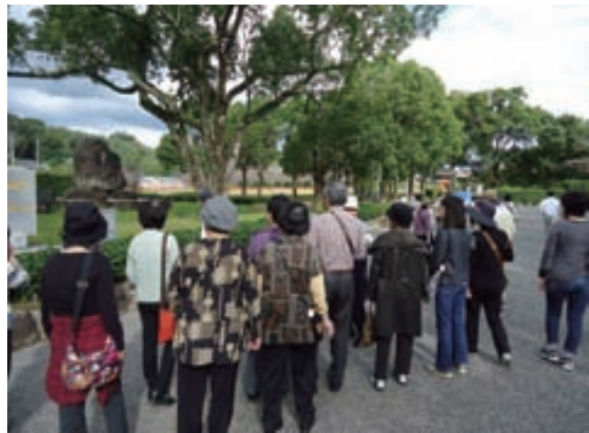
歴史ロマンモニターツアー：宇佐神宮を説明する宇佐市観光協会のガイド

大分県への関東圏・関西圏からの観光客は福岡圏と比較して低調であるため、大分県の文化遺産周知及び誘客