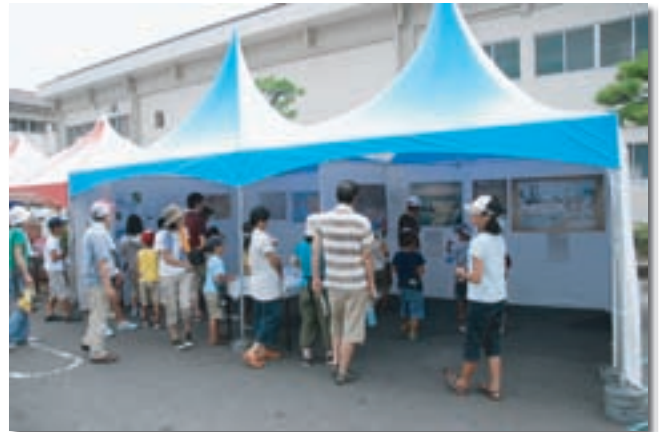
歴史・環境に関するイベント（赤松小学校） さが城下塾開催事業講座（地域）

今後も、佐賀城濠のスケールの大きさを体感し、環境・歴史についての理解が進むよう、さらに啓発事業等を行っていく必要があります。このため、平成23年度は413名であったお濠めぐり舟の乗船者数を、平成24年度には、乗船目標500名を目指し周知を図っていきます。