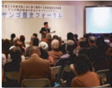
地元飲食店街を取り上げた「ヤンゴ歴史フォーラム」

民にも検索や利用が非常に難しい奄美群島の古文書の利用環境が劇的に改善されはじめています。当該事業に関連して、平成24年1月には、「情報処理学会」の人文科学とコンピュータ研究会の奄美研究会が奄美市立奄美博物館で開催され、全国から20名の専門家が参加、本事業で取り組んでいる奄美群島の古文書情報について、多数の研究機関と共有することができました。また平成24年2月には、鹿児島県下第2位の規模を誇る本市の屋仁川飲食店街について、歴史フォーラムを奄美市立奄美博物館で開催、150人を超える市民の参加者がありました。社交飲食業組合でも、歴史的由緒ある飲食店街という理解が非常に深まり、今後も同様のイベント開催を希望する要望が出るなど、市民の幅広い層に歴史情報が浸透しはじめた成果が感じられます。