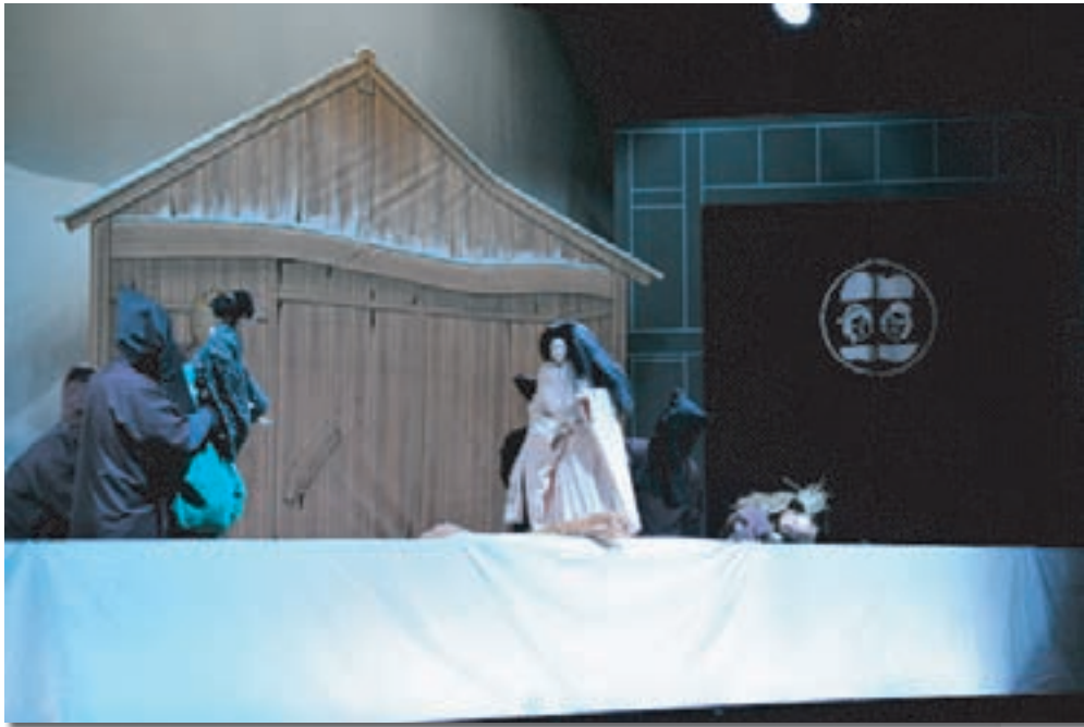
「小泉八雲来熊120年記念事業」における清和文楽人形芝居(熊本県無形文化財)「雪女」公演