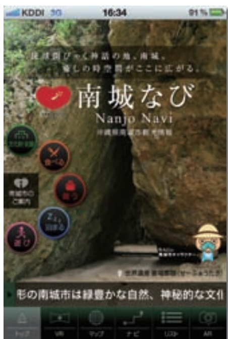
スマートフォン用アプリケーション「南城ナビ」

文化遺産と地域の結びつきの強化及び観光振興へ活用するための付加価値化の検討、シュガーホールを活用した発表の場の創造と持続的な継承を促す為の取り組み、