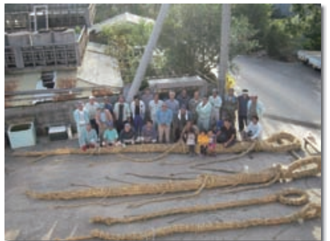
西原区 綱作り完成

延べ80人程の区民が集まり、老若男女それぞれで役割を分担し、コミュニケーションを取りながらの作業を通し