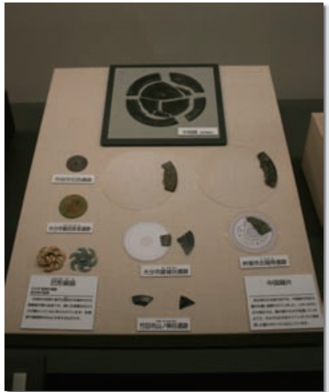
れきはくキャプション： 環境整備事業実施の展示キャプション

れる外国人見学者向けに英語版・韓国語版・中国語版の3ヶ国語で各2,000部を作成しました。トピック展示は、地域の文化財を掘り起こすことを目的として、常設展内のトピックコーナーで地域文化財展「瑠璃の浄土－薬師如来へのいのり－」と題し、これまで大分県内でも取り上げられることの少なかった薬師如来に焦点をあてた展示を行いました。