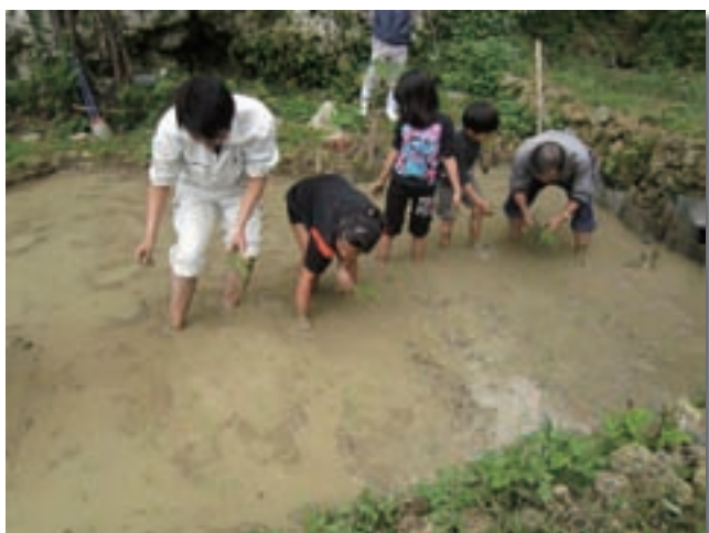
知念区 歴史体験学習の様子（田植え）

市民ギャラリーオープンセレモニーの際にも、大型タッチパネルを利用して多くの人に体験していただき好評を博しました。