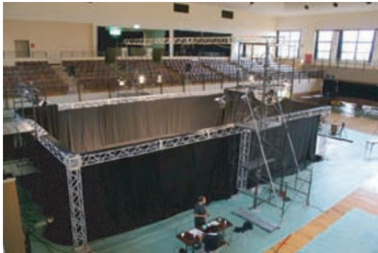
無形民俗文化財多方向撮影特設ステージ