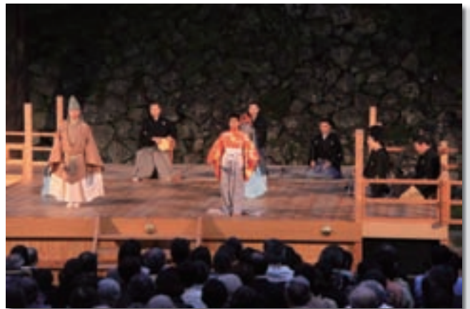
第15回「のべおか天下 薪能」（平成23年10月8日：延岡城址二の丸広場） 貴重な文化遺産「延岡藩主内藤家旧蔵の能面」を活用し、秋の風物詩になっています。 厳しい稽古に耐えて、京都の本物の能楽師にまじって、地元の小学生も晴れ舞台を踏みました。（演目「松山天狗」）