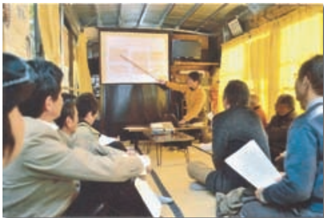
環境講座・歴史講座 さが城下塾開催事業講座（地域）