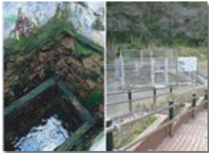
【北溪井坑跡(長崎市指定史跡)】