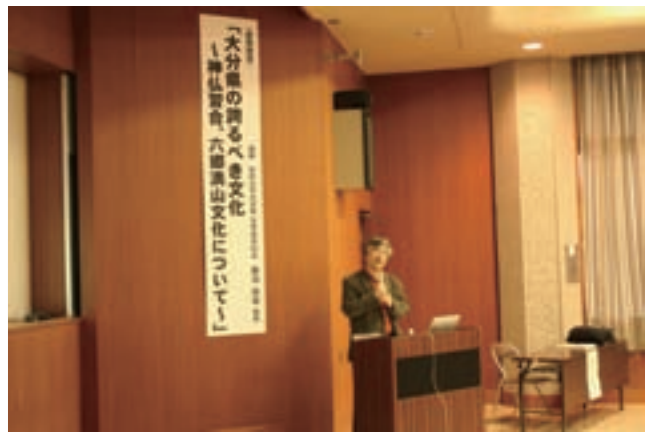
歴史ロマンシンポジウム：大分県歴史シンポジウム

を開催しました。また、市町村の枠を超えたガイド育成に加えて、大分県を訪れる個人観光客は、交通網の関係からタクシーの利用者が多いことから、観光ガイド・観光タクシー養成のために、県北地域の歴史を中心とする観光モデルコースを掲載した大分県北部地域観光ガイドマニュアル「豊の国千年ロマン時空の旅」を2,000部作成し、今後、各種研修等での活用を予定しています。