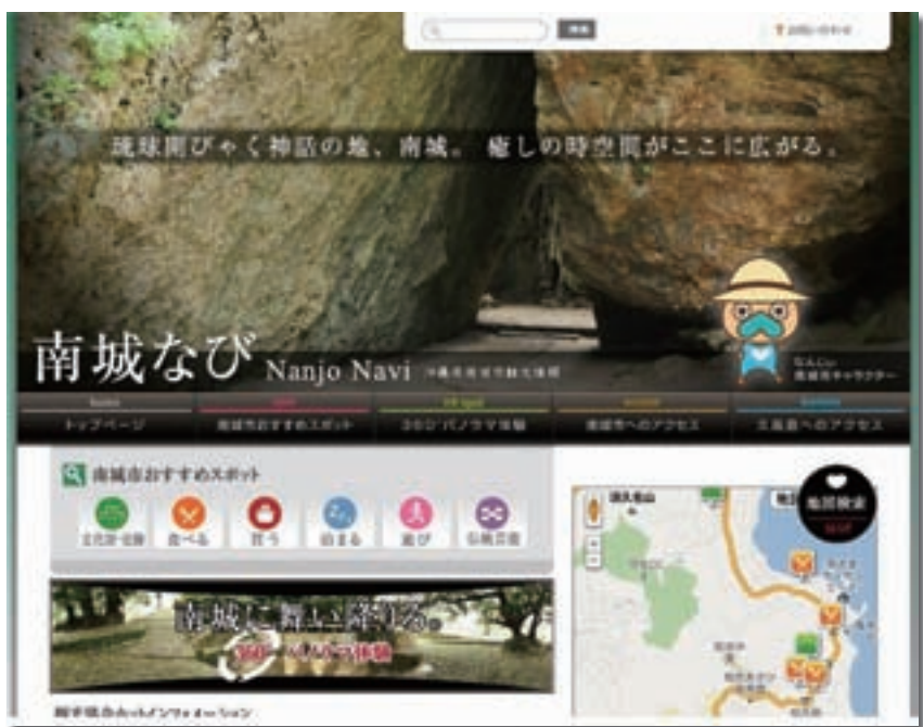
文化遺産ポータルホームページ「南城ナビ」