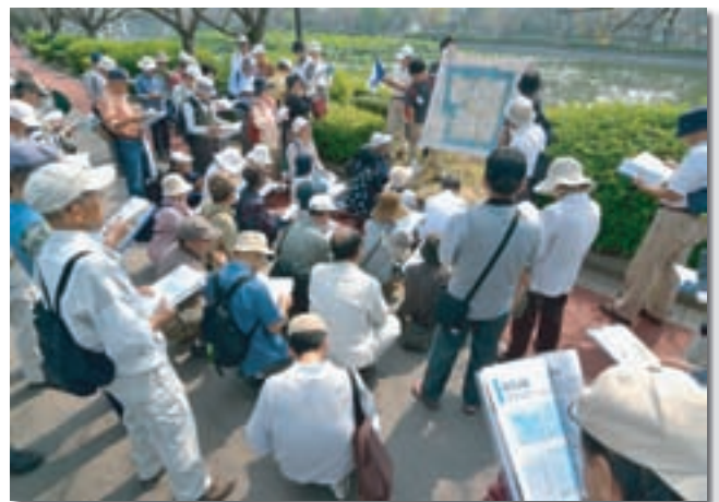
第2回 佐賀城内めぐりと天守台跡発掘現場の見学探訪会開催事業（ミュージアム）