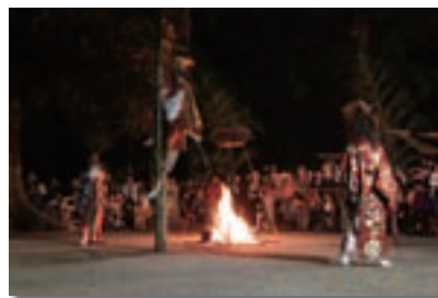
京築神楽鑑賞モニターツアー

育成するとともに、京築地域の文化遺産を活かした観光プログラムについて、試行的にツアーを実施します。