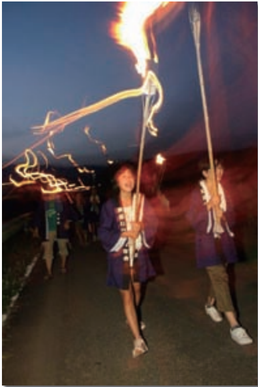
北川町家田（えだ）虫追い たいまつを掲げたこどもたちが、「♪～ともや～ ♪～ともや～ ♪おんともや～」と田んぼ道を歩いて回ります。 戦前は、全国各地で見られた懐かしいお盆の農行事でした。

このなかの特にめざましいものとしては、「能楽入門講演会」で、京都の能観世流シテ方十世片山九郎右衛門氏から直伝の稽古を受けたこどもたちが、平成24年4月1日に博多座での晴れの公演を見事に果たしています。