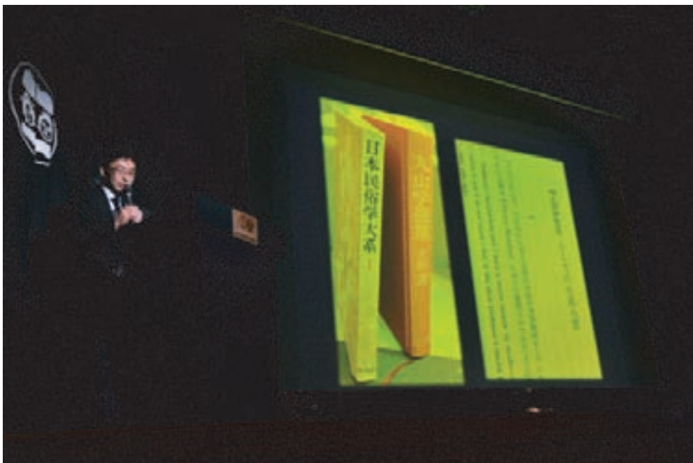
「小泉八雲来熊120年記念事業」における基調講演