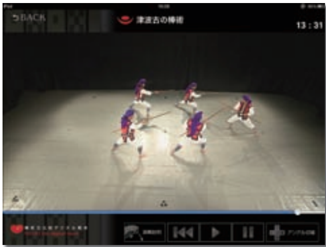
ipad用アプリケーション無形民俗文化財デジタル教本「南城演舞館」

市内の有形文化財を対象に、学校教育、生涯学習の教材や観光振興のための映像資料としての活用を目的として、周囲全方向の高精細写真で記録し、デジタル合成技術によりパソコン上でまるでその場に立っているような