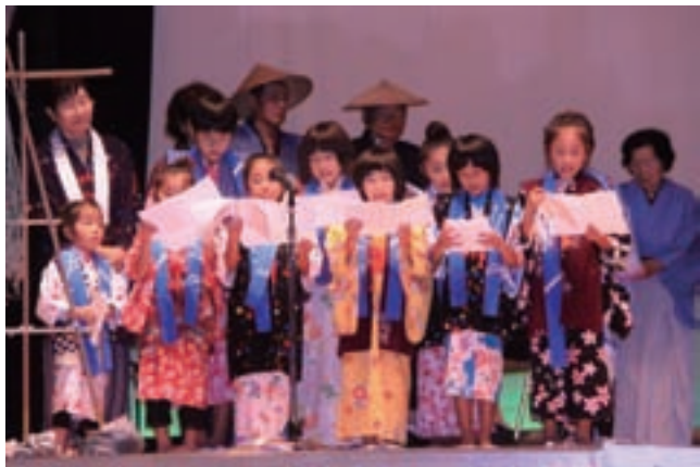
第8回カルチャーゾーンフェスタ (平成23年11月3日：延岡市社会教育センター)

郷土の先覚者や、郷土芸能を学習した出北(いできた)地区の住民・子どもたちが地域の活性化に向けて歩歩活動をはじめ、第8回「出北新嘗祭」を開催するなど地域間交流・世代間交流の「輪」も芽生えてきました。