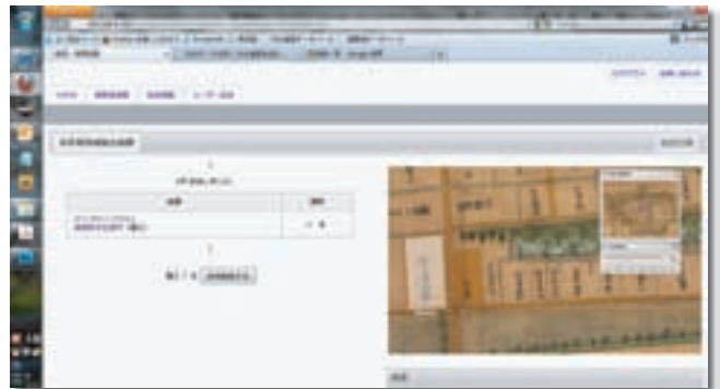
さが城下情報集約システム 御城下絵図活用事業（ミュージアム）