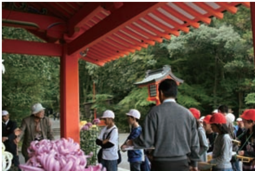
れきはく学校との連携： 宇佐市立和間小学校5年16名、6年28名の宇佐神宮文化財修復現場公開