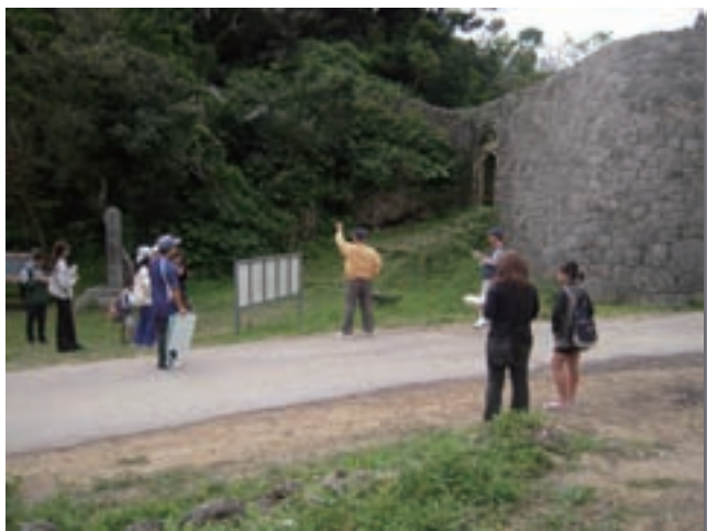
知念区 歴史体験学習の様子（知念城跡）

有形文化財VR（仮想現実）パノラマコンテンツ記録は文化遺産ポータルホームページ、スマートフォンアプリ用アプリケーション、デジタルサイネージいずれからも閲覧でき、これまで訪れるのが困難な場所にある文化財について、どこからでもその場にいるような疑似体験をすることができます。平成24年4月の南城市大里庁舎