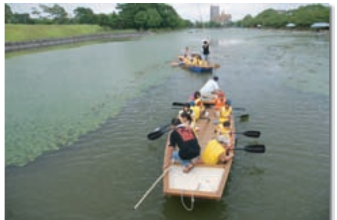
お濠めぐり舟の体験乗船（赤松小学校） さが城下塾開催事業講座（地域）