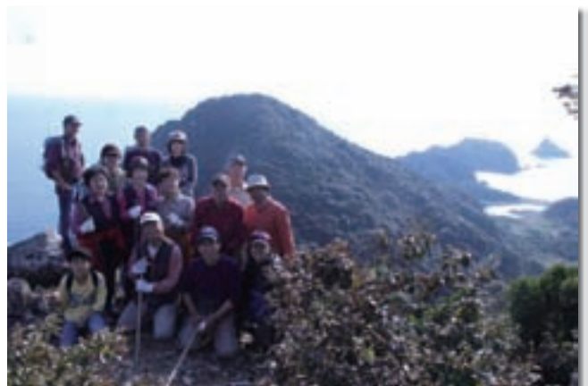
日向灘に浮かぶ離島 島野浦での「小さな手作りの旅 感動体験えんぱく」 （平成23年11月23日） 海の香をいっぱい吸い込みながら「十ヶ所観音様巡り」など「海の文化」を和気あいあい、終日楽しみました。