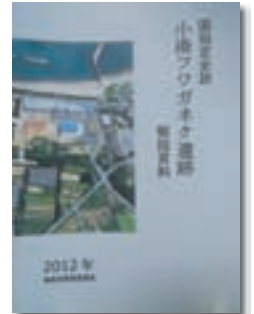
小湊フワガネク遺跡について解説した普及用の冊子

市民向けに開催する講座では、たとえば、土日の午前・午後に合計4回開催すると、定員30人募集に対して、毎回50人を超える申し込みがあり、土日だけで200人近い市民が講座に参加、講座を通して小湊フワガネク遺跡の学習をしていただいています。奄美大島・加計呂麻島でも、講座受講者がヤコウガイ・アクセサリーを観光商品化する事例が増加しており（現在約15業者）、小湊フワガネク遺跡やヤコウガイが観光振興に利用されはじめた手応えも感じられます。