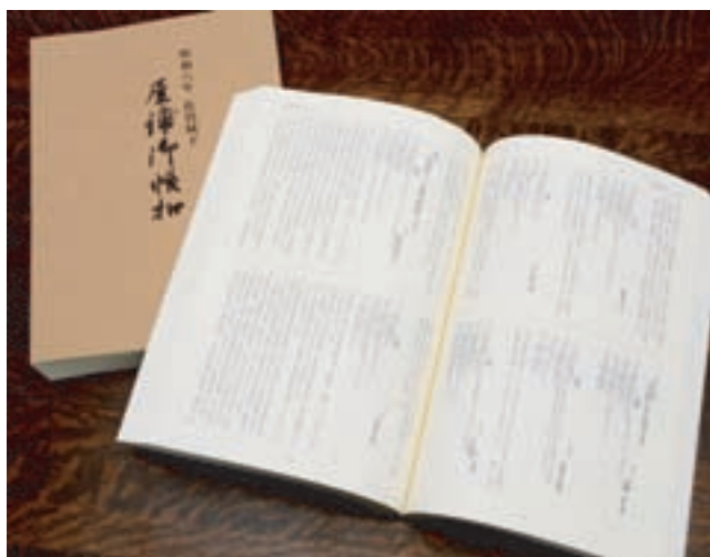
明和屋敷帳 明和屋敷帳出版事業（ミュージアム）