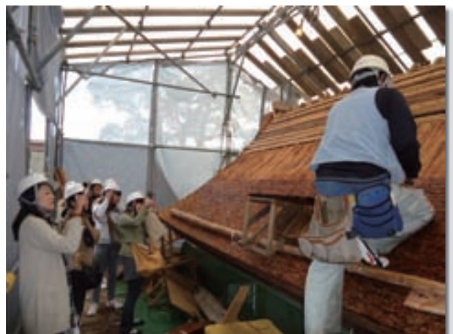
宇佐神宮境内公開活用事業： 宇佐神宮修復現場の状況

宇佐神宮は全国に広がる八幡社の総本宮であるとともに、全国各地から毎年約150万人の参拝者・観光客が来訪する大分県内でトップクラスの観光地でもあります。宇佐神宮では、平成9年以降境内の各所で建物等の修復を行っており、平成22年度からは大分県教育庁文化課が実施する「文化財の戦略的保存・活用事業」における文