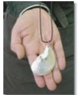
市民に大人気のヤコウガイ・アクセサリー（完成品）

市民向けに開催する講座では、たとえば、土日の午前・午後に合計4回開催すると、定員30人募集に対して、毎回50人を超える申し込みがあり、土日だけで200人近い市民が講座に参加、講座を通して小湊フワガネク遺跡の学習をしていただいています。奄美大島・加計呂麻島でも、講座受講者がヤコウガイ・アクセサリーを観光商品化する事例が増加しており（現在約15業者）、小湊フワガネク遺跡やヤコウガイが観光振興に利用されはじめた手応えも感じられます。