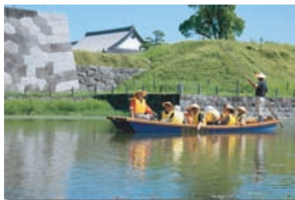
お濠めぐり舟の体験乗船 水辺再生事業（地域）