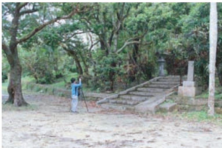
有形文化財VRパノラマ撮影の様子（佐敷上グスク）