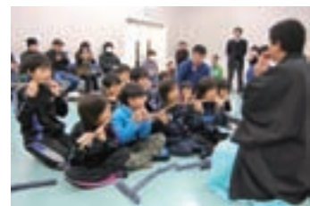
京築神楽体験事業

京築神楽の後継者育成の一環として、後継者となる人材を発掘するため、神楽団体を講師に迎え、京築地域内の小中学生を対象に、体験講座を行いました。