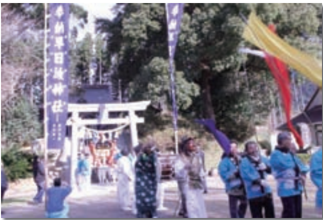
北方町「早日渡（はやひと）冬祭り」 住民総出で、地域伝統行事「早日渡冬祭り」を祝います。 お神輿行列が、早日渡集落内の各「御旅所（おたびじょ）」まで練り歩きます。

と連携し、「感動体験泊覧会『えんぱく』」と歴史講演会を11月に開催。さらに、平成24年3月には、観光庁の《国内スポーツ観光モニターツアー》として『神秘的島と山幸彦の里でスピリチュアルトレッキング』も計画されるなど離島の観光に弾みがついてきています。離島の住民が、自分たちが暮らす離島が秘めた魅力・潜在力を認識しはじめました。