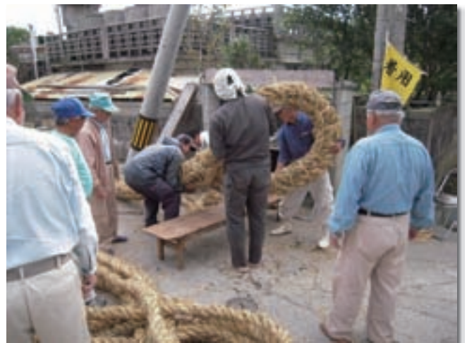
西原区 綱作りの様子

平成23年度計画を実施した効果として、まずは地域の文化遺産の保存継承を充実することができたことがあげられます。西原区アミシ綱曳きは毎年行われている地域行事の一つですが、長年綱作りは行われていませんでした。今回、この事業において地域住民が協同で綱作りを行ったことで、綱作りをしたことのない若い世代へ伝統行事の継承を行うことができました。2日間にわたり、