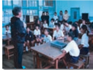
国指定史跡・小湊フワガネク遺跡に隣接する奄美市立小湊小学校での体験講座

ヤコウガイ・アクセサリー製作講座は、既に人気講座として定着しており、小湊フワガネク遺跡が所在する校区内の小中学校、博物館等で製作講座を繰り返し開催、地域住民や観光業界に小冊子の配布を進めていることで、理解の浸透が図れていると思います。