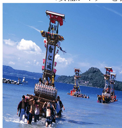
沖波の大漁祭り ＜海上へ渡御をする＞