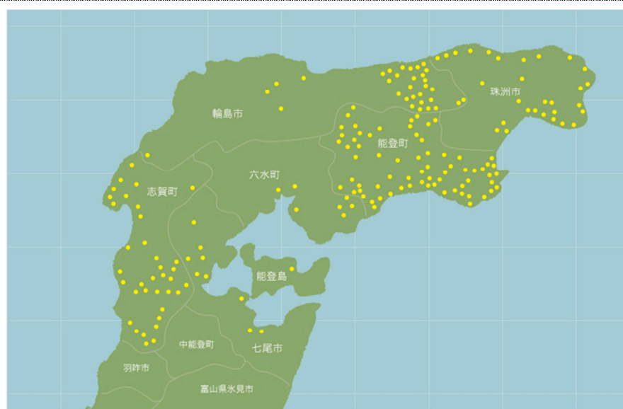
キリコ祭りの分布(能登全体を照らし出す)

はなく、集落の住民皆が祭礼を楽しんでいる点に注目しなければならない。祭り当日、集落の家々は玄関、道沿いの窓を開け放ち、親類や知人を招待して盛大にごちそうをし、親交を結び合う「ヨバレ」の慣行が今も行われている。集落全体が熱気を帯びるキリコ祭りは、都会に出た者が、正月や盆に帰省しなくても、キリコ祭りには必ず帰ってくるというくらいである。