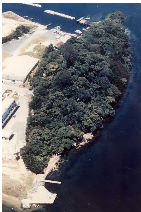
4. 唐島神社社叢タブ林