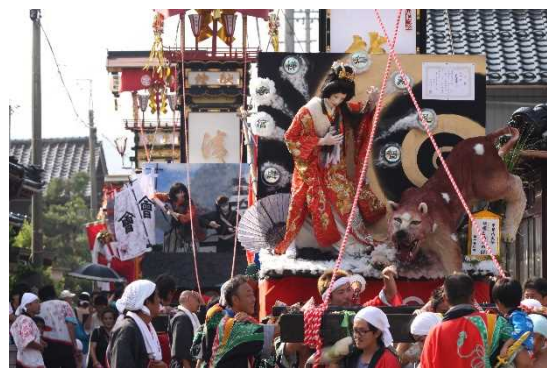
29. 松波人形キリコ祭り