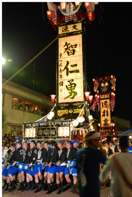
石崎奉燈祭 ＜重さ2トン、高さ15メートルの最大級のキリコを担ぐ＞