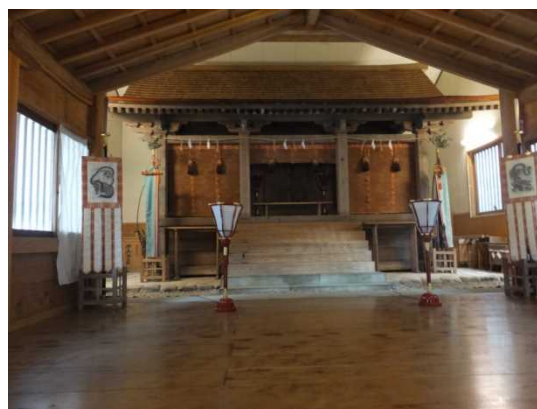
6. 藤津比古神社本殿