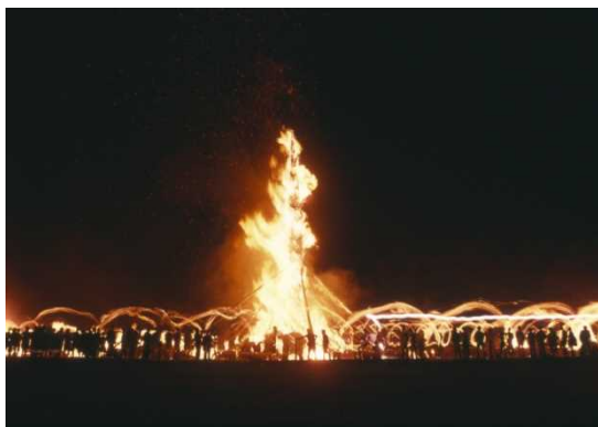
1. 能登島向田の火祭