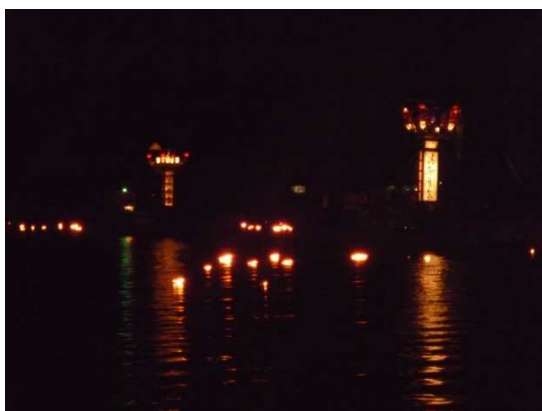
3. 塩津かがり火恋祭り