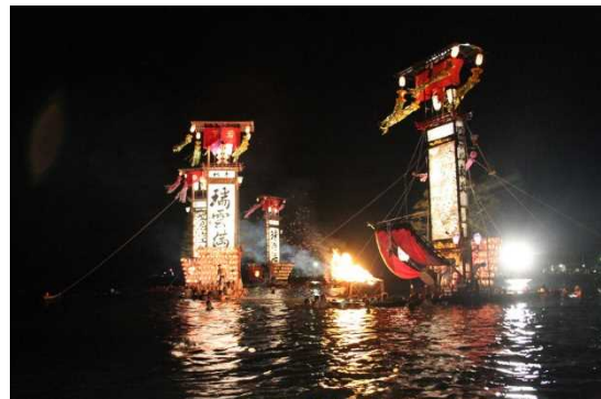
19. 宝立七タキリコ祭り