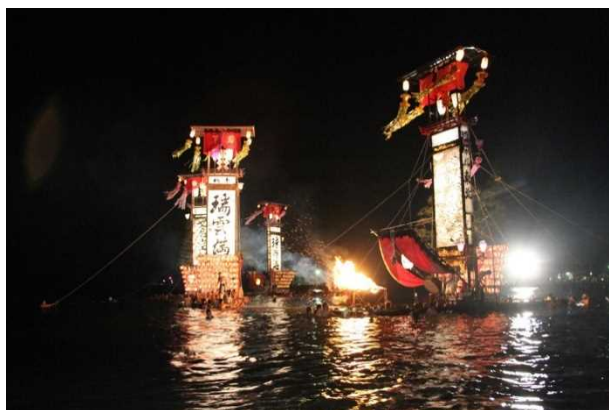
宝立七タキリコ祭り ＜大キリコが沖の松明を目指し乱舞＞

そして、これほどまでに灯籠神事が集積をした地域は全国を見ても唯一無二。夏、能登を旅すればキリコ祭りに必ず巡り会えると言っても過言ではなく、それはキリコが供奉する神々に巡り会う旅ともなるのである。