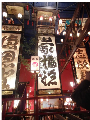
中島屋の大切籠 ＜輪島塗が施された江戸時代製作の大キリコ＞