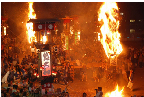
あばれ祭り（宇出津のキリコ祭り） ＜40基以上の多数のキリコが練り回る＞