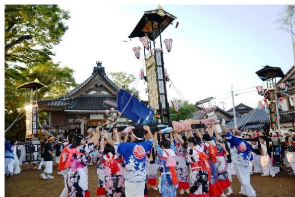
西海祭り ＜女性がキリコを担ぐ＞