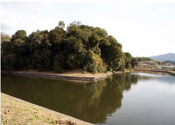
32 欽明天皇陵（檜隈坂合陵）