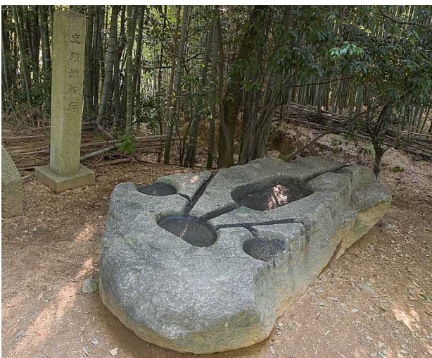
27 酒船石遺跡（亀形石槽）