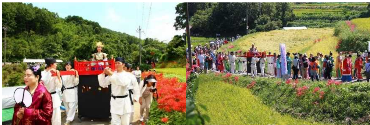
( 持統天皇 吉野行幸の再現 )

このように、飛鳥の女性を語ることから、日本が「国家」として歩み始め、東アジアを通じた世界観が見えてくる。飛鳥時代を牽引したのは女性であった。彼女たちの手によって、政治・宗教・文化の各方面で、我が国の新しい“かたち”が産み出されていった。「日本国」誕生に関わった女性の活躍をみると、世界の中でのこれからの新しい国の“かたち”に、女性の“ちから”が注目される。