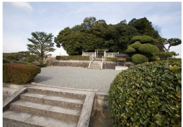
35 天武・持統天皇陵（檜隈大内陵）