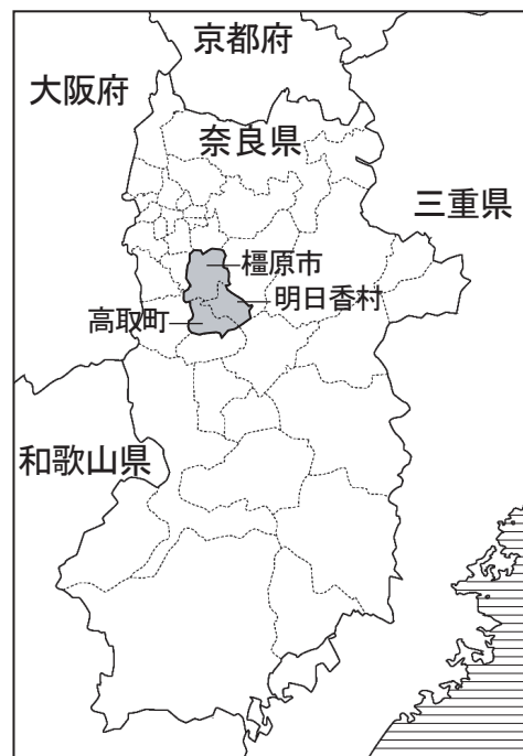
橿原市、高取町、明日香村の位置図