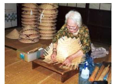
蘭桧笠製作（南木曽町）