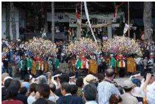
(南木曽町 田立花馬祭り)