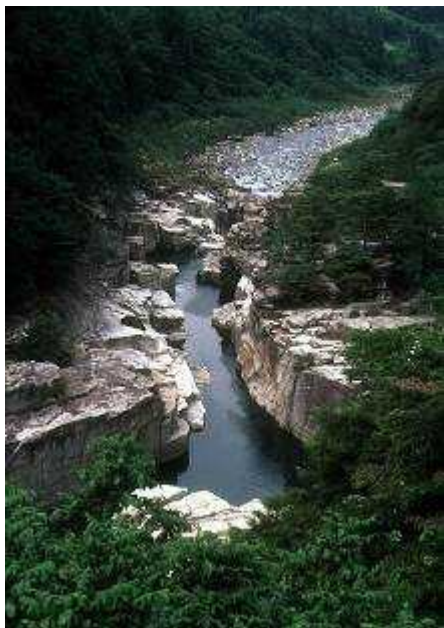
②④ ねざめ 寝覚めの床