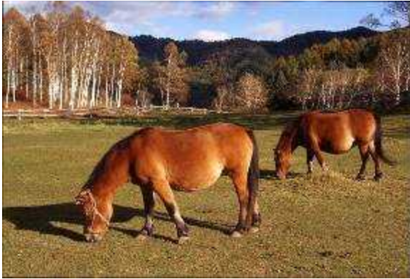
(木曽町開田高原 木曽馬の里)