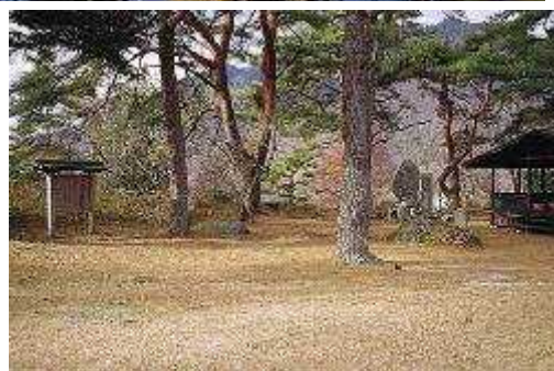
③⑭ いちこくとちたてばちや 一石枋立場茶屋