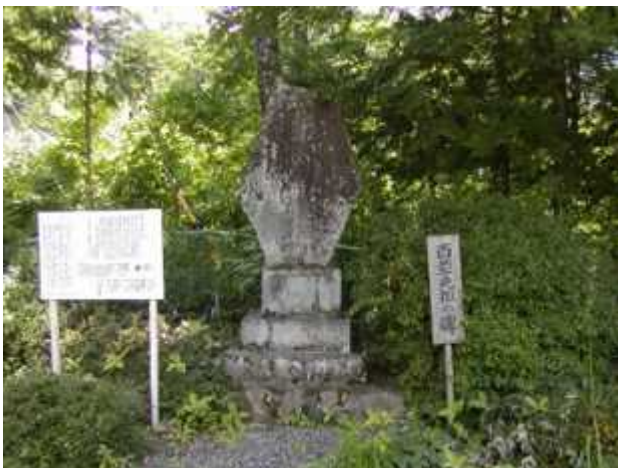
㉒ ひやくそうがんそ 百草元祖の碑