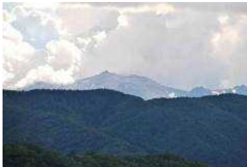
(峠から御嶽山を望む)