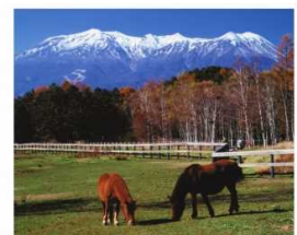
木曽馬と御嶽山(木曽町)