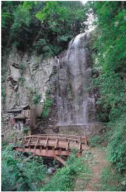
⑳ きよたき 清滝