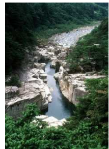
寝覚めの床（上松町）

文豪島崎藤村の『夜明け前』は「木曽路はすべて山の中」で始まる。木曽谷の山と木曽路は、木曽谷の人々の「山を守り、山に生きる」くらしを育んだ。そのくらしは、森林の保護、木曽路や宿場の保存、伝統工芸品の伝承を大切に思う心を、今も木曽谷に息づいている。