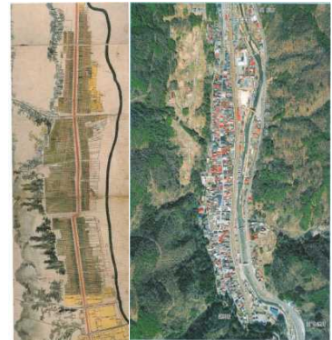
奈良井宿・江戸時代絵図（左）と現在写真（右）（塩尻市）