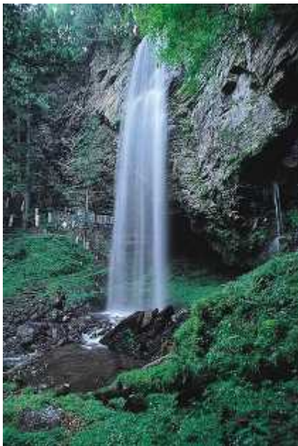
㉑ しんたき 新滝