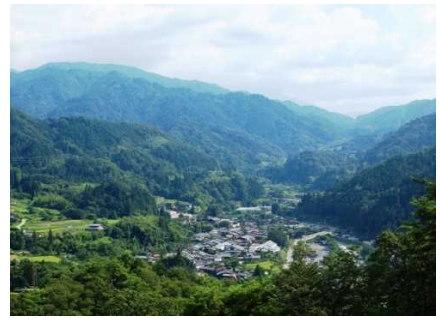
妻籠城跡から見た妻籠宿(南木曽町)

木曽路を包む木曽谷の約 9 割は森林地帯である。豊臣秀吉の時代、木曽地域は、狭い耕地の作物だけでは領民を養えない地域として、領民は米年貢（米の年貢）の代わりに木年貢（木の年貢）が課され、領民には木年貢を納めることで米が支給された。木年貢は、米が経済の基礎であった江戸時代になっても踏襲され、森林資源が木曽地域の人々の暮らしを支えていた。