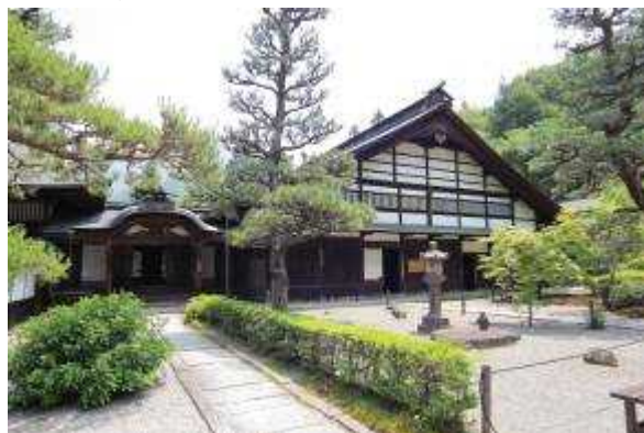
②⑧ じょうしょうじ 定勝寺