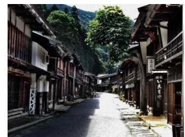
妻籠宿の町並み（南木曽町）