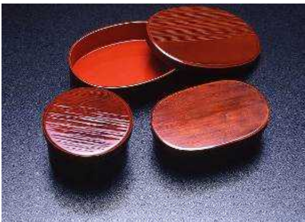
③ まげもの 曲物