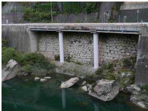
②⑤ かけはし 木曽の 棧