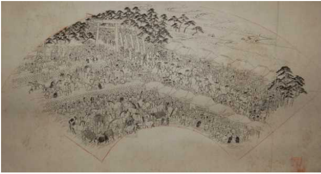
⑥- 1 江戸時代後期