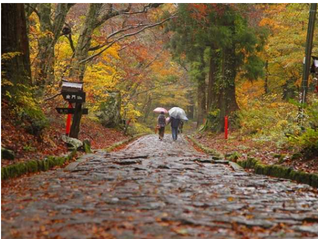
⑦大神山神社奥宮の石畳道