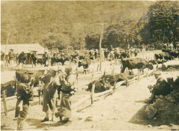
⑥- 2 昭和6年