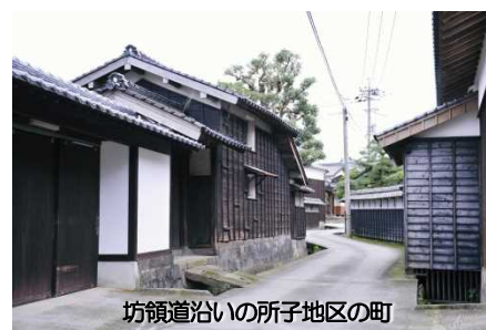
坊領道沿いの所子地区の町

横手道沿いで博労宿が軒を連ねた下蚊屋や御机の街道筋には往時の面影が、また、坊領道沿いの集落では各家で仔牛生産をした家屋の配置や牛繋ぎ石などが今も残っています。とりわけ、所子の農家では、牛が母屋と同じ屋敷地の中に建てられた厩で飼われ、大山の山頂で汲まれた霊水や摘まれた薬草を仔牛に含ませるなど、牛馬市に出す牛を大切に育てていた当時のようすをよくとどめています。