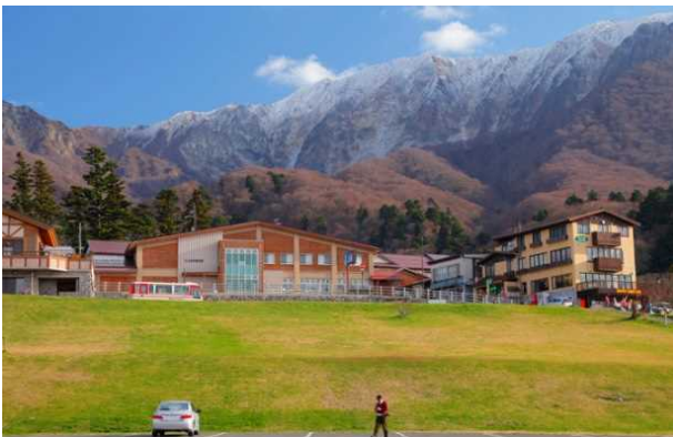
⑥- 3 現 在