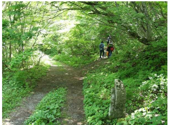
⑮大山道（横手道）と一町地蔵