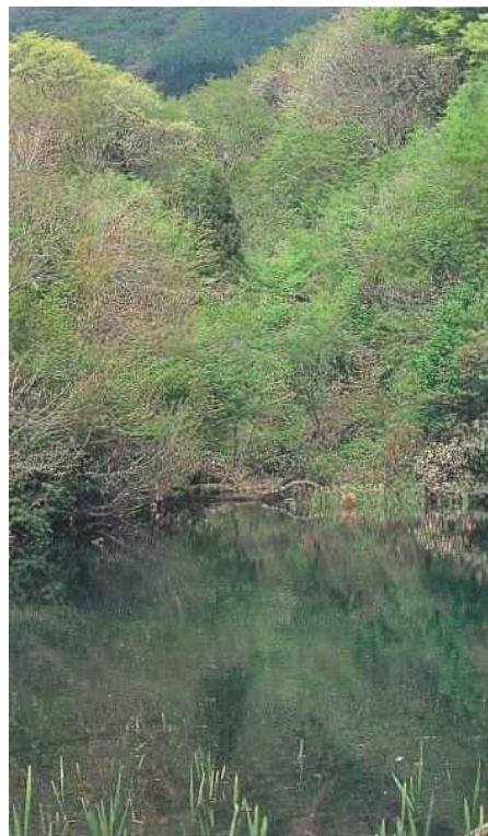
⑮はまなんご神事 (硯ヶ池)