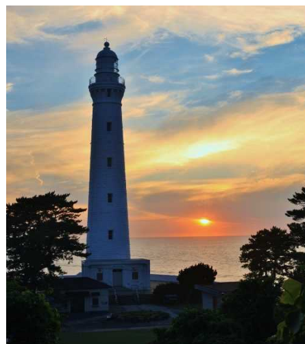
出雲日御碕灯台と夕日