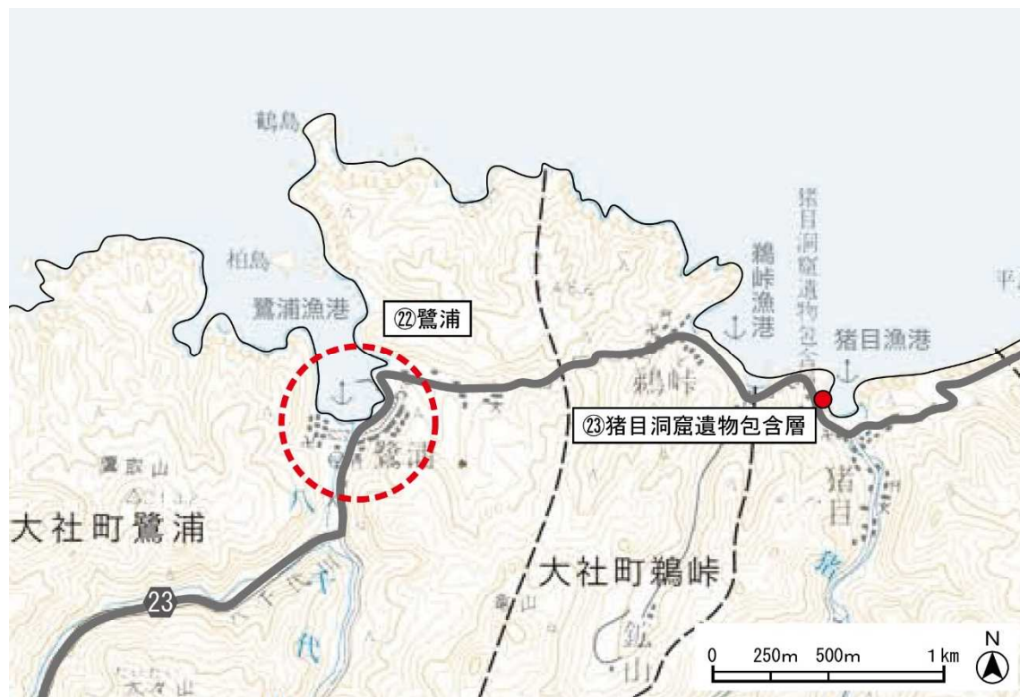
< 鷺浦・猪目地域 >