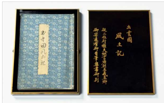
⑮ 出雲国風土記 (日御碕本)