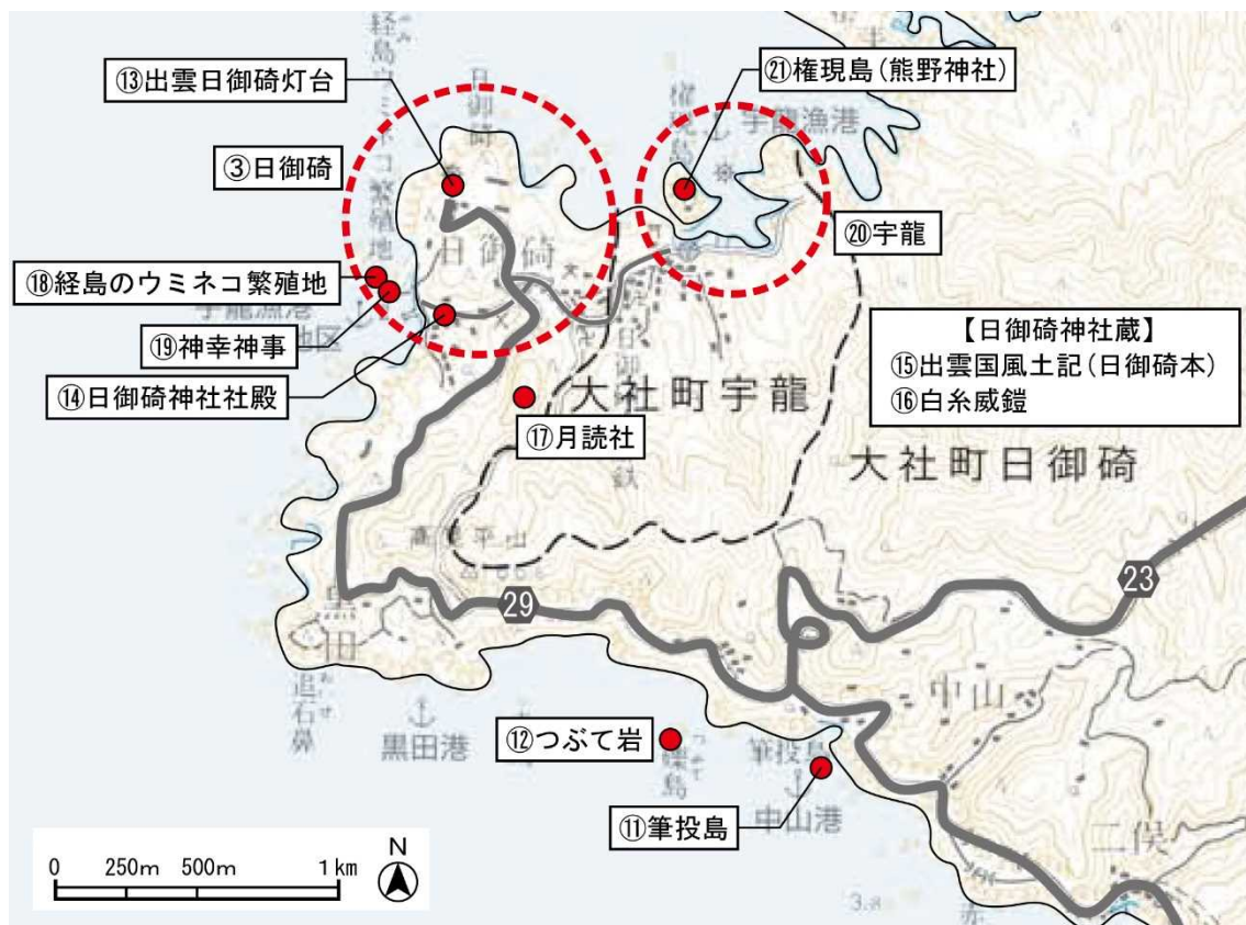
<日御碕・宇龍地域>