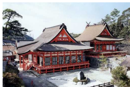
日御碕神社の日沉宮