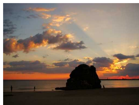
夕焼け空と弁天島