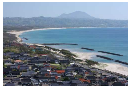
稲佐の浜（菌の長浜）