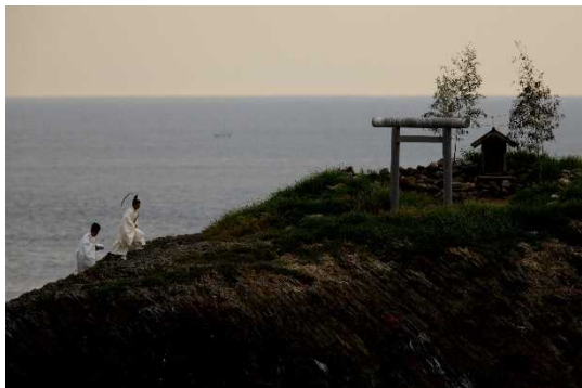
⑲神幸神事