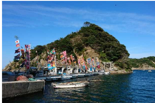
⑳宇龍・㉑権現島 (熊野神社)