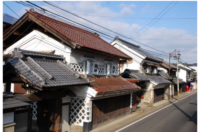
店と門が交互に並ぶ町並み