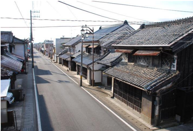
保存地区中心部の景観