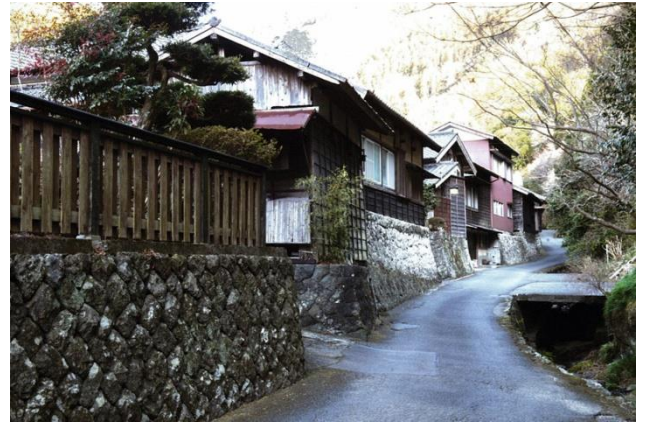
石垣と附属屋が連続する家並み