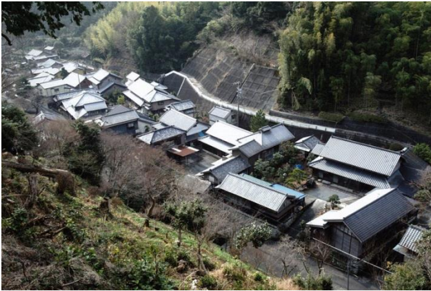
保存地区中心部の景観