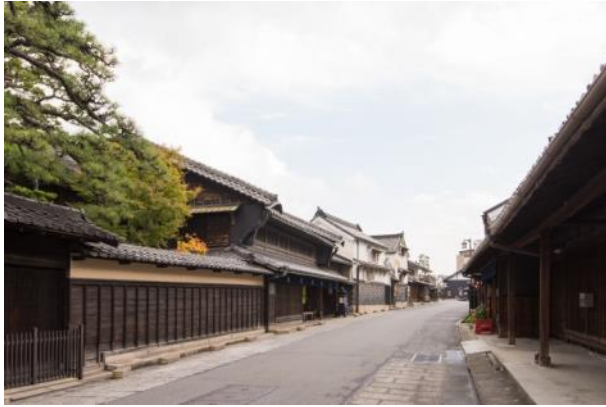
東海道沿いの町並み