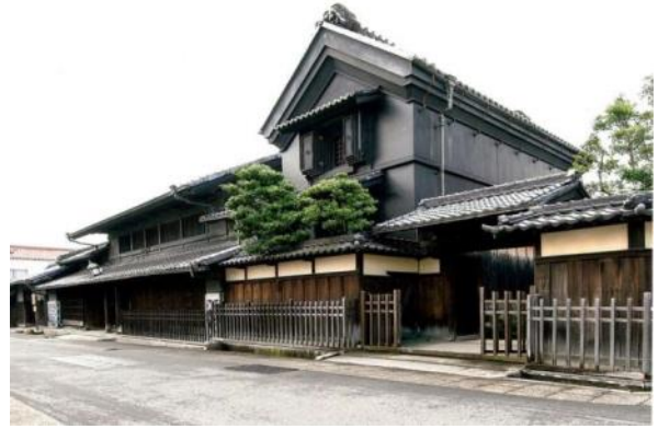
絞商の広大な屋敷構え