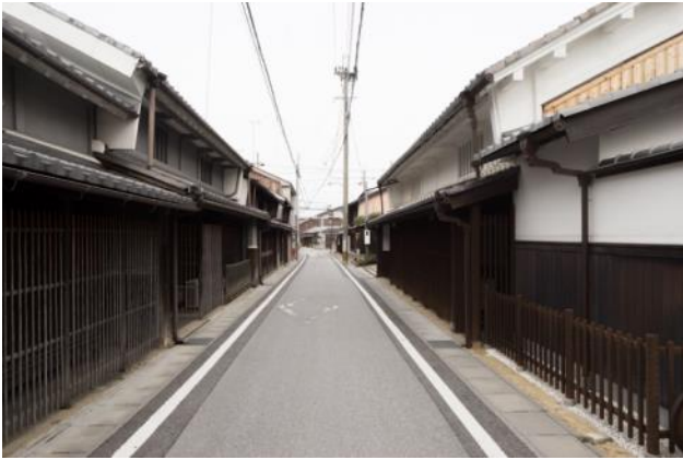
芹町（旧善利新町）の町並み つし二階の伝統的な町家が連なる