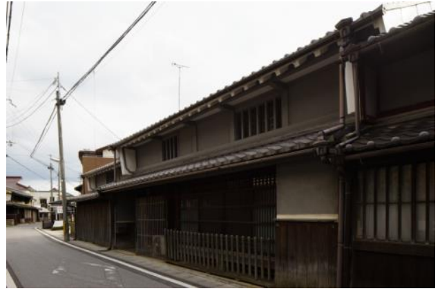
保存地区の伝統的な町家 虫籠窓や袖うだつを持つ古い形式の町家