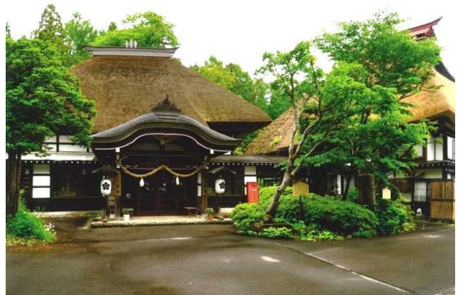
保存地区の伝統的な宿坊

戸隠高原の南向き斜面に広がる宝光社の集落