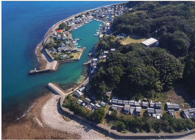
空から見た出羽島の集落