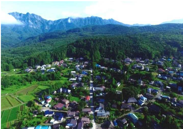
空から見た戸隠の集落

戸隠高原の南向き斜面に広がる宝光社の集落