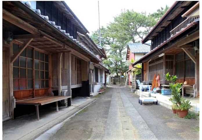
砂嘴上に形成された町並み