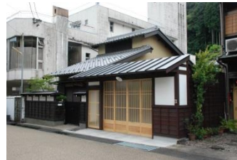
防災事業の例 (消火栓)