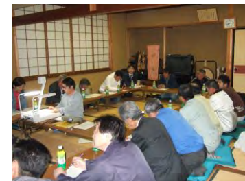
毎月開催の定例会

昭和46年から保存活動をスタートした先人先輩方。昭和51年の重伝建選定を追い風に、住民が力を合わせて合掌家屋を守ってきました。それが世界遺産登録につながり、多くの人々が訪れる地となりました。私たちはこの合掌集落に生活できることを誇りに、先人や今を生きる住民、ご支援くださる行政・有識者をはじめとする全ての方々への感謝を忘れず、次代を担う子どもたちに胸を張ってつなげていけるよう努力を続けて参ります。