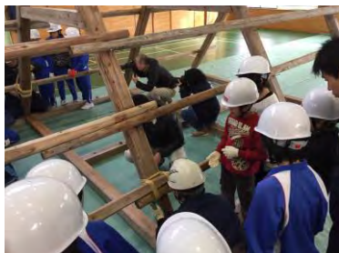
合掌造り小屋組み組み立て授業(地域の職人さんから伝統技術を学ぶ)