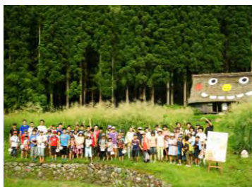
ゴブリンアートプロジェクト