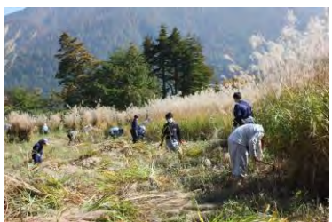
白川郷学園茅刈り作業