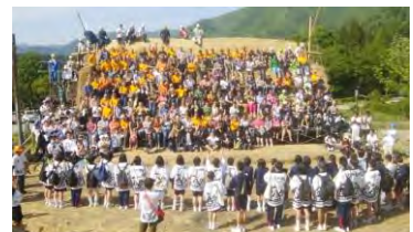
国際茅葺き会議への参画