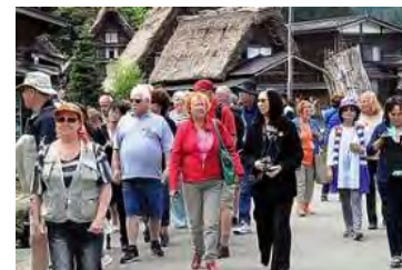
外国人観光客増加