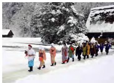
伝統芸能の継承(春駒)