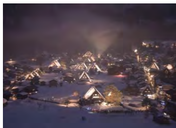
冬のライトアップ