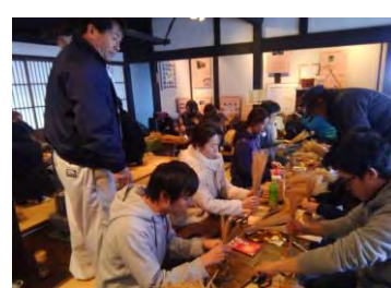
ミニ茅ニューづくり