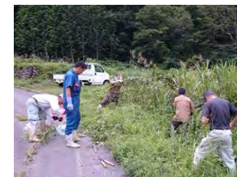
大ハンゴン草の除去作業