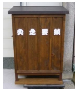
消火栓機材格納箱 (防災事業)