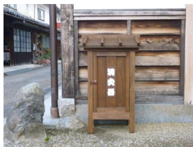
街かど消火器(防災事業)