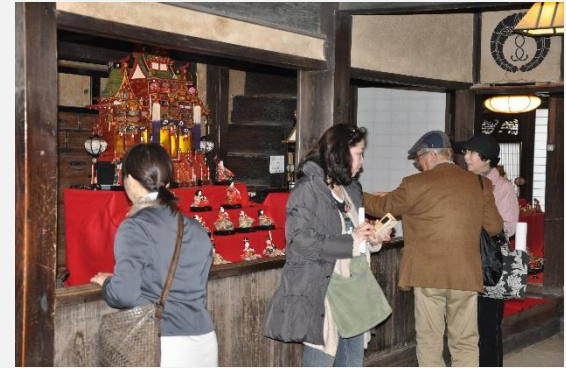
鞆・町並みひな祭り