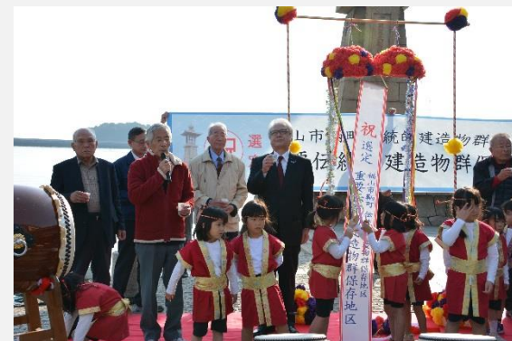
重伝建選定祝賀会