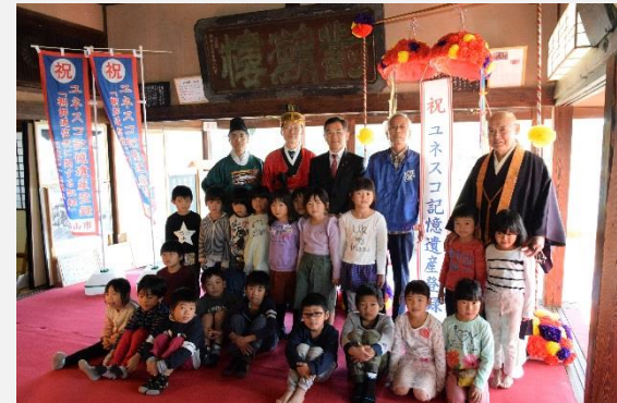
ユネスコ記憶遺産(世界の記憶)登録祝賀会