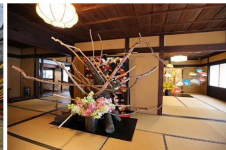
華道家假屋崎省吾「うだつをいける」