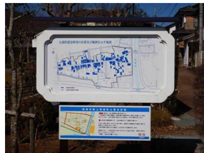
・案内板設置の例