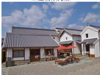
観光交流センター