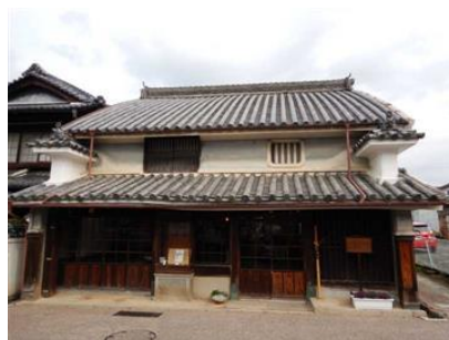
サテライトオフィス