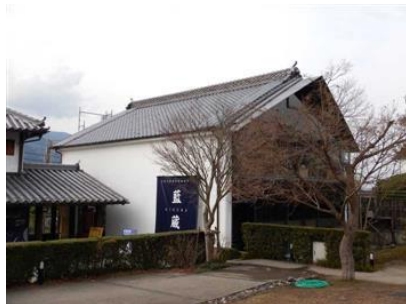
飲食・土産物販売店