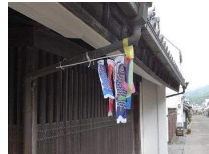
鯉のぼりの飾り付け