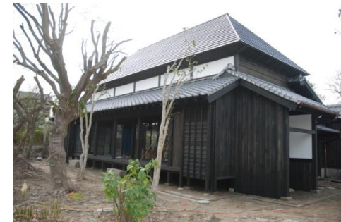
空き家を改修した宿泊施設