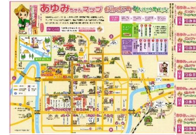
食べあるき・まちあるきMAP

(一財)飢肥城下町保存会が中心となり、飢肥城下町周辺の店舗と連携をし、地元特産の食べ物や手作り商品と引き替えしながら、飢肥の施設や町並みを楽しんでもらう食べあるき・まちあるき事業に取り組んでいる。