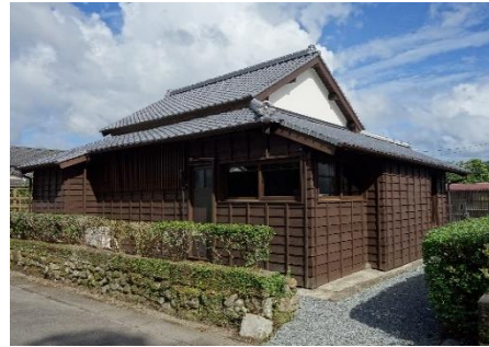
サテライトオフィスの様子